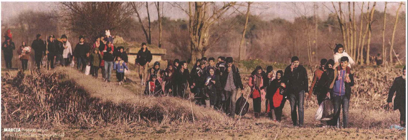
MARCIA Profughi siriani verso il confine turco-greco