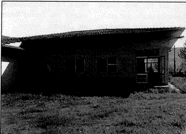
Τα τζάμια από τα παράθυρα σπασμένα, η πόρτα ανοικτή, γίδια έβοσκαν γύρω. Το ταβάνι είναι έτοιμο να ξεκολλήσει. Παρατημένο κτίριο. Πως επιτρέπεται να υπάρχει μια τέτοια κατάσταση σ' ένα κτίριο για το οποίο δαπανήθηκαν τόσα χρήματα και μένει ανεκμετάλλευτο; Αν μείνει ακόμη λίγο έτσι, θα γίνει στάβλος. Ακούει κανείς;