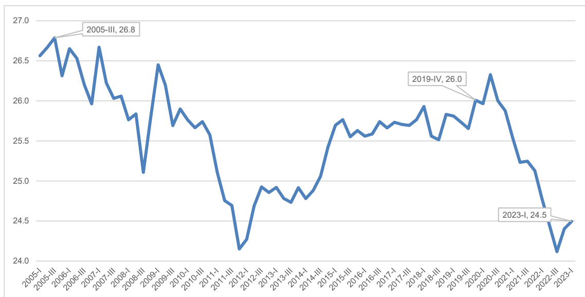
Gráfico 1. Participación del PIB de BOGOTÁ dentro de COLOMBIA (precios corrientes y series ajustadas por efecto estacional)

La participación de la economía de Bogotá dentro de la capacidad de generación de riqueza a nivel nacional ha caído. En efecto, como se puede ver en el Gráfico 1, la economía de Bogotá, en su historia reciente ha perdido una importante participación dentro del PIB de Colombia.