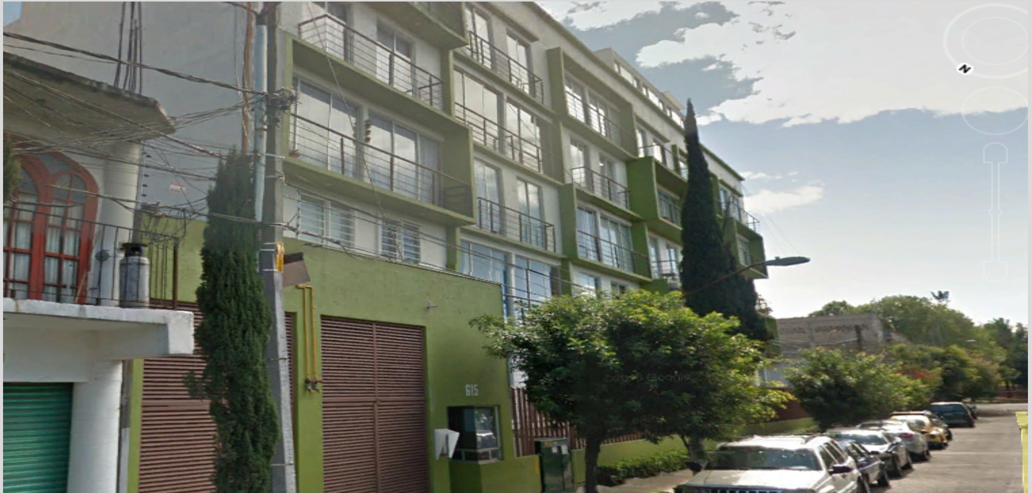
Condominio “Residencial Amate”, Ciudad de México