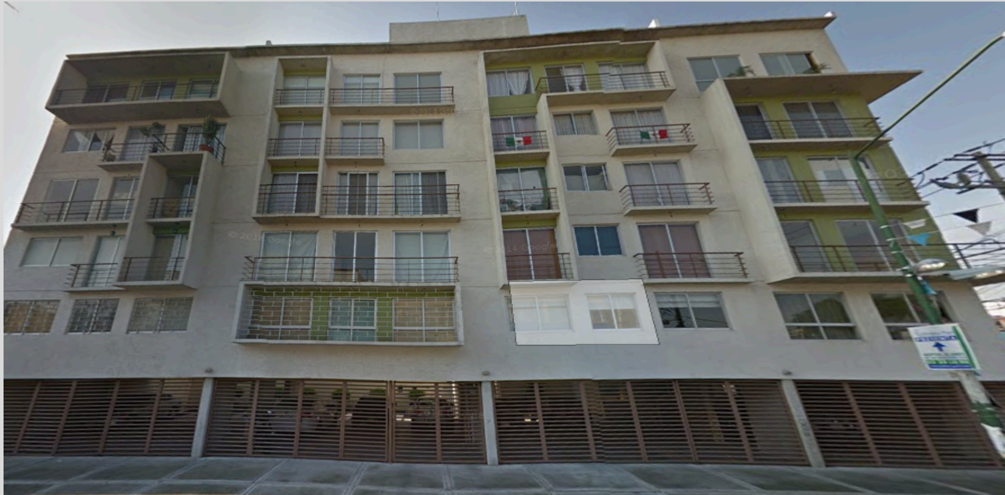
Condominio Ahorro Postal, Ciudad de México