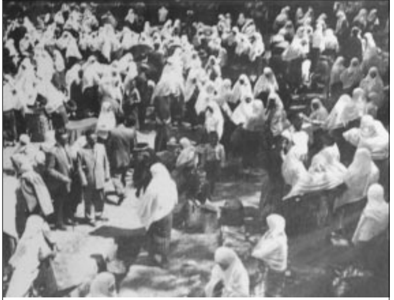
1950'lerde pazar.