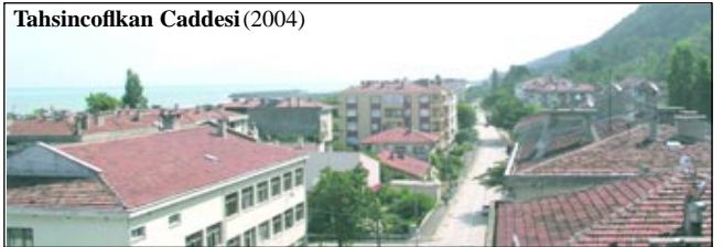
Tahsinciflikan Caddesi (2004)