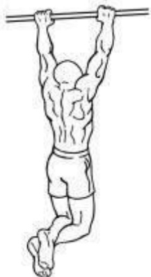
Figura 2 – Posição inicial 01 e, posição final 03.

b.2 Número de repetições: conforme tabela “Anexo V”.