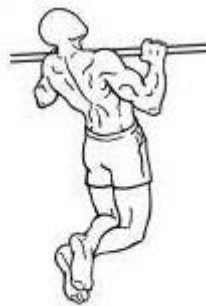
Figura 3 – Posição 02 intermediária.