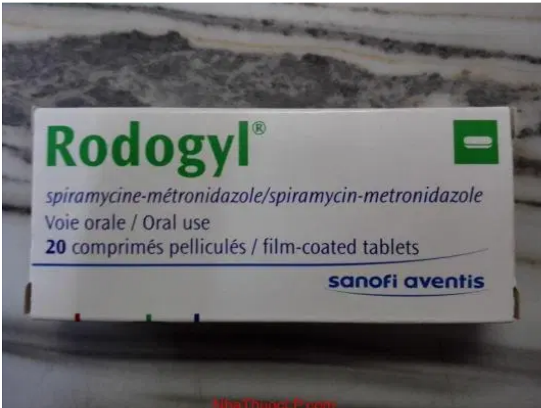
Thuoc Rodogyl chua metronidazol va spiramycin dieu tri nhiem trung rang tphcm hanoi (2)