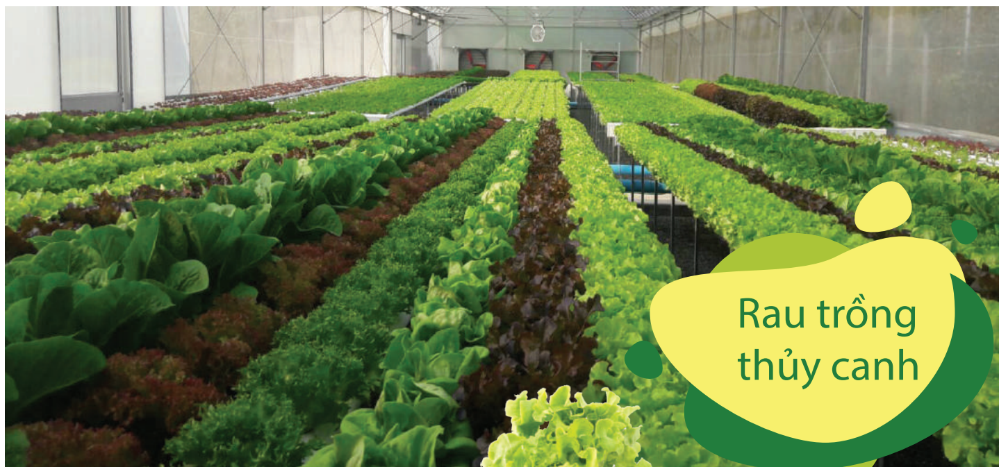
Rau trồng thủy canh