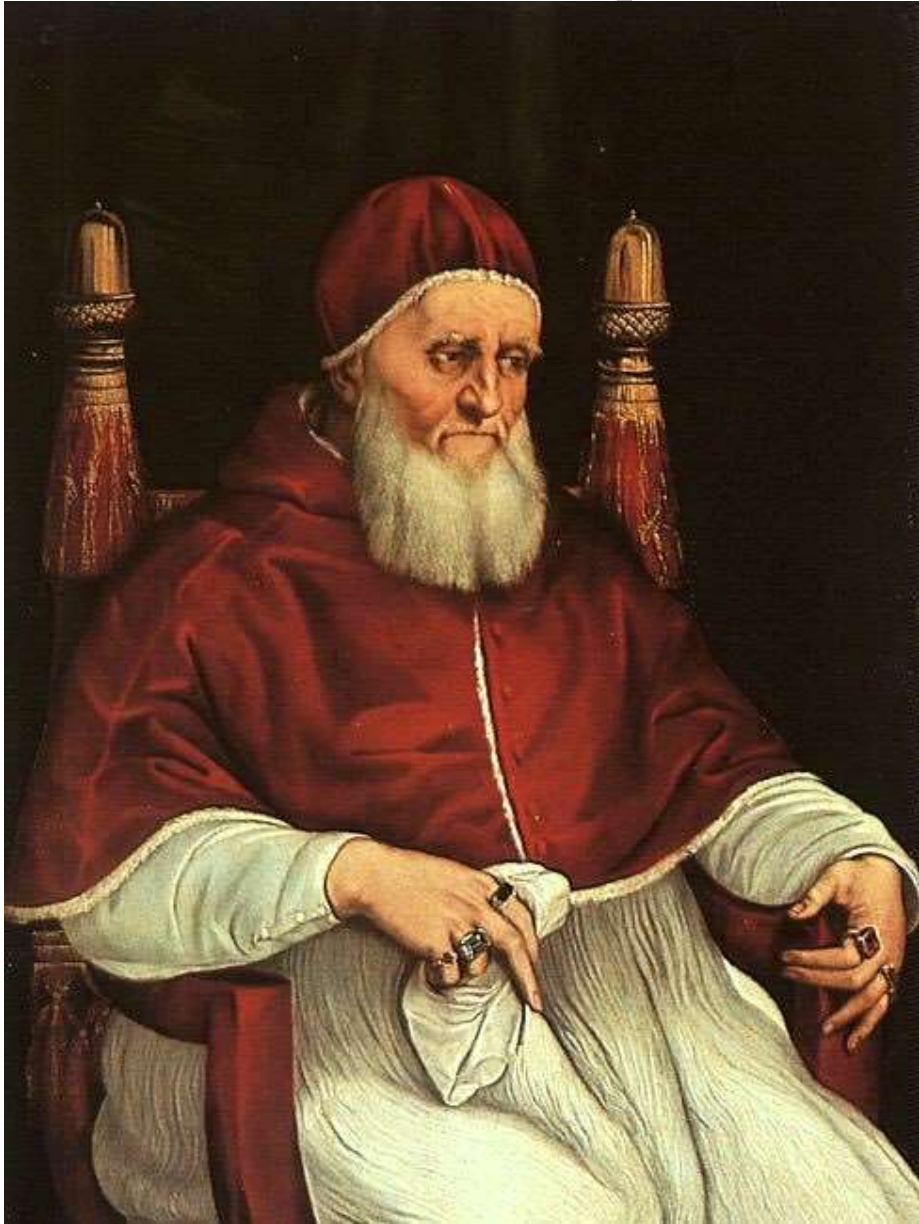
Pope Gregory IX

أعتبر "أدامانتيوس كوراي" (Adamantios Korais) النار المقدسة أحد أنواع الغش الديني في بحثه "عن النور المقدس بالقدس" (On the Holy Light of Jerusalem). وأشار إلى الحدث بأنه "مكائد كهنوتية احتيالية" (machinations of fraudulent priests) و"الضوء بـ" غير المقدس" (unholy) وكونه فقط "معجزة لكسب النقود والأموال والأرباح" (a profiteers' miracle) من البسطاء