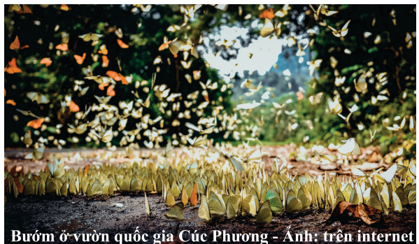
Bướm ở vườn quốc gia Cúc Phương

Vườn quốc gia Cúc Phương như một thiên đường xanh trong trẻo là một sự lựa chọn hoàn hảo cho những chuyến du lịch trong những ngày đầu hè, càng đặc biệt hơn đến với Cúc Phương vào mùa bướm du khách sẽ càng choáng ngợp trước những tầm thắm sắc màu được dệt nên bởi hàng trăm ngàn con bướm. Mùa bướm ở Cúc Phương đẹp yên ả và thanh bình đã trở thành điểm du lịch sinh thái nổi tiếng và hấp dẫn khiến cho du khách cứ mãi vấn vương./.