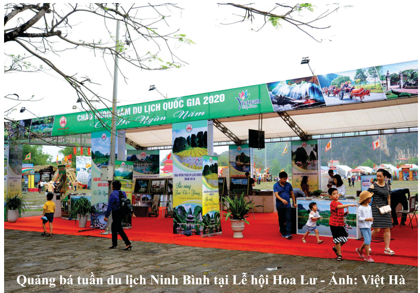
Quảng bá tuần du lịch Ninh Bình tại Lễ hội Hoa Lư

Trong dịp diễn ra sự kiện này, với vai trò là đơn vị đi đầu trong công tác tuyên truyền, quảng bá, xúc tiến du lịch, Trung tâm Thông tin Xúc tiến Du lịch Ninh Bình đẩy mạnh công tác quảng bá, giới thiệu những nét đặc sắc hấp dẫn, giá trị nổi bật về tài nguyên du lịch của Ninh Bình tới các hãng lữ hành, các cơ quan thông tấn báo chí cùng đông đảo du khách trong nước và quốc tế thông qua việc giới thiệu Tuần du lịch Ninh Bình năm 2019 với chủ đề “Sắc vàng Tam Cốc - Tràng An” tại các