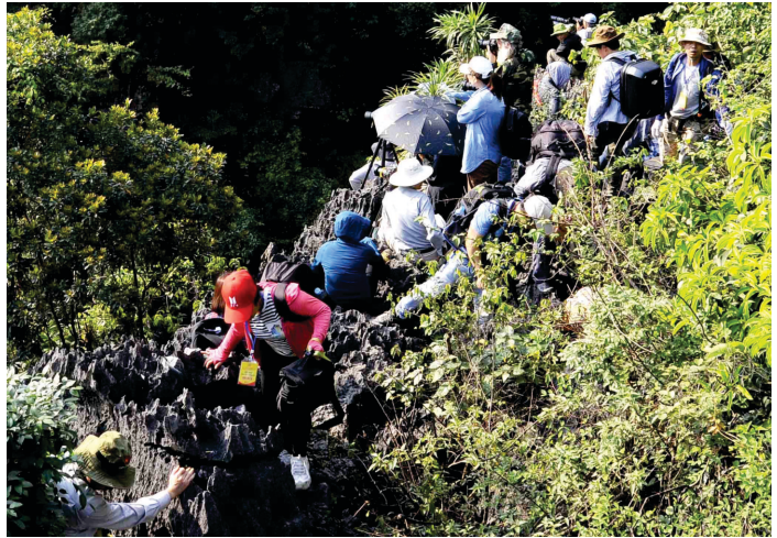
Các nghệ sỹ tác nghiệp trên các ngọn núi - Ảnh: Xuân Lâm

lịch Hang Múa là đối tượng tác nghiệp của các nhiếp ảnh gia và du khách. Chương trình Photo tour "Sắc vàng Tam Cốc - Tràng An" năm nay đã thu hút hơn 80 nhiếp ảnh gia đến từ các Câu lạc bộ, Hội nghệ sỹ nhiếp ảnh, báo chí và những người thích chụp ảnh của Ninh Bình, Hà Nội, Hải Phòng, Hải Dương,... đặc biệt là có 02 nghệ sỹ nhiếp ảnh đến từ tỉnh Lâm Đồng thuộc vùng Tây Nguyên.