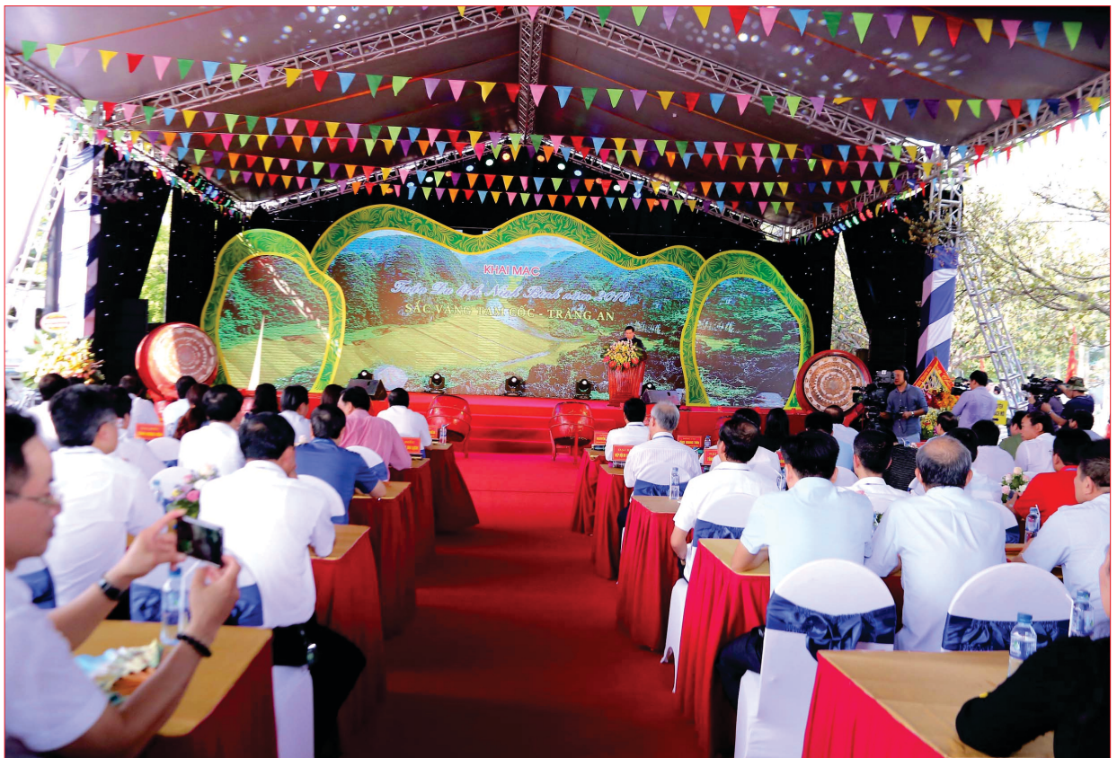
Quang cảnh lễ Khai mạc Tuần du lịch Ninh Bình