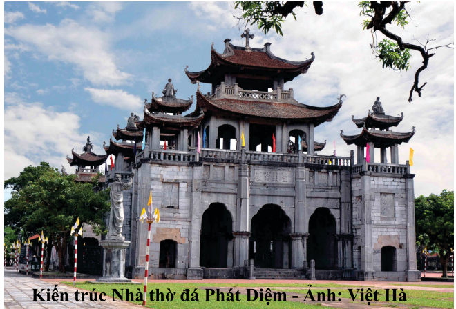
Kiến trúc Nhà thờ đá Phát Diệm

Có diện tích tổng thể lên tới gần 3.000m 2 , quần thể Nhà thờ đá bao gồm nhiều hạng mục khác nhau như: ao hồ, tượng đài, Phương Đình, Nhà thờ lớn, Nhà nguyện kinh thánh Rô Cô, Nhà nguyện kinh trái tim chúa, Nhà nguyện kinh thánh Giu-Se, Nhà nguyện kinh thánh Phê-Rô và các hang đá nhân tạo... Tất cả được bố trí trên một mặt bằng tổng thể hình chữ “Vương”, không gian đóng mở theo phong cách tạo cảnh