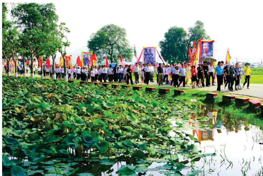
Lễ hội Làng Sen

Ngoài ra, khu di tích còn là địa điểm tổ chức nhiều buổi sinh hoạt chính trị lớn, những nghi lễ của các cấp chính quyền, đoàn thể, đồng thời cũng là điểm tham quan du lịch hấp dẫn đối với du khách trong và ngoài nước, góp phần tuyên truyền, giáo dục truyền thống yêu nước và lòng tự hào dân tộc, đặc biệt là cho thế hệ trẻ.