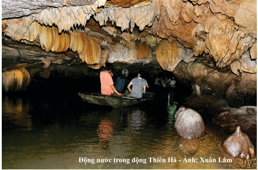
Động nước trong động Thiên Hà

Nằm trong vùng Di sản thế giới - Quần thể danh thắng Tràng An, khu du lịch sinh thái động Thiên Hà là điểm đến hấp dẫn với vẻ đẹp huyền ảo, hoang sơ. Nơi đây đã được nhiều du khách gắn với những mỹ từ như "lâu đài đá" hay "dải ngân hà trong lòng núi".