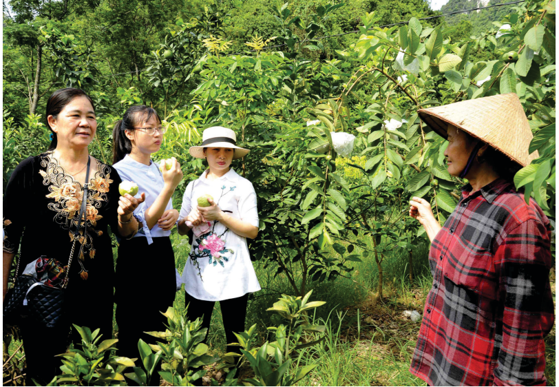
Du khách được trải nghiệm ngay tại vườn

Thu nhập của nông dân từ sản xuất nông nghiệp chỉ chiếm 27%. Trong khi đó, thu nhập từ các hoạt động phi nông nghiệp và dịch vụ chiếm 73%. Thế nhưng, tỷ lệ này vẫn không đồng đều giữa các địa phương trong tỉnh. Những địa phương có kế hoạch phát triển du