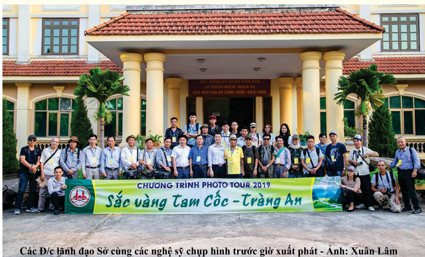
Các Đ/c lãnh đạo Sở cùng các nghệ sỹ chụp hình trước giờ xuất phát - Ảnh: Xuân Lâm

Khu du lịch Tam Cốc - Bích Động nằm trong vùng lõi của Di sản Văn hóa và Thiên nhiên thế giới - Quần thể danh thắng Tràng An với hệ thống các hang động, núi đá vôi, cánh đồng lúa nước tuyệt đẹp. Cuối tháng 5, đầu tháng 6, bầu trời trong xanh, những tia nắng vàng rực rỡ hòa quyện cùng những bông lúa chín ngả vàng đan xen màu xanh của lá, trải dài hai bên dòng sông Ngô Đồng đã tạo nên một khung cảnh thiên nhiên tươi đẹp đến nao lòng. Thời điểm này chính là khoảnh khắc đẹp nhất trong năm ở Tam Cốc, thời điểm vàng dành cho những nhiếp ảnh gia đam mê với môn nghệ thuật nhiếp ảnh.