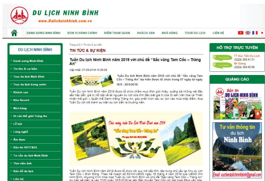
Quảng bá tuần du lịch Ninh Bình trên internet

phương tiện thông tin đại chúng: Thiết kế, đăng tải banner Tuần Du lịch Ninh Bình năm 2019 “Sắc vàng Tam Cốc - Tràng An”; cập nhật kịp thời và đầy đủ tin bài phản ánh các hoạt động trước và trong thời gian diễn ra Tuần Du lịch Ninh Bình... Phối hợp với Văn phòng Sở Du lịch tuyên truyền trực quan bằng băng rôn, khẩu hiệu trên các trục đường chính tại thành phố Ninh Bình, in ấn tạo dựng nhiều pa-nô (khổ lớn) giới thiệu hình ảnh chủ đề “Sắc vàng Tam Cốc - Tràng An” tại các tiền sảnh, trong khuôn viên các khách sạn lớn, các khu điểm du lịch trên địa bàn toàn tỉnh.