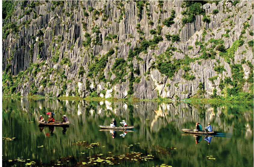
Núi Mèo Cào được xếp kỷ lục “Bức tranh tự nhiên lớn nhất”

Với diện tích trên 3.000 ha, 3/4 diện tích là núi đá vôi, 1/4 là đất ngập nước, sở hữu hệ sinh thái đa dạng và phong phú Khu Bảo tồn thiên nhiên đất ngập nước Vân Long là vùng đất ngập nước nội địa nguyên vẹn còn sót lại ở Đồng bằng sông Hồng gồm các dòng sông, hồ nước nông và thảm thực vật ngập nước phong phú, mang các đặc tính sinh thái đặc thù tạo nên cảnh quan thiên nhiên độc đáo. Nơi đây được bao bọc bởi hệ thống đá vôi với nhiều hang động đẹp và thảm thực vật đặc trưng cho hệ sinh thái núi đá vôi, là môi trường sống chính của loài Voọc mông trắng, một trong những loài linh trưởng đang bị đe dọa tuyệt chủng ở mức toàn cầu và chỉ còn ở Việt Nam. Khu Bảo tồn thiên nhiên đất ngập nước Vân