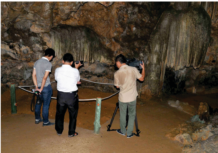
Dấu tích của người Việt cổ trong động Thiên Hà

Theo nghiên cứu của các nhà khoa học Anh, động Thiên Hà là một quần thể hang động sống. Bởi sự phát triển của các lớp địa chất nơi đây vẫn đang tiếp diễn một cách mạnh mẽ. Thể hiện rõ nhất là sự phát triển của các măng đá trong động vẫn được các giọt nước liên tục bào mòn tạo thành những nhũ đá kỳ vĩ và huyền diệu. Đặc biệt, hang hầu như còn giữ nguyên vẹn vẻ hoang sơ với hàng vạn con dơi sinh sống.