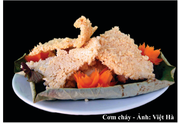
Cơm cháy

Được biết đến là món ăn đặc sản đã có từ lâu trở thành thương hiệu của vùng đất Hoa Lư. Dê ở đây được chăn nuôi thả tự nhiên tại các đồi núi đá vôi nên chất lượng luôn đứng hàng đầu. Thịt dê có thể chế biến được rất nhiều món ăn như: nem dê, dê hấp, nhưa mặn, dê nướng,... nhưng ngon và hấp dẫn nhất là món tái dê. Trải qua nhiều công đoạn cẩn thận tỉ mỉ từ khâu xử lý, tẩm ướp gia vị, chế biến mới cho ra được món tái dê thơm ngon. Lấy lá sung, mơ lông, bánh đa