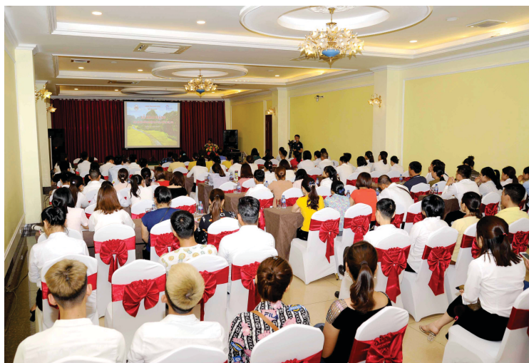
Quang cảnh lớp bồi dưỡng

Kết thúc lớp bồi dưỡng, Sở Du lịch tỉnh Ninh Bình đã trao 150 Giấy chứng nhận bồi dưỡng nghiệp vụ cho học viên đủ điều kiện./.