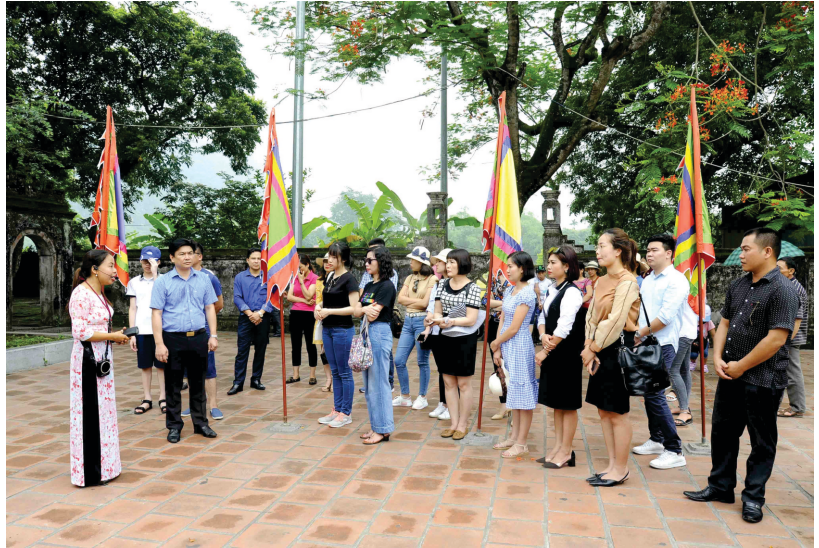
Đoàn khảo sát tại Cố đô Hoa Lư - Ảnh: Việt Hà

Từ ngày 17 đến 18/5/2019, đoàn Famtrip đã nghiên cứu, khảo sát các khu, điểm du lịch: Cố đô Hoa Lư - Tuyệt Tịnh Cốc - Tham dự khai mạc Tuần Du lịch - tham quan cánh đồng lúa vàng Tam Cốc và thưởng thức các chương trình văn nghệ tại một số điểm trên dòng sông