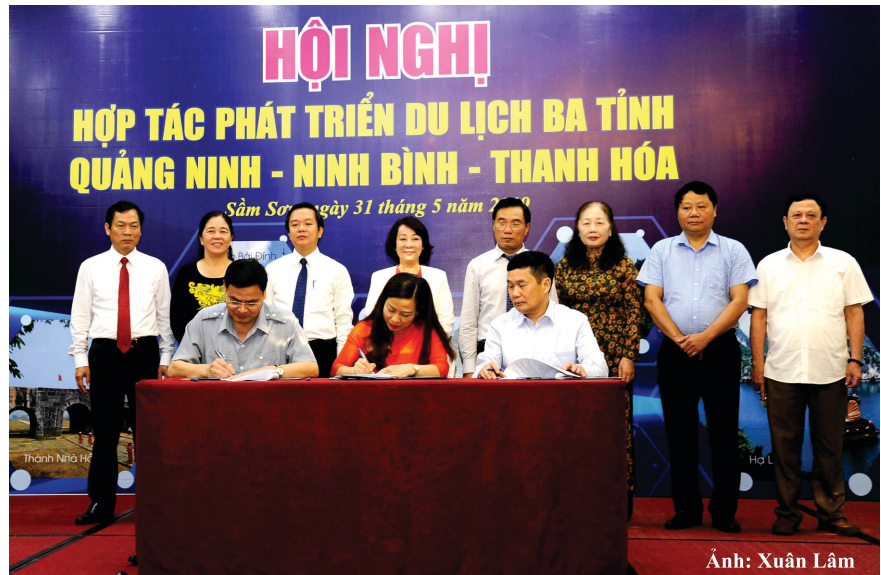
Lãnh đạo Sở ba tỉnh Quảng Ninh - Ninh Bình - Thanh Hóa ký kết Chương trình hợp tác phát triển du lịch

Công tác quản lý nhà nước về du lịch: Cùng trao đổi và thống nhất kiến nghị Chính phủ, Ban chỉ đạo Nhà nước về Du lịch, Bộ Văn hóa, Thể thao và Du lịch, Tổng cục Du lịch... tháo gỡ những khó khăn, vướng mắc trong phát triển du lịch; xây dựng cơ chế chính sách, tạo điều kiện thuận lợi, khuyến khích phát triển du lịch; tham mưu định hướng hợp tác kết nối phát triển du lịch giữa ba tỉnh trong