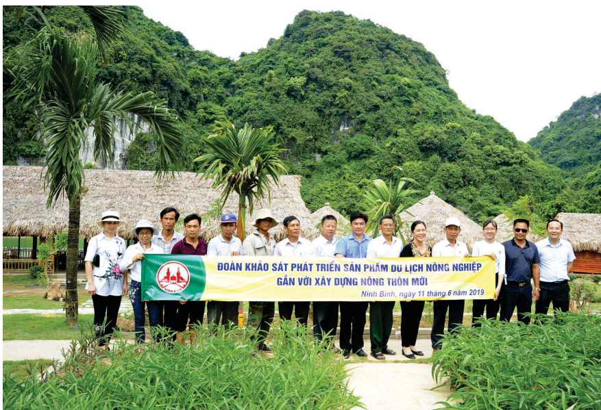
Trung tâm TTXTDL phối hợp với HHDL và Tổ dân phố phường Đông Sơn đi khảo sát thực tế tại Đông Sơn, Tp.Tam Điệp

viên... Và đặc biệt là cần có cơ chế tạo điều kiện tối đa, cần gắn kết chặt chẽ giữa phát triển du lịch nông nghiệp trong xây dựng nông thôn mới, để các doanh nghiệp và người dân có điều kiện phát triển các mô hình đem lại hiệu quả cao thu hút được nhiều khách du lịch đến và trải nghiệm dịch vụ./.