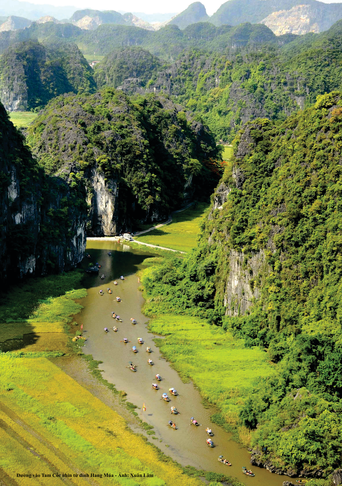
Đường vào Tam Cốc nhìn từ đỉnh Hang Múa