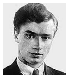
Олег Ольжич (нар. 1907, Житомир – † 1944, концтабір Заксенгаузен):

бували міста. Міжусобна боротьба підірвала сили князівств, і вони не змогли протистояти половецькій експансії. Половці перекрили найважливіші торгові шляхи Русі через Каспій. В умовах занепаду Візантії (основного торгового партнера Київської Русі) і переміщення головних торгових шляхів на Середземномор'я, Русь опинилася «на узбіччі» світової торгівлі.