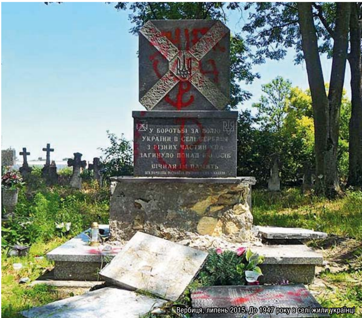
Вербіца, липень 2015. До 1947 року в селі жили українці

Юрій Банахевич (Укрінформ), Євген Приходько (Простір), Андрій Фецин («ХГ»)