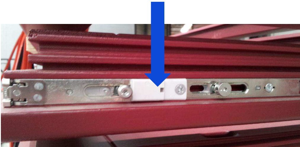
Onderkant van het raam