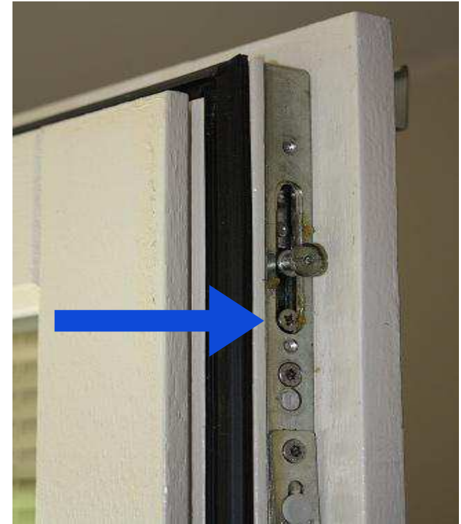
Zijkant van het raam

Als greep blokkeerd bij het in de “val”stand zetten controleer dan eerst of dit raam is uitgevoerd met een valblokkering. (zia afbeelding) Raam kan dan alleen maar draaien. (valstand is uitgeschakeld) Doordraaien van de greep zal tot schade aan het beslag leiden.