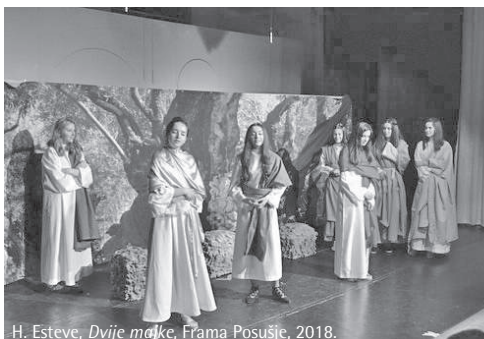
H. Esteve, Dvije majke , Frama Posušje, 2018.