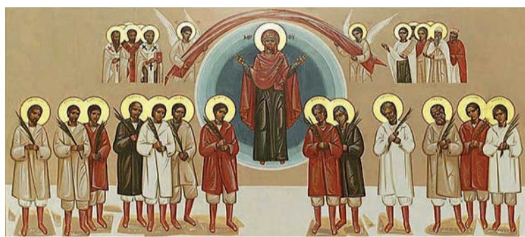
Пратулинські мученики. Монастирська церква ЧСВВ у Перемишлі

Очевидно, справа лише в часі, в якому ми, як люди, живемо і рухаємося, і залізни лещата якого постійно відчуваємо як одне з найбільших обмежень, але якого потребуємо і на те, щоби осмислити і дослідити нашу минувшину. Там віднайдемо ще десятки і сотні нових світлих особистостей, які посвідчили Христа аж до мученицької смерті.