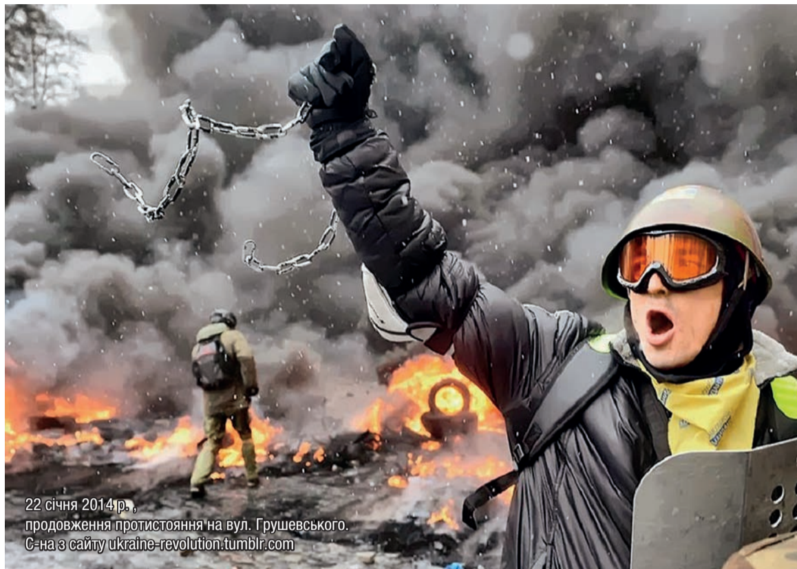
22 січня 2014 р., продовження протистояння на вул. Грушевського.

У нас же інша філософія. І ми в цьому не винні – така наша історія. У нас вкрай високий рівень технологій самовиживання, тобто реакцій на несприятливі зовнішні умови. Тут ми незрівнянні. Свого часу я написав статтю, яка була з цікавістю