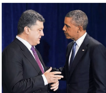
Варшава, 4 червня 2014 р., П. Порошенко та Б. Обама. Через три дні Порошенко стане офіційно президентом України