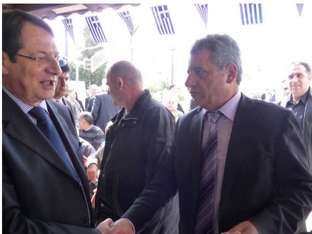
Νίκος Αναστασιάδης: Δεν έχει σημασία κ. Πιτκοκοπότη εάν είμαστε από διαφορετικά κόμματα, σημασία έχει ότι ευελπιστούμε σε μελλοντική συνεργασία των κομμάτων μας.