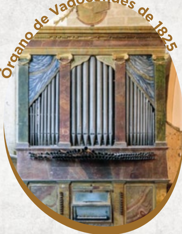
Órgano de Vadocondes de 1825

...el órgano de Vadocondes está a punto de cumplir 200 años. Fue construido en el año 1825 por el organero José Ruiz, quien también realizó el órgano de la capilla de Santiago de la catedral de Burgos.