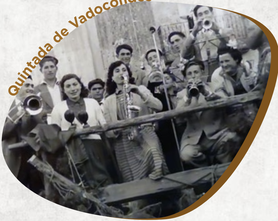
Quintada de Vadocondes

...antiguamente, en vendimias, todo el mundo tenía que salir a la vez del pueblo para evitar robos de uvas en las viñas. Se tocaba a las campanas para que la gente se despertase, pudiese preparar todo lo necesario y se fuese acercando a los arcos donde se situaban los guardas que impedían la salida hasta la hora convenida.