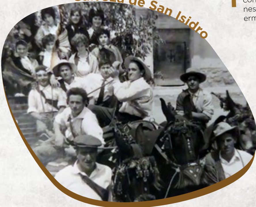
Carroza de San Isidro

...la polca es un baile típico castellano que se toca con dulzaina y tambor. En sus orígenes era un baile de las clases altas y destaca por su música alegre y la enorme técnica que posee. En las escuelas de folklore se enseña a tocar y bailar la "polca de Vadocondes" aunque aquí es una canción desconocida para la mayoría de nosotros.