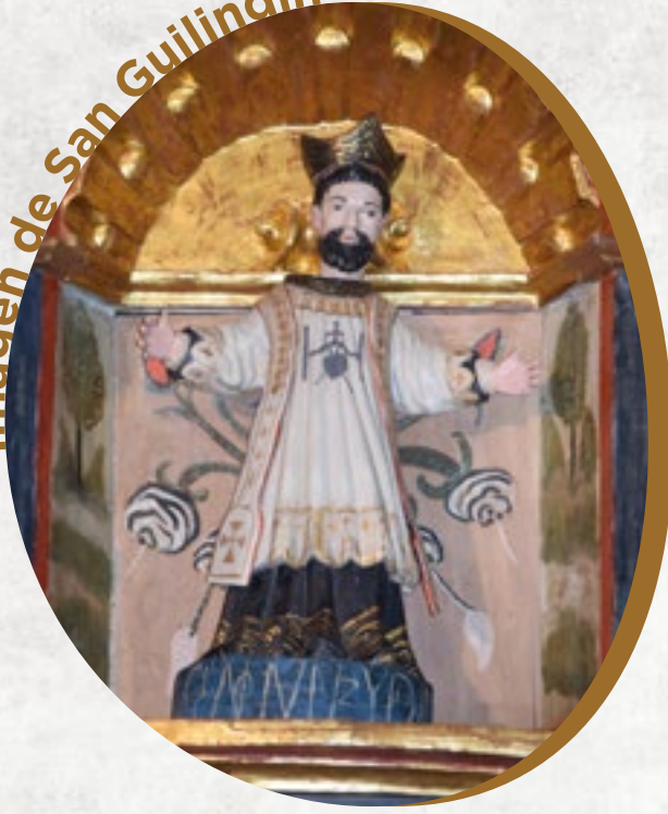
Imagen de San Guilindín

...en Vadocondes decimos que la pequeña imagen que hay en lo alto del altar de Santa Bárbara es San Guilindín y era tradición que, cuando se hacía matanza en casa, se bailase una jota en su honor mientras cocían las morcillas en la caldera para que éstas no se rompiesen.