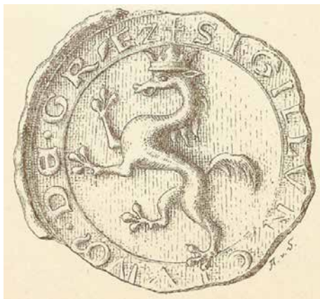
spodaj: risba srednjeveškega pečata mesta Gradec iz leta 1261

ponatisnjena v knjigi Slovenska znamenja 1 .