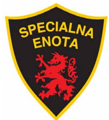
Z leve: današnji emblemi s heraldičnim panterjem – generalštab, poveljstvo sil in izvidniška četa 72. brigade Slovenske vojske ter znak Specialne enote slovenske policije