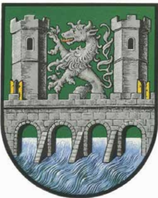
Tu zgoraj: današnji grb okrožja Altenmarkt bei Fürstenfeld; pod njim današnji grb mesta Bruck an der Mur;