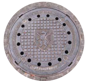
Z leve: grb Štajerske na Javorci – cerkev Sv. Duha; orožarna – muzej v Gradcu; grb s panterjem na kanalizaciji mesta Gradec