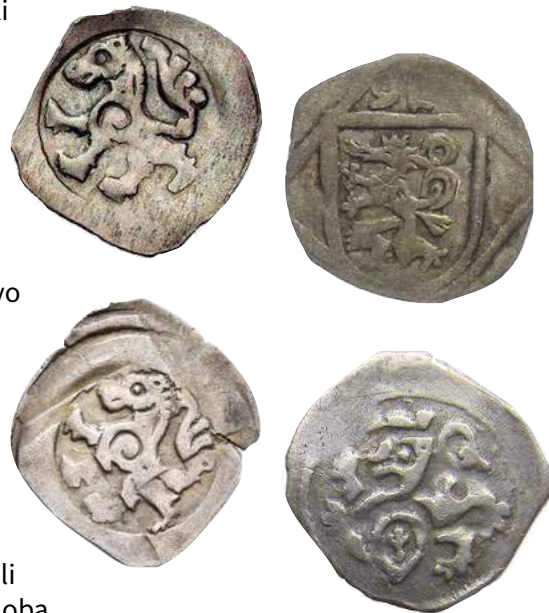
Zgoraj: srednjeveški pfenigi s panterjem

predstavlja tistega, ki je vstal, Odrešenika človeštva. Panter je namreč veliko bolj sporočilen simbol od leva ali orla. Mnogo je pečatov in srednjeveških kovancev s panterjevo podobo, še posebno iz časa med 12. in 13. stoletjem. Na tak način se je podoba heraldičnega panterja širila med ljudmi, saj so dnevno uporabljali srebrne pfenige. Podoba današnjega štajerskega grba, na katerem je srebrni (beli) heraldični panter na zelenem polju, sega nekje v sredino 13. stoletja in je v rabi še danes. Panterjev grb so uporabljali (v različnih barvah) tudi na Koroškem in na Bavarskem. Leta 1523 je heraldični panter dobil protiturški pomen, saj je bil z njim povezan rek: » Nemo Styrorum Pantheram tangere tentet / Ructat ab ore ignem posteriusque cacat « (Nihče naj si ne