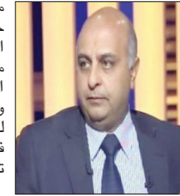
■ أمجد منير

كشف أمجد منير وكيل أول وزارة المالية والمستول عن ملف إحلال السيارات بالوزارة عن أن المستهدف تسليم نحو ٥٠٠ سيارة جديدة يوميا للمستفيدين من منظومة إحلال السيارات. وقال في تصريحات خاصة لـ «الأهرام» إن إجراءات الإحلال والتجديد تتم في مدة تتراوح بين أسبوعين وثلاثة أسابيع من تاريخ التقديم على الموقع حتى تسليم السيارة الجديدة للمستفيد وأن أولوية التسليم وفقا لتاريخ التقديم على الموقع واستيفاء الشروط. وقال أن هناك ٣١ بنكا و٩ شركات و٢ شركات تأمين تشارك في المنظومة وأن هناك تطوير في الموقع الإلكتروني لتيسير أكثر على المتقدمين. وأضاف أن المبادرة تستهدف رفع مستويات المعيشة وتقديم أفضل الخدمات للمواطنين وكذلك تنشيط الصناعة المحلية من خلال الاعتماد