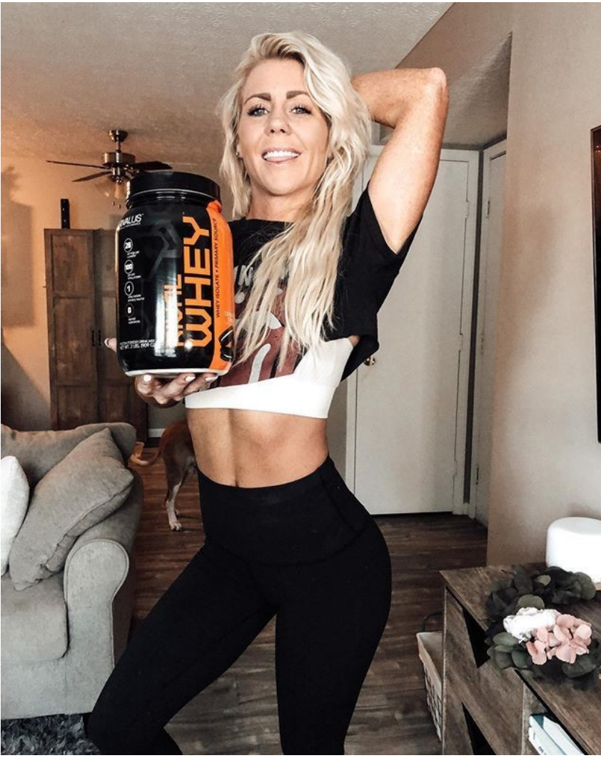
Just another Leg day feeling good and Rocking my @dimensional_athletica suit. ☐ #wellisme #dmvirongym #blackgirlmagic #wellness #wellnessposing #sheready #fitness #workout #legday #dmv #dimensionalathletica #athlete #ariharts