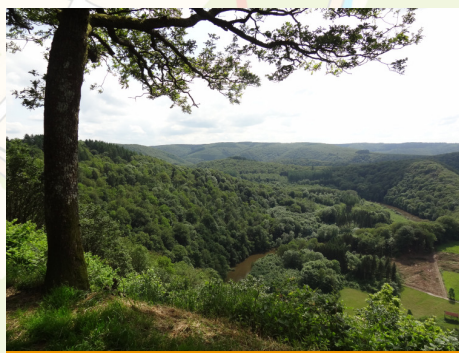
uitzicht 'Le Jambon de la Semois'

De Semoisvallei van Bouillon tot bij de Franse grens is een landschappelijke en toeristische topper met uitstekende wandelinfrastructuur. In de vallei van de koningin der Belgische rivieren is het gezellig vertoeven in verschillende dorpjes zoals Alle, Vresse, Membre, Bohan. In de eerste helft van de 20ste eeuw bracht de tabaksteelt, die zich uitstekend leende tot verbouwing op de schrale gronden, welvaart in de vallei. De veelvuldige nevels in de vallei gaven de tabak bij het drogen in open lucht een onvergelijkbaar aroma. De tabak van de Semois, dikwijls ter plaatse versneden en verpakt, werd over de hele wereld geëxporteerd. Iedereen 'deed in tabak' en smokkelaars van de rookwaar waren in deze grensstreek zeer actief. Tegenwoordig heeft de tabak nog slechts een symbolisch bestaan, geduldig verdedigd door een laatste groep planters en fabrikanten. Getuigen van de voorbije welvarende periode zijn de talrijke droogschuren met hun roestbruine daken, die in september hun magische geur verspreidden.