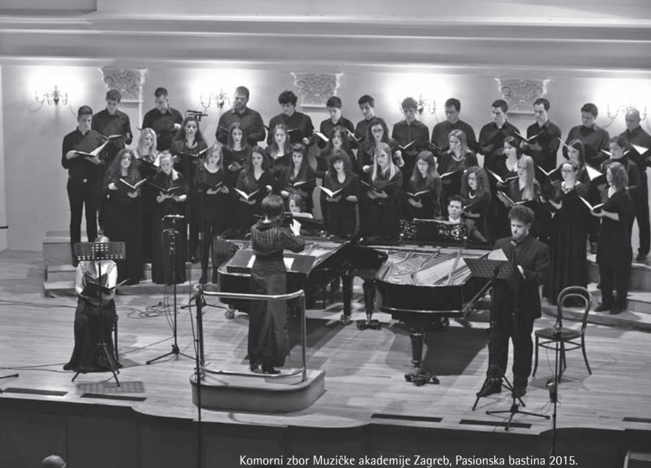
Komorni zbor Muzičke akademije Zagreb, Pasionska bastina 2015.