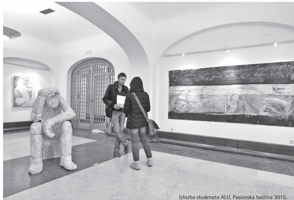
Izložba studenata ALU, Pasionska baština 2015.