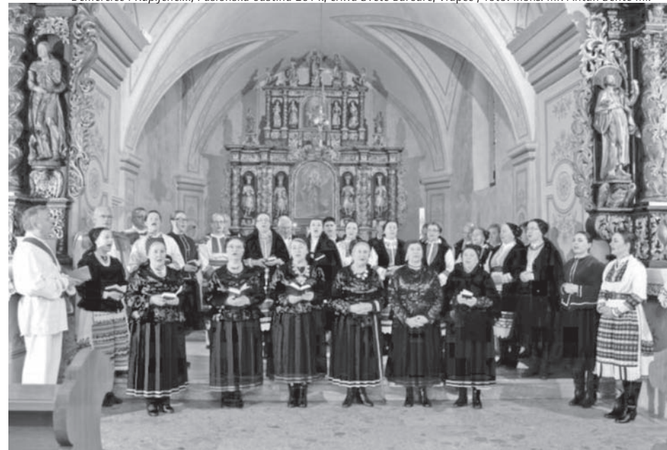
Demerčice i Kupljenci..., Pasionska baština 2014., crkva Svete Barbare, Vrapče

Od travnja 1998. stalni je suradnik nekadašnje Redakcije narodne glazbe Glazbenoga programa Hrvatskoga radija, a danas i novinar, autor, voditelj i urednik radijskih emisija u Odjelu glazbenih sadržaja HRT-a. Etno-poeziju na zavičajnom kajkavskom (zagorsko-prigorskom) narječju piše od godine 2005.