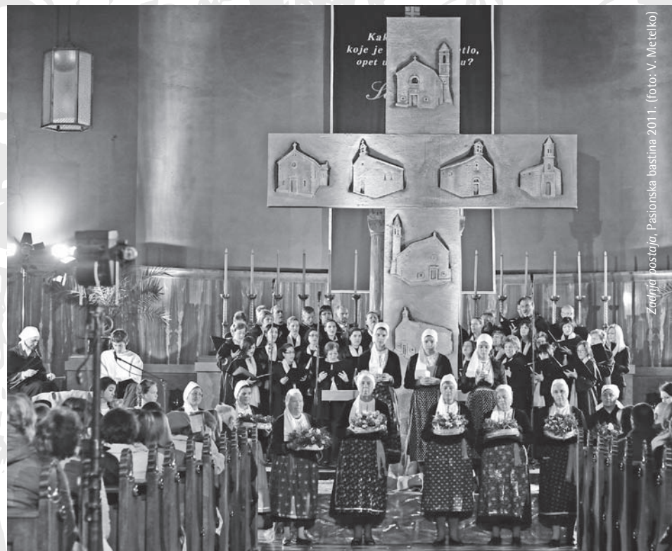
Zadnja postaja, Pasiomska bastina 2011.