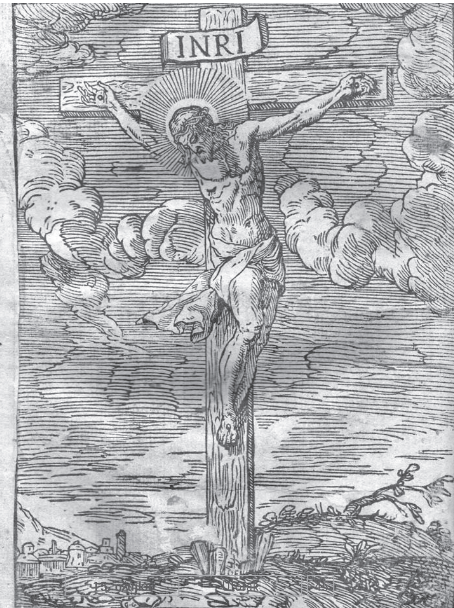
Motiv iz knjige: Missale Romanum savorico idiomate. Romae, TypisImperialis SacCongr. de Propaq. Fide 1631.