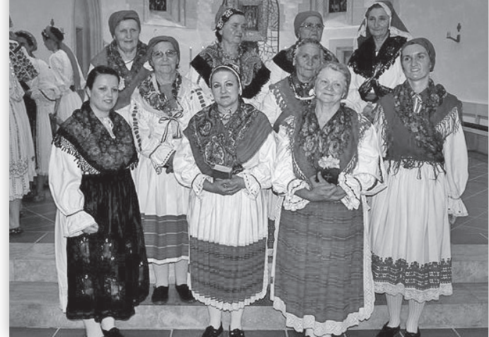
ŽPS, Matke, Virovitica