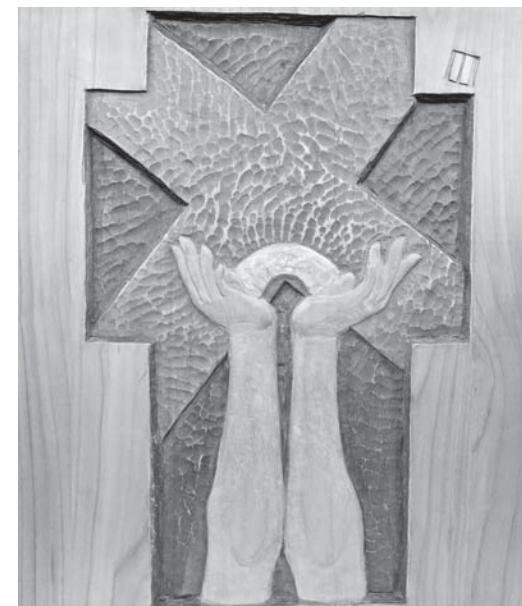
M. Glavnik, 'Isus prima na se križ'