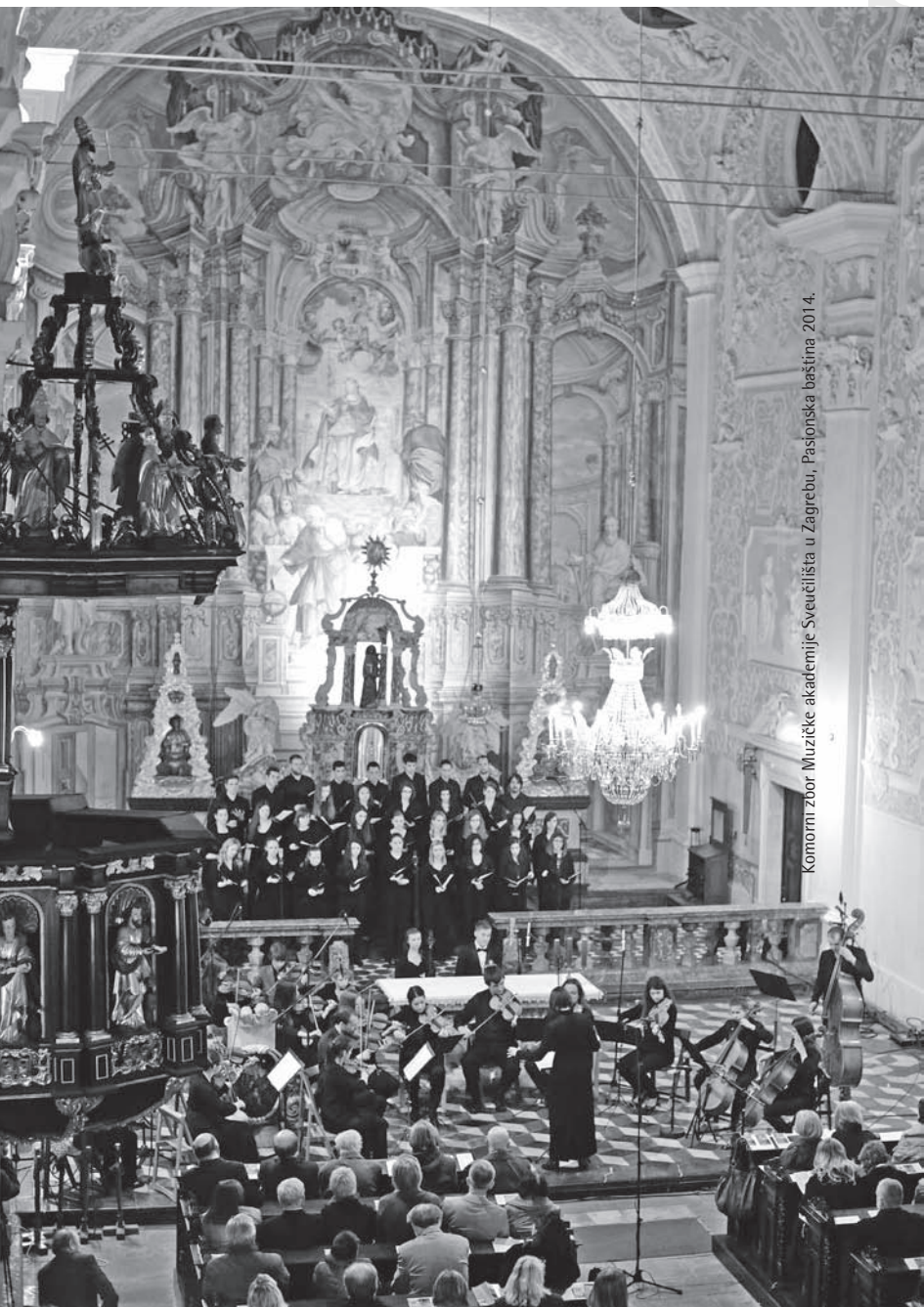
Komorni zbor Muzičke akademije Sveučilišta u Zagrebu, Pasionska baština 2014.