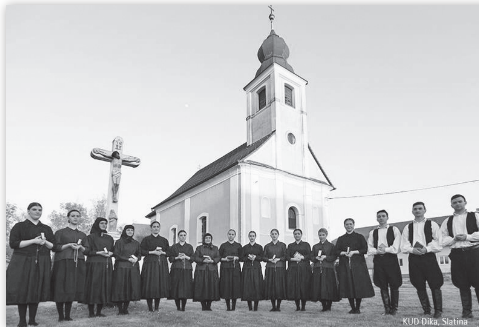
KUD Dika, Slatina

U proteklih nekoliko godina Dika je, pod vodstvom različitih voditelja, imala brojne vrlo zapažene nastupe u Hrvatskoj, Bosni i Hercegovini, Mađarskoj, Sloveniji, Vojvodini (Subotica – Dužijanica 2014.), Makedoniji (Folklorni festival Ohrid 2013.) i Poljskoj (Festival južnoslavenskih kultura – Boleslawiec 2014.).