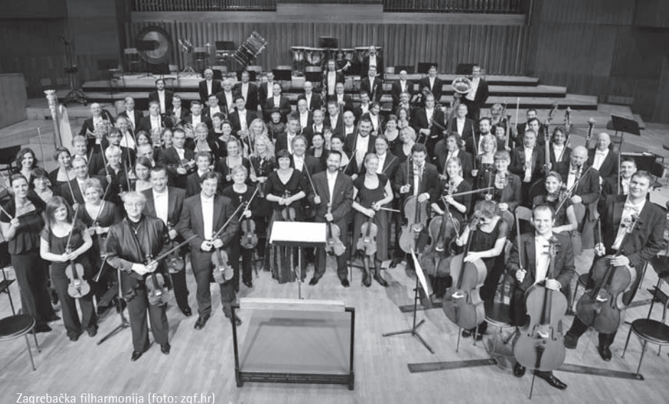
Zagrebačka filharmonija