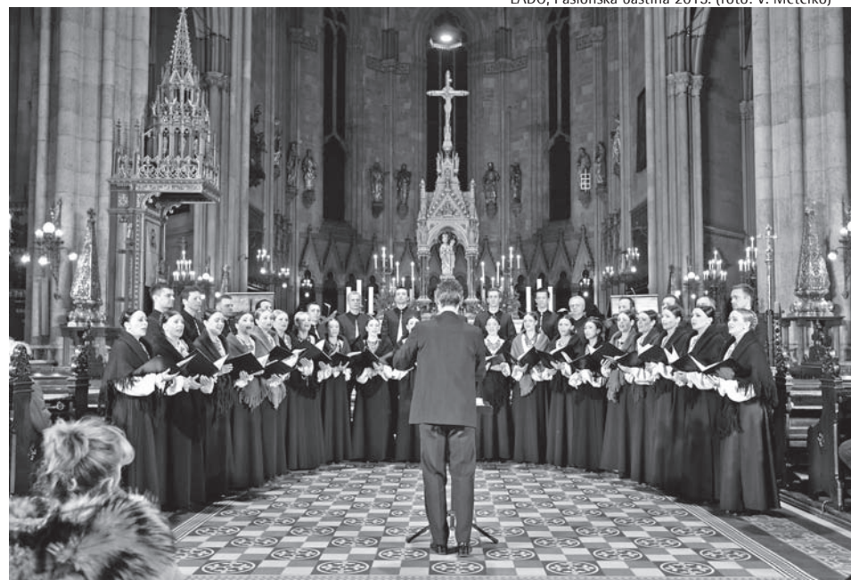
LADO, Pasionska baština 2015.