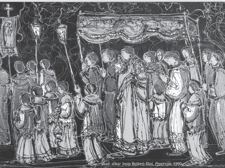
akad. slikar Josip Botteri-Dini, Procesija , 1990.

Na brojnim izložbama, samostalnim i grupnim, u okviru manifestacije Pasionske baštine izlagao je veliki broj istaknutih hrvatskih umjetnika, s djelima koja su obilježila dosege naše moderne i suvremene sakralne umjetnosti na temu Pasije. Obljetnica je prilika za sabiranje i prosudbu najzanimljivijeg i najkarakterističnijeg prikazanog na izložbama pozvanih umjetnika, i onih koji su izlagali na smotrama žiriranih skupnih izložbi. Spomenuta izložba kao svojevrsna retrospektiva uključuje nagrađene kipare i slikare na natječajnim izložbama pasionskih motiva, te autore s izložbi do troje umjetnika. Time je dobiven reprezentativan izbor otvoren različitim vidovima likovnih izričaja, umjetnika bližih li-