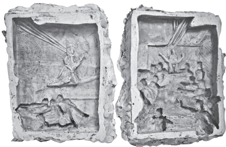
Izložba studenata ALU, Pasionska baština 2015.