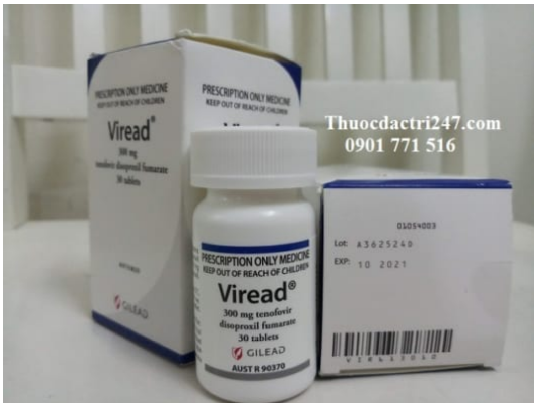
Thuốc viread 300mg tenofovir ngăn ngừa virus suy giảm miễn dịch – Thuốc đặc trị 247 (2)