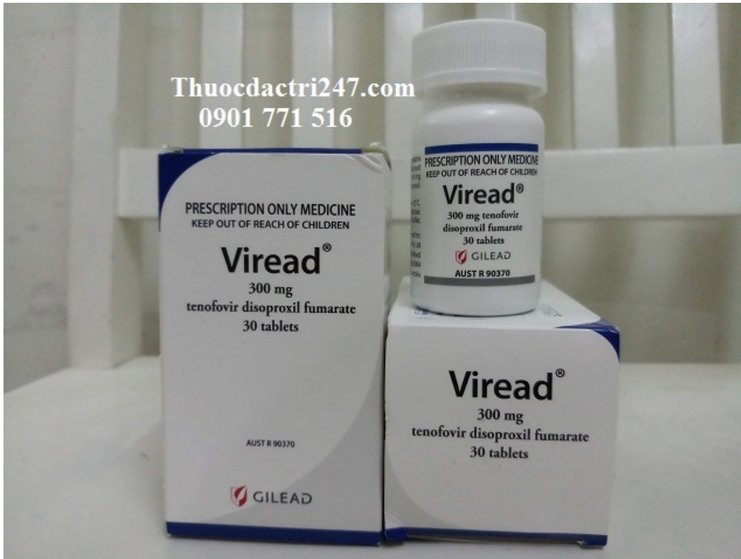
Thuốc viread 300mg tenofovir ngăn ngừa virus - Thuốc đặc trị 247

Thuốc viread 300mg tenofovir ngăn ngừa virus suy giảm miễn dịch ở người HIV hoặc viêm gan B hiệu quả giá bao nhiêu? Vui lòng liên hệ Thuốc Đặc Trị 247 ☎ 0901771516 chúng tôi tư vấn điều trị các căn bệnh ung thư, với nhiều năm kinh nghiệm trong lĩnh vực thuốc đặc trị, sẽ giúp mọi người hiểu nhiều hơn về những loại thuốc này.