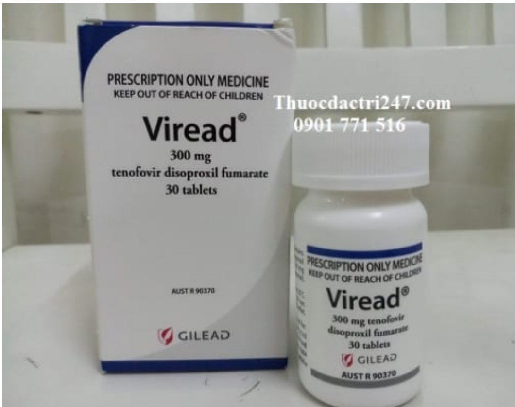
Thuốc viread 300mg tenofovir ngăn ngừa virus suy giảm miễn dịch – Thuốc đặc trị 247 (1)