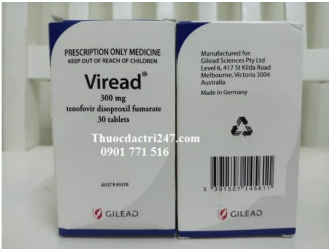
Thuốc viread 300mg tenofovir ngăn ngừa virus suy giảm miễn dịch – Thuốc đặc trị 247 (3)