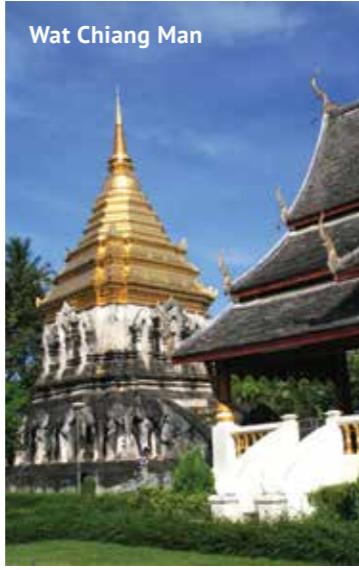
Wat Chiang Man

Antik Lanna Krallığı'nın eski başkenti Chiang Mai görkemli geçmişinin izlerini zengin bir kültür başkentine yakışır şekilde taşıyor. 300'den fazla tapınağa ev sahipliği yapan şehirden etkilenmemek mümkün değil Kuzey Tayland'ın en büyük şehri olan Chiang Mai'da hem geçmişin izleri etkileyici bir şekilde görülüyor hem de modern bir dünya şehrine temas edilebiliyor. Etrafı dağlarla çevrili yemyeşil bir ova üzerine kurulu Chiang Mai büyüleyici tapınakları, fil sırtında çıkılan safarileri, bölgenin el değmemiş doğasında yapılan yürüşlerle Tayland