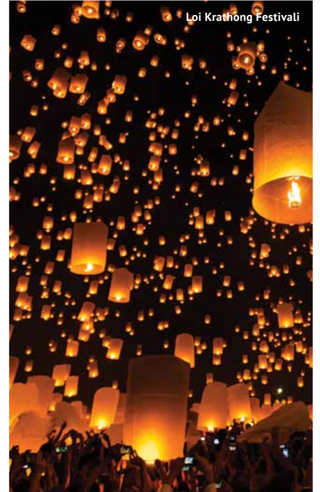
Loi Krathong Festivali