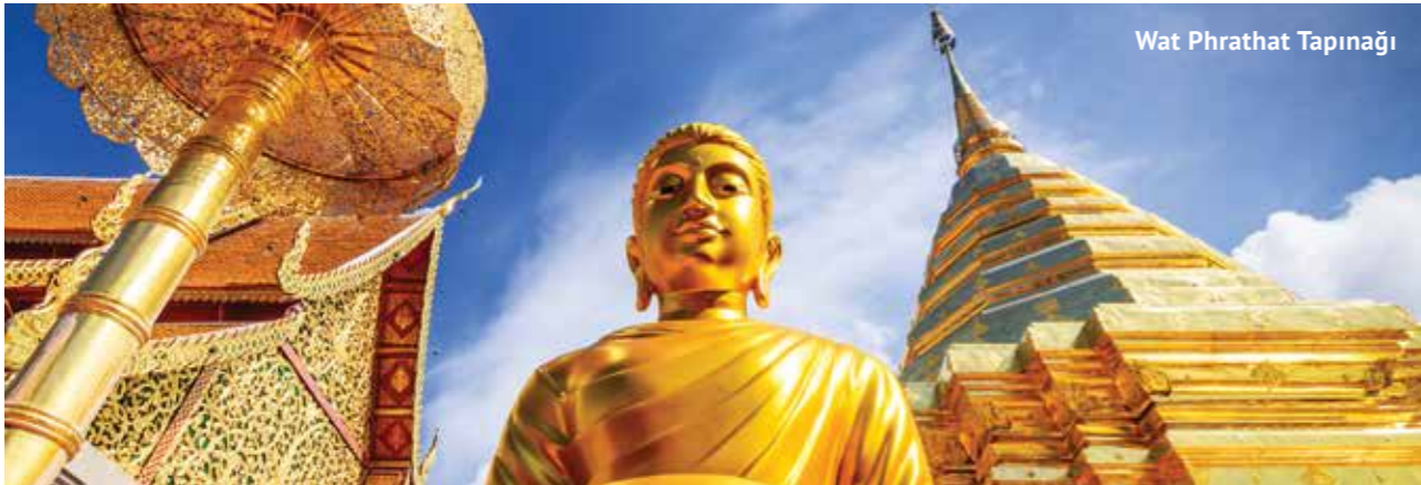
Wat Phrathat Tapınağı

kültürünü en güzel şekilde yansıtıyor. Doi Suthep Dağı'nın tepesinde bulunan Wat Phrathat Tapınağı , efsanevi görüntüsü ve atmosferiyle görenleri büyülüyor. Şehri kuşbakışı görme keyfi de sunan tapınak kompleksine, Naga adı verilen efsanevi yılanımsı yaratıklarla süslenmiş 300 basamaklı bir merdivenden çıkılıyor. Chiang Mai 'daki en eski tapınak olan Wat Chiang Man ise 13. yüzyılda inşa edilmiş. Tayland kültüründe son derece önemli yeri olan iki adet Buda heykeline ev sahipliği yapması sebebiyle ziyaretçi akınına uğruyor.