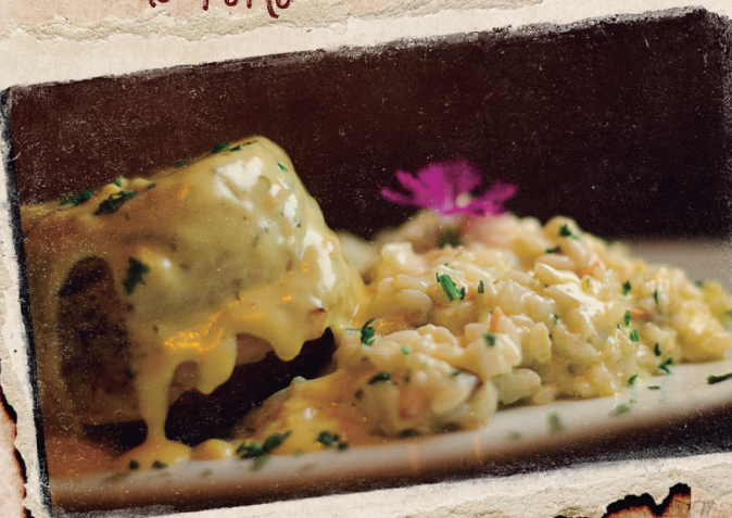
Filé do Corsário