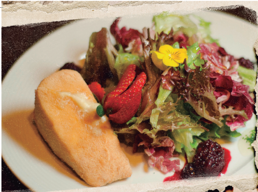
Salada do Navio