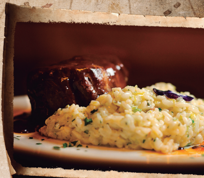
Filé ao Vinho do Porto