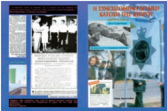
«Η ΣΥΝΕΧΙΖΟΜΕΝΗ ΑΓΓΛΙΚΗ ΚΑΤΟΧΗ ΤΗΣ ΚΥΠΡΟΥ»