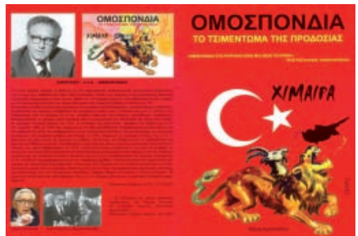
«ΟΜΟΣΠΟΝΔΙΑ. ΤΟ ΤΣΙΜΕΝΤΩΜΑ ΤΗΣ ΠΡΟΔΟΣΙΑΣ»