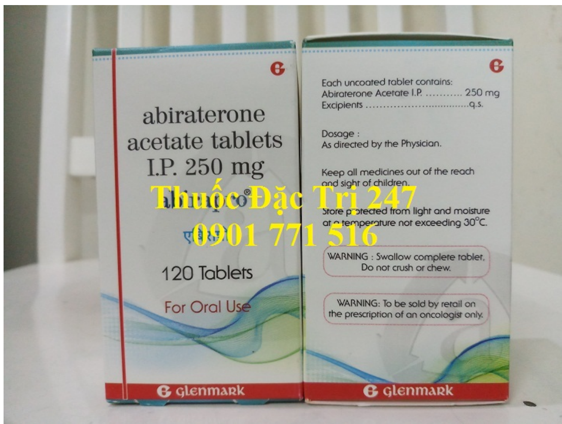
Thuốc abirapro 250mg abiraterone điều trị ung thư tuyến tiền liệt – Thuốc đặc trị 247 (1)

Giá thuốc Abirapro : Bình Luận bên dưới để biết giá hoặc liên hệ với chúng tôi qua Fanpage Thuốc Đặc Trị 247