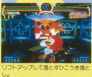
リフトアップして落とすひこうき落とし。