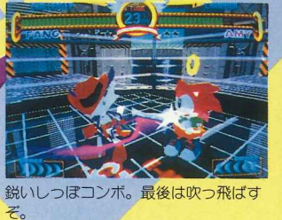
鋭いしっぽコンボ。最後は吹っ飛ばすぞ。

ただのPがコルク鉄砲を撃つ飛び道具という、かなり変わったキャラ。おまけにラビッドスナイプという飛び道具連射技や、Pのボンの本官さんをほーふつとさせる技も持っている。非常に面白い。近距離では主にしっぽを使った攻撃が多く、投げ技もしっぽを使った技だ。