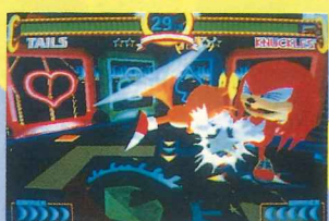
突っ込むだけじゃテイルスじゃないよね。

ソニックと同じスピニングアタックも持っているが、さすがに本家には性能のみなわらない。やはりテイルスで特徴的なのは、しっぽを回転させての飛行。ホバリングしたり、方向転換もできる優れたものだ。ただつ子のように手足を振り回して攻撃するほかはパンチもいじり。