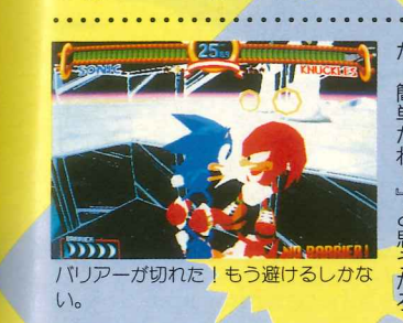
バリアが切れた!もう避けるしかない。

アメリカン・カートゥーン 今まで数回にわたって紹介してきたソニック・ザ・ファイターズだが、この号が出るころには街で直接目にした人も多かったろう。 かわいらしいキャラクターたちの愛らしい動き、おそろくそれが第一印象として残るものと思う。 そう、この柔らかく弾力感のある動きこそがこのゲームの特徴のひとつであることは間違いない。まさにアメリカン・カートゥーン(アメリカのアニメ)のような世界を体験させてくれるゲームなのだ。さてこの見開きページの両脇を飾るモモの連続写真、実は下欄のストーリーをさりげなく表している。こちらへも何げにアニメチックな演出だけを見る同社のVF2に