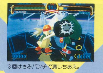
3回はさみパンチで潰しちあえ。