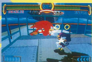
突進も直線的。ナックルグライダーだ。