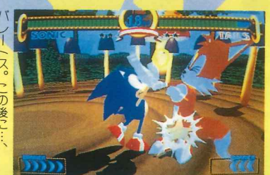
バレートス。この後に...