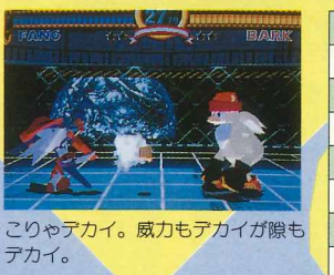
こりやアカイ。威力もアカイが隙もアカイ。