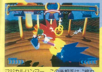
マジカルハンマー。この後相手は「縮む」。

ただのPがコルク鉄砲を撃つ飛び道具という、かなり変わったキャラ。おまけにラビッドスナイプという飛び道具連射技や、Pのボンの本官さんをほーふつとさせる技も持っている。非常に面白い。近距離では主にしっぽを使った攻撃が多く、投げ技もしっぽを使った技だ。