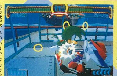
なるほど、きつつきアタックだ。