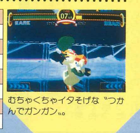
むちゃくちゃイタげな「つかんでガンガン」。