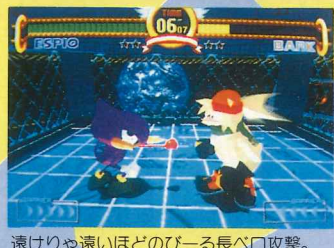
速けりや速いほどのびーる長べろ攻撃。