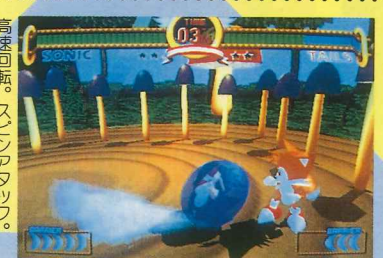
高速回転。スピニングアタック。