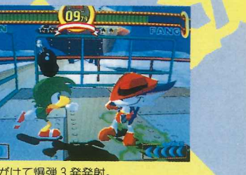
相手めがけて爆弾3発発射。