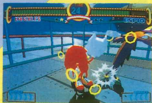
おらあ! アッパーのプロフェッショナルだぜ。