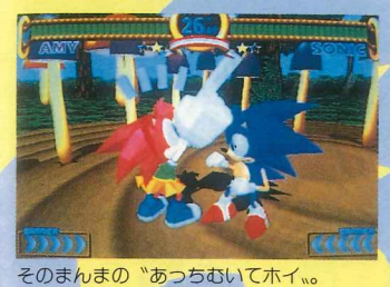
そのまんまの「あっちむいてホイ」。