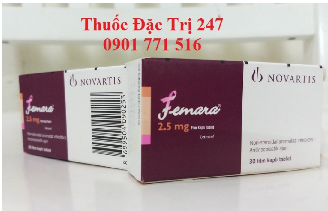
Thuốc Femara 2,5mg Letrozole điều trị ung thư vú – Thuoc đặc trị 247 (1)

Giá thuốc femara: Bình Luận bên dưới để biết giá hoặc liên hệ với chúng tôi qua Fanpage Thuốc Đặc Trị 247