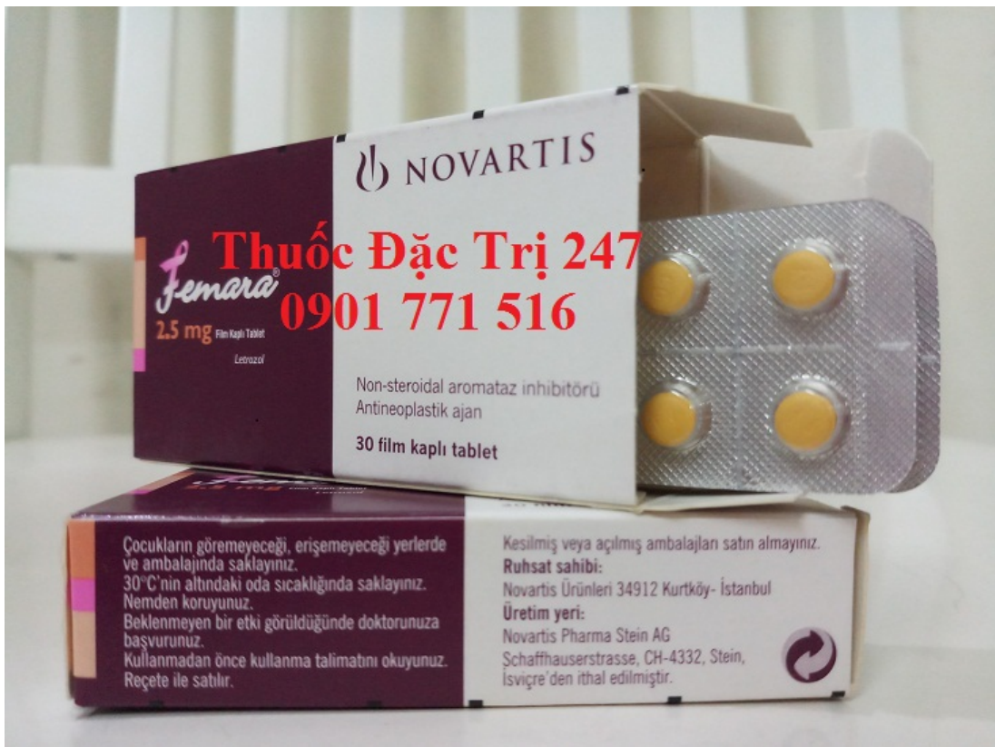
Thuốc Femara 2,5mg Letrozole điều trị ung thư vú - Thuốc đặc trị 247 (3)