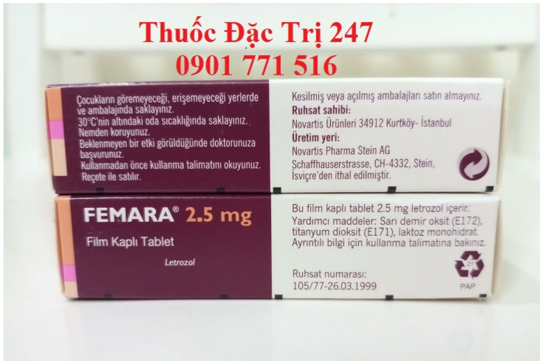
Thuốc Femara 2,5mg Letrozole điều trị ung thư vú – Thuoc đặc trị 247 (2)