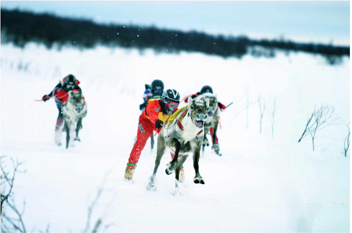
Reinkappkjøringen er avlyst som idrett som på dette bildet fra tidligere, men det blir ikke fritt for grytende dyr.