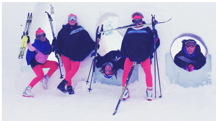
Disse deltagerne tok seieren i fjor.

I tillegg kårer dommerpanelet også beste lagkostyme og det laget som har det mest moro, så her skal det gjelde å både skape stemning og ta frem sitt konkurranseinstinkt.