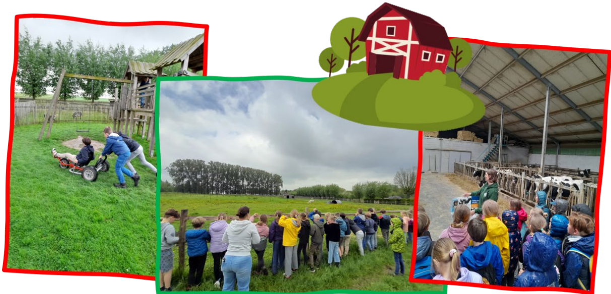
Meerdaagse uitstap naar de boerderij door derde en vierde leerjaar.