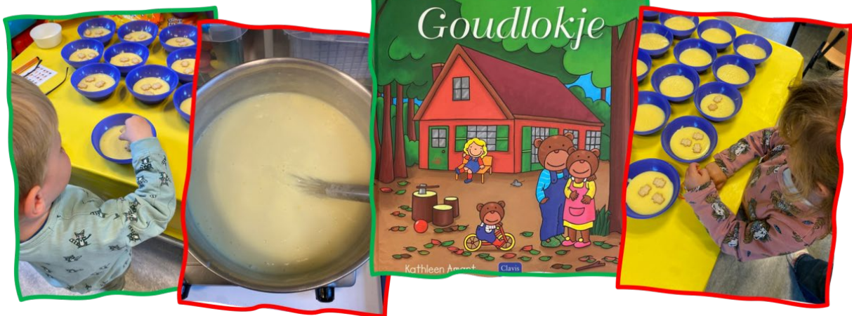
Werken rond Goudlokje en de 3 beren in P/K. We maakten lekker berenpap.