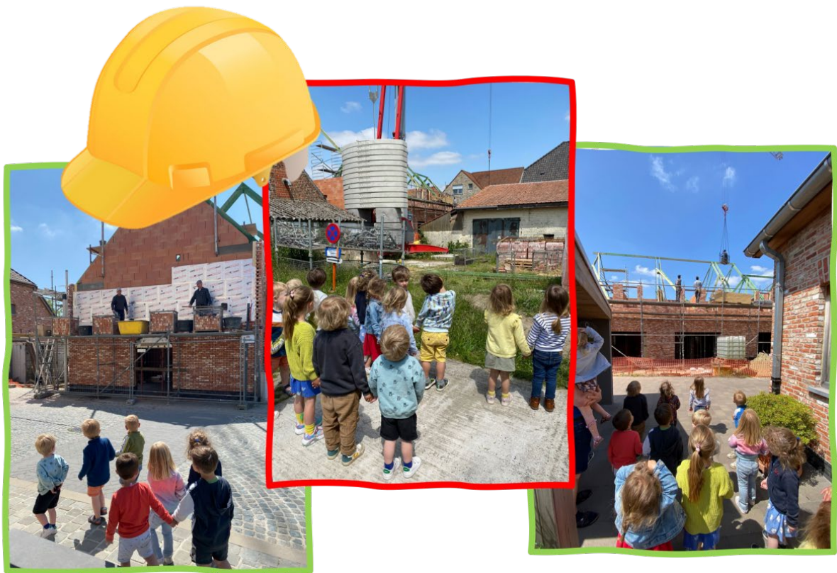
De kinderen van de peuter- en eerste kleuterklas brachten een bezoekje aan de bouwplaats.