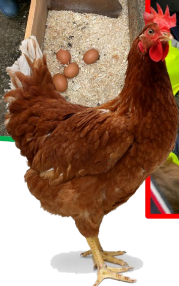
PK1 De Kerselaar ging op bezoek bij de kippen Anna en Elsa en er waren zelfs kuikentjes te bewonderen.