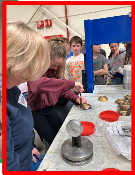
De leerlingen van het 5de en 6de leerjaar van Vrije Basisschool De Kerselaar in Gottom brachten een bedrijfsbezoek aan Solares. Ze waren allen erg geïnteresseerd. De toekomst is verzekerd.