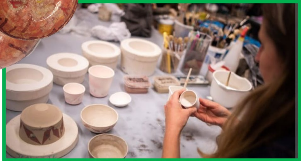
De kinderen van juf Greet volgden een workshop bij Antoine Delva. Ze experimenteerden en creëerden in Toine zijn eigen atelier in Gottem.