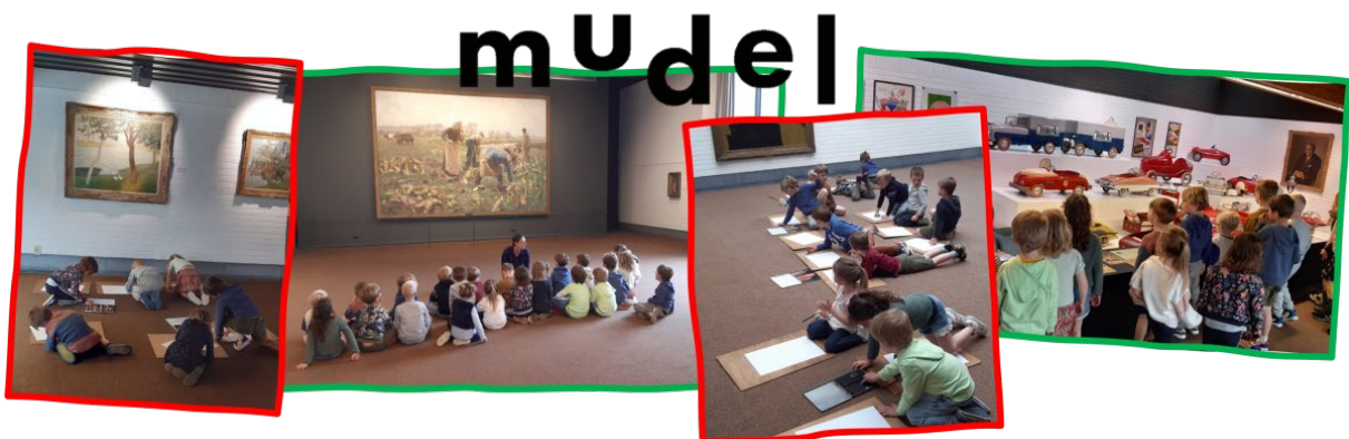
De 2de en 3de kleuterklas gingen op bezoek in museum Mudel in Deinze.