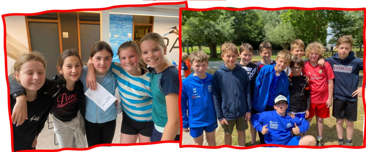
De tweede en derde graad kregen heel wat sporten voorgeschoteld op de Doe-Aan-Sportbeurs.