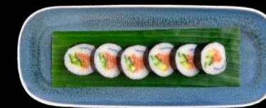
70. LAKS LAKS, AVOCADO & AGURK