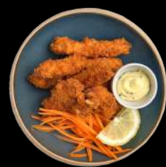
9. SWEET POTATO m. Trøffelmayo