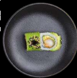
62. EBI PANKO tempurareje & avocado, toppet med avocado, unagi sauce & sesam