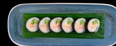
73. CALIFORNIA SURIMI, AVOCADO & AGURK