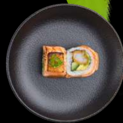
60. ZENSHI SPECIAL tempurareje, mango & agurk, toppet med grillet laks med unagi sauce, forårsløg.