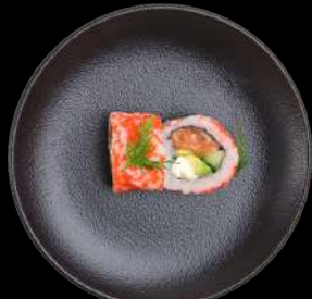
51. Alaska laks, cream cheese, avocado, agurk & masago