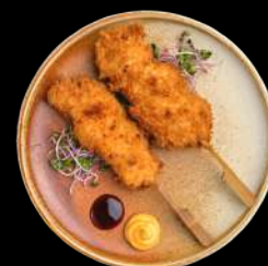
6. CHICKEN STICKS - 1 STK. m. wasabi mayo og teriyaki sauce