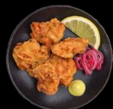
4. KARAAGE - 3 STK. m. wasabi mayo Sprøde, marinerede kyllingstykker.