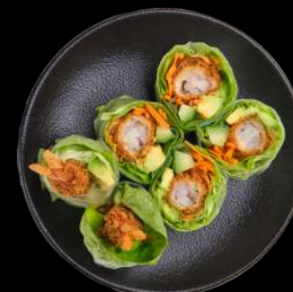
32. Crispy Rispapir Tempurारेजे, avocado, agurk & salat. toppet med lemon sauce