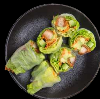
33. Kylling Rispapir Karaage kylling, avocado, agurk & salat toppet med teriyaki sauce