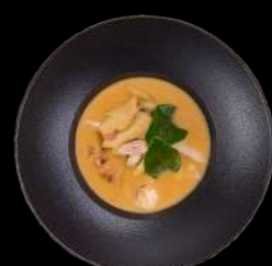
8. TOM KHA GAI SUPPE Kylling, champignon, tomat, kinesiske svampe, citrongræs, limeblade og koriander.