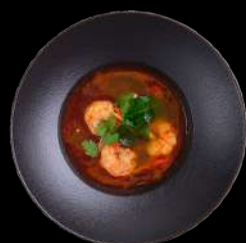
7. TOM YUM SUPPE. Rejer, champignon, tomat, kinesiske svampe, citrongræs, limeblade og koriander.