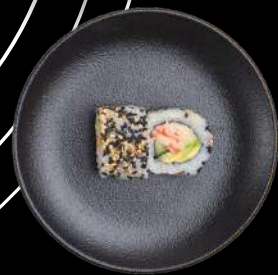
50. California surimi, agurk, avocado & sesam