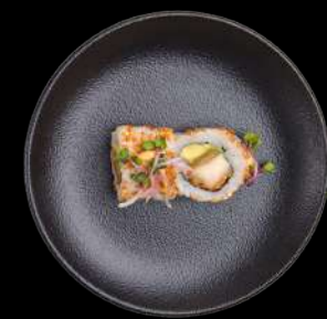
56. Chicken Nanban kylling, avocado, spicy mayo & koriander