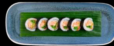
71. STEGT LAKS STEGT LAKS, AVOCADO, SUKKERÆRTER, MASAGO, SPICY SAUCE & UNAGI SAUCE