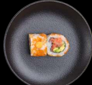
52. Spicy tuna tun, chili, avocado, agurk & masago