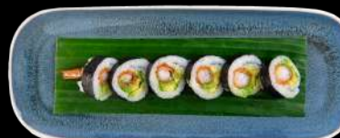
72. TEMPURA TEMPURAREJE, AVOCADO, FORÅRSLØG, SPICY MAYO & TERIYAKI