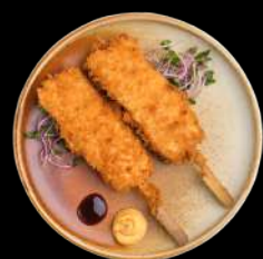
5. SALMON STICKS - 1 STK. m. wasabi mayo og teriyaki sauce