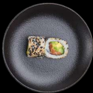
53. Salmon laks, agurk, avocado & sesam