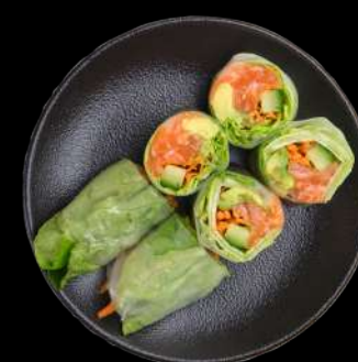
31. Laks Rispapir Laks, avocado, agurk & salat toppet med lemon sauce