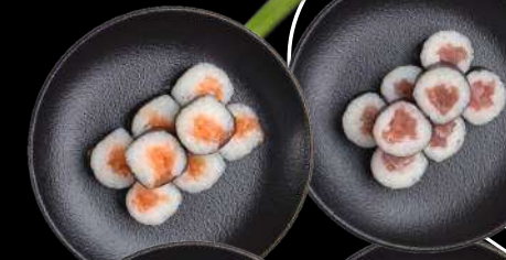
95. LAKS & AVOCADO