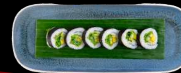
74. VEGGIE AVOCADO, SUKKERÆRTER, MANGO, AGURK & SALAT