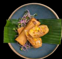
1. FORÅRSRULLER - 2 STK. m. sur-sød sauce Glasnudler, Hvidkål, gulerødder, kinesisk svampe.