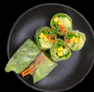
34. Veggie Rispapir Mango, avocado, agurk, sukkerærter & salat toppet med goma