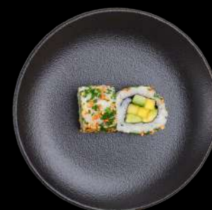
55. Veggie mango, avocado, agurk, toppet med sesam & purløg