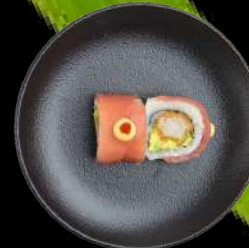
61. RED HOT tempurareje & avocado, toppet med tun, spicy sauce & barbeque