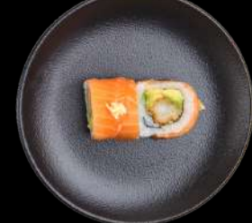
63. NEW YORK tempurareje & avocado toppet med laks & hvidløg