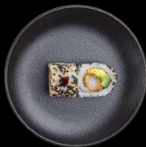
54. Crispy ebi tempurareje, avocado, agurk, sesam & toppet med teriyaki sauce