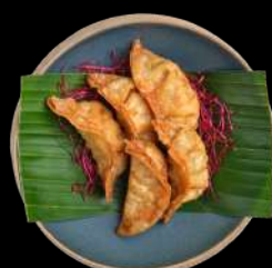
3. GYOZA - 2 STK. m. sur-sød sauce Japanske dumplings med kylling.