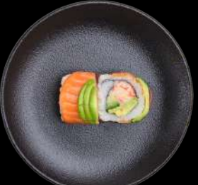
66. RAINBOW surimi, avocado & agurk toppet med tun, laks, flamberet laks, rejer & avocado