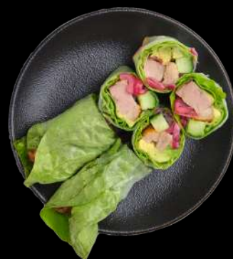
30. And Rispapir And, avocado, agurk & salat toppet med goma sauce