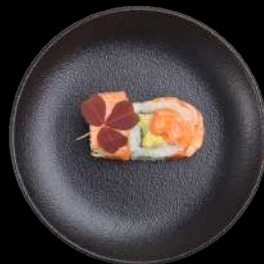
69. HOT SALMON spicy laks, avocado, agurk, toppet med flamberet laks & unagi sauce