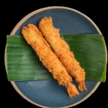
2. TEMPURA REJER - 2 STK. m. sur-sød sauce