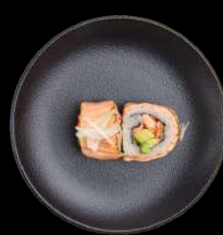
64. ZENSHI DELUXE skaldyrsmix, avocado, laks topping, gomadressing, toppet med perleløg og purløg.