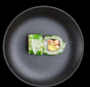
57. Sea keeper krebsehaler, spicy mayo, avocado & tobiko