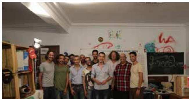
Des membres de Racines au local de l'association.