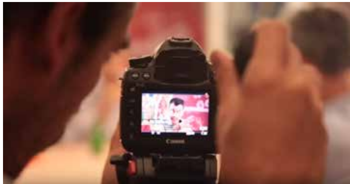
Extrait de l'émission « 1 diner 2 cons » diffusée sur YouTube le 24 août 2018. YouTube

Par Ghalia Kadiri q Publié aujourd'hui à 07h00, mis à jour à 07h00