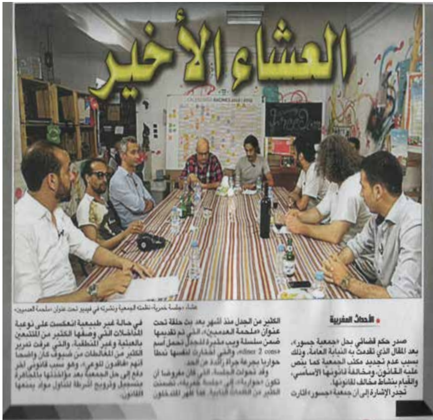
عشاء جمعة خيرية، منظمة الجمعية وشركو في فيديو تحت عنوان «لمحة العدميين».