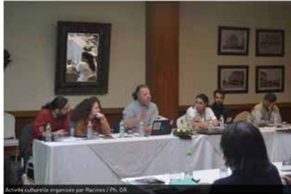
Activité culturelle organisée par Racines / PK, DR.