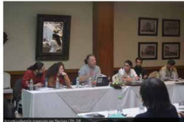
Activité culturelle organisée par Racines