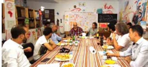
Durant le tournage d'1D2C dans les locaux de Racines le 5 août 2018.