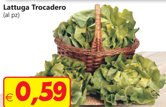
Lattuga Trocadero (al pz)