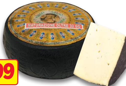
Asiago Cappato Nero DOP (l'etto)