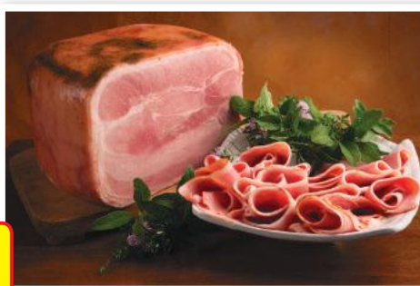
CAPPONI Prosciutto Cotto alle Erbe (l'etto)