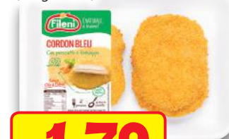
FILENI Cordon Bleu Classico x 2 g 250 (al kg € 7,16)