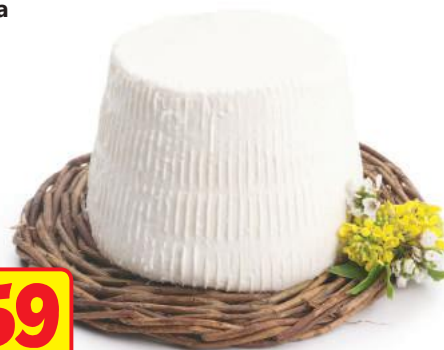
ZAPPALÀ Ricotta Fresca Misto Pecora (l'etto)