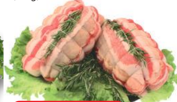
Rollè di Pollo (al kg)