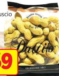
DATTILO Arachidi in Guscio Tostate g 250 (al kg € 6,36)