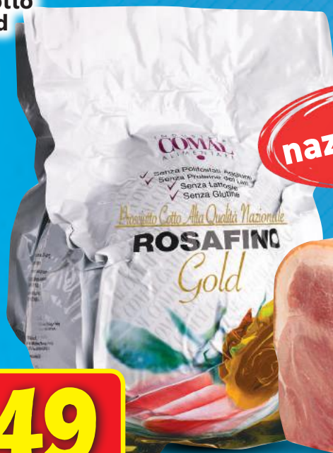
Prosciutto Cotto Rosafino Gold Nazionale Alta Qualità (l'etto)