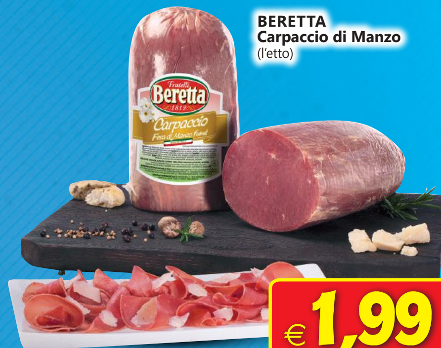
BERETTA Carpaccio di Manzo (l'etto)