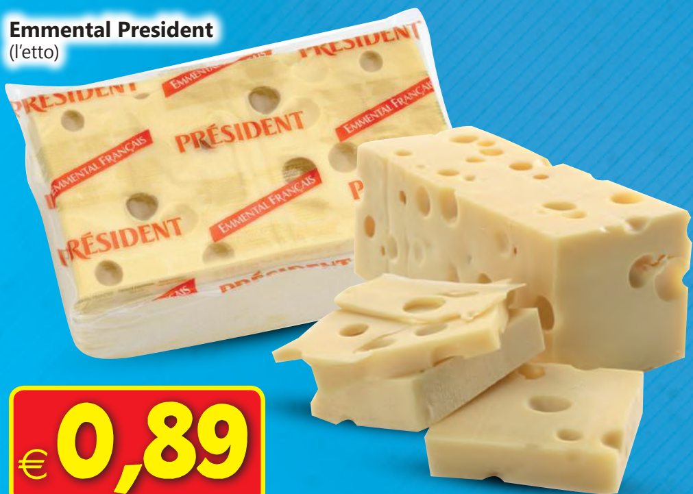
Emmental President (l'etto)