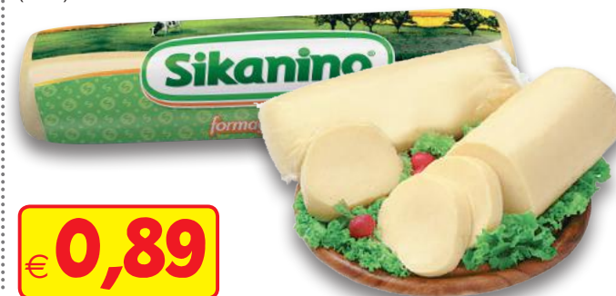
ZAPPALÀ Sikanino Affettato (l'etto)