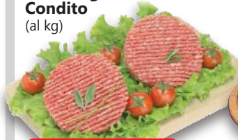
Hamburger di Pollo Condito (al kg)