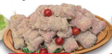
Involtni di Pollo (al kg)