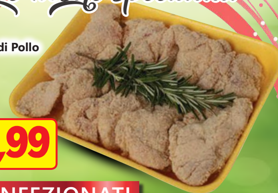
Alette di Pollo (al kg)