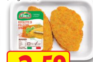
FILENI Cotoletta di Pollo x 4 g 440 (al kg € 5,89)