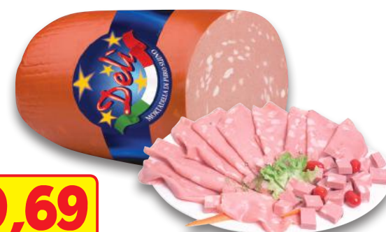
Mortadella Deli (l'etto)