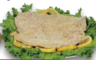
Cotolette di Pollo Panate (al kg)