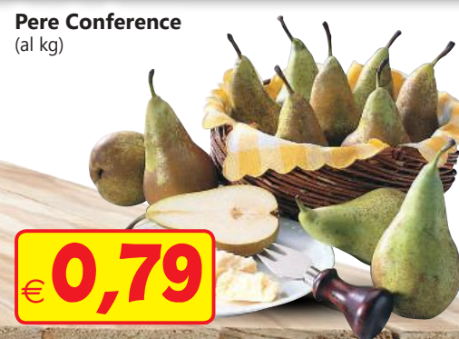
Pere Conference (al kg)