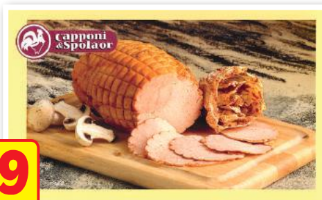
CAPPONI Petto di Tacchino al Forno (l'etto)