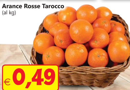
Arance Rosse Tarocco (al kg)