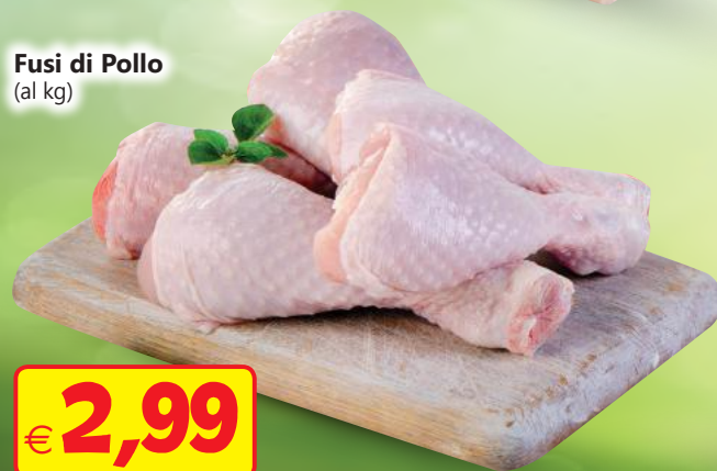
Fusi di Pollo (al kg)