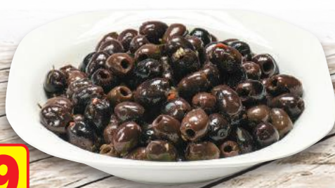
Olive Nere Condite (l'etto)