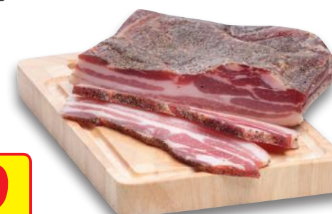
Pancetta Stesa Dolce e Piccante (l'etto)