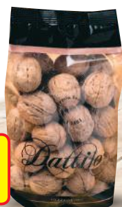
DATTILO Noci in Guscio g 500 (al kg € 7,98)