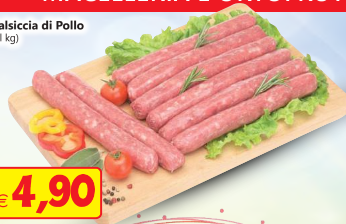
Salsiccia di Pollo (al kg)