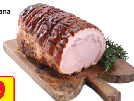
CAPPONI Porchetta Romana (l'etto)