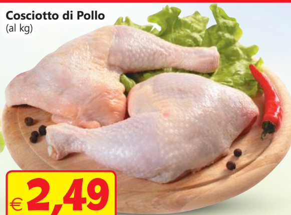
Cosciotto di Pollo (al kg)