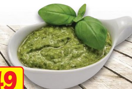
Pesto Fresco Genovese DOP (l'etto)