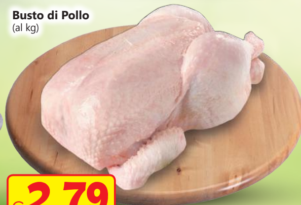
Busto di Pollo (al kg)