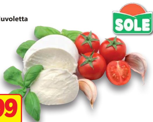
SOLE Mozzarella Nuvoletta (l'etto)