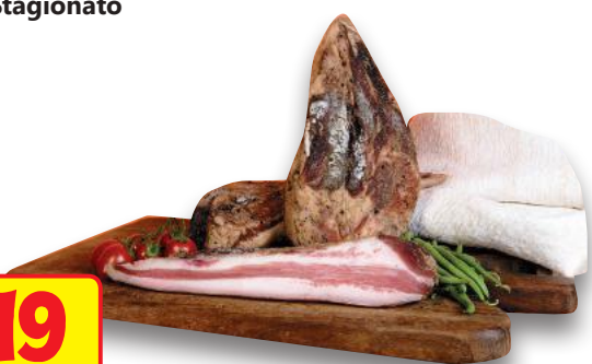
Guanciale Stagionato (l'etto)