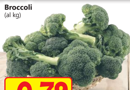
Broccoli (al kg)