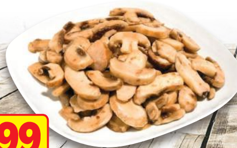
Funghi Tagliati Piccanti Sott'Olio (l'etto)