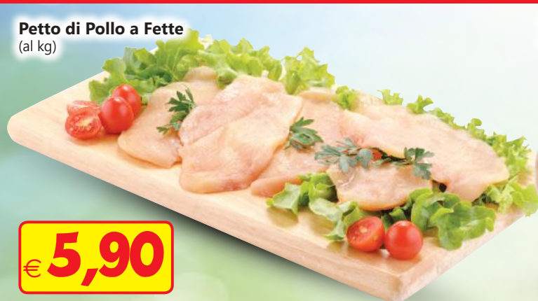
Petto di Pollo a Fette (al kg)