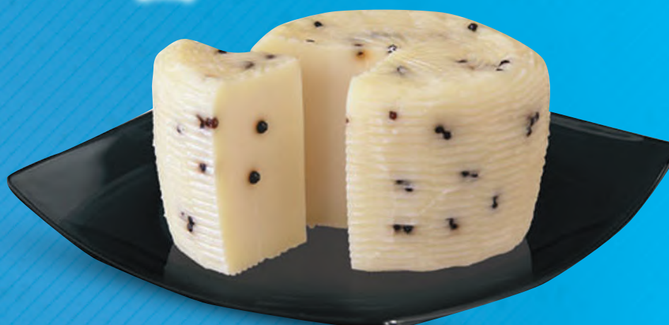
Formaggio Primo Sale Pepato (l'etto)