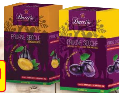
DATTILO Prugne Secche g 250 • Denocciate • con noccioli (al kg € 10,36)