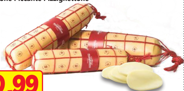
Provolone Piccante Pizzighettone (l'etto)