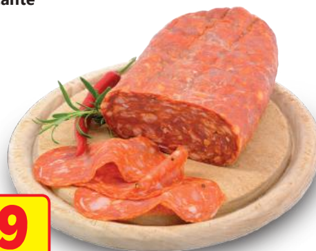
Spianata Piccante (l'etto)