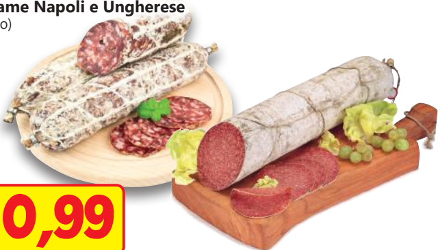
GRAN SALUME Salame Napoli e Ungherese (l'etto)