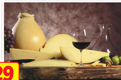
CAVALLI Provola Sfoglia Stagionata (l'etto)