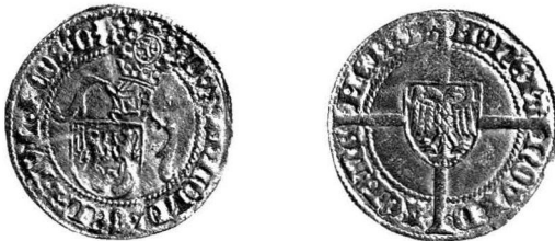
Gelre, Arnold 1423-1472, dubbele meeuw z.j. (zilver, 28 mm).

Tijdens de lange regering van Arnold (1423-1472) is een aantal muntsoorten in Arnhem gemunt. Een voorbeeld hiervan is de dubbele groot. Met zijn regering zou in 1465 een einde komen aan de vermelding van de naam van de muntplaats Arnhem op de hertogelijke munten.