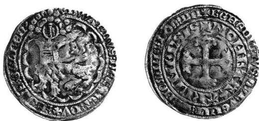
Gelre, Eduard 1361-1371, plak z.j. (zilver, 30 mm).

Bekend en veelvuldig voorkomend zijn de dubbele groten of plakken onder Eduard (1361-1371), die behalve in Arnhem tevens in klein aantal in Nijmegen en Venlo zijn geslagen.