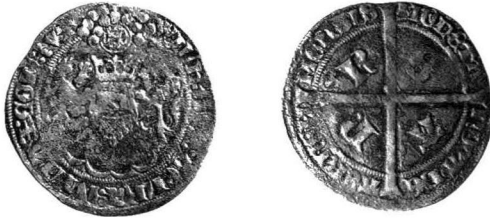
Gelre, Willem I van Gelre en Gulik 1393-1402, groot z.j. (zilver, 28 mm).

Ook tijdens de tweede periode (1393-1402), toen Willem zijn vader in het hertogdom Gulik was opgevolgd, zijn in Arnhem diverse muntsoorten en -typen geslagen. Als voorbeeld hiervan een groot.