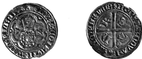
Gelre, Willem I 1377-1393, groot z.j. (zilver, 26 mm).

Van Willem I — vóór de opvolging in Gulik (1377-1393) — zijn groten bekend die te Arnhem zijn geslagen. Deze dragen op de keerzijde tussen de benen van het kruis de letters A-N-R-S (Arnhem, Nijmegen, Roermond en Zutphen — geschreven als Sutphen —).