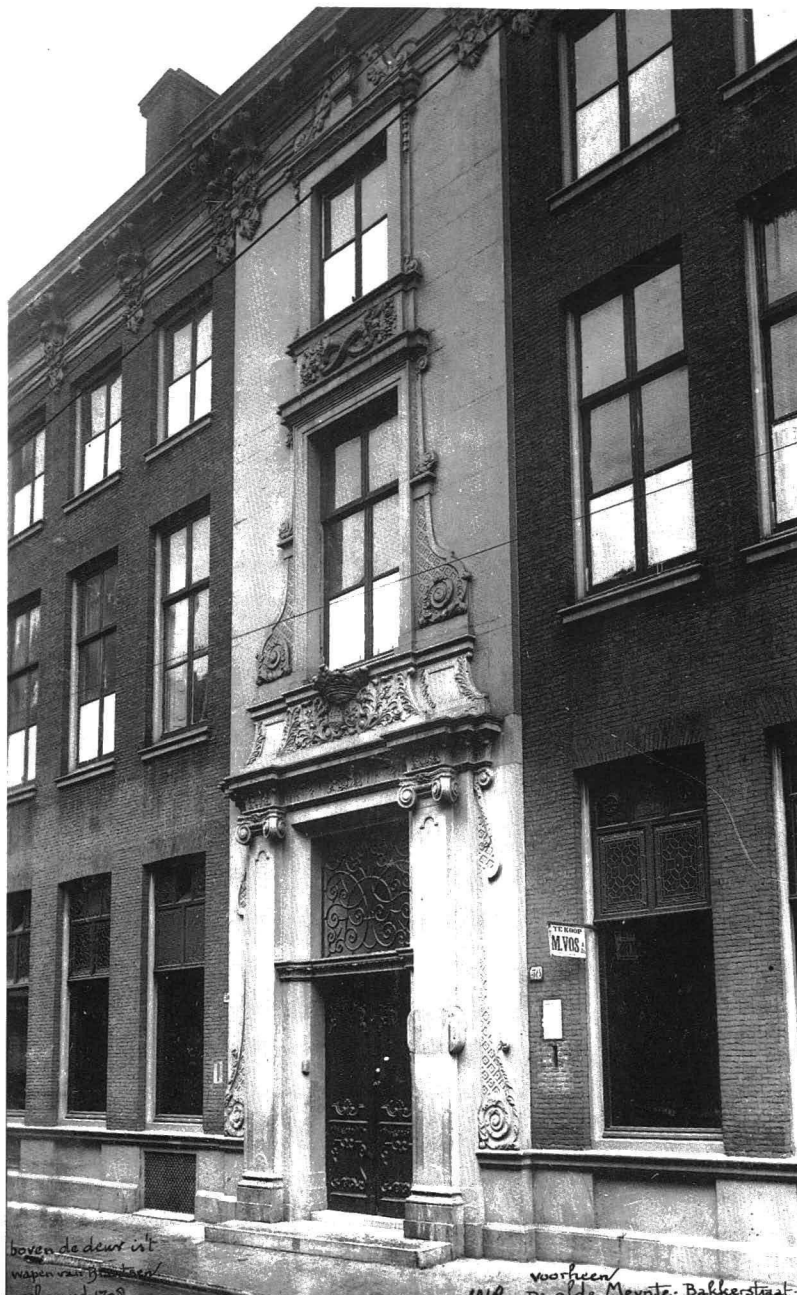
De Olde Munt in de Bakkerstraat in 1918.