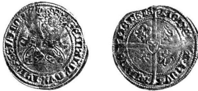
Gelre, Reinoud IV 1402-1423, halve meeuw z.j. (zilver, 21 mm).

Reinoud IV (1402-1423) heeft eveneens in Arnhem gemunt, onder andere een halve meeuw of dubbele groot met midden op het kruis het wapenschild van Arnhem.