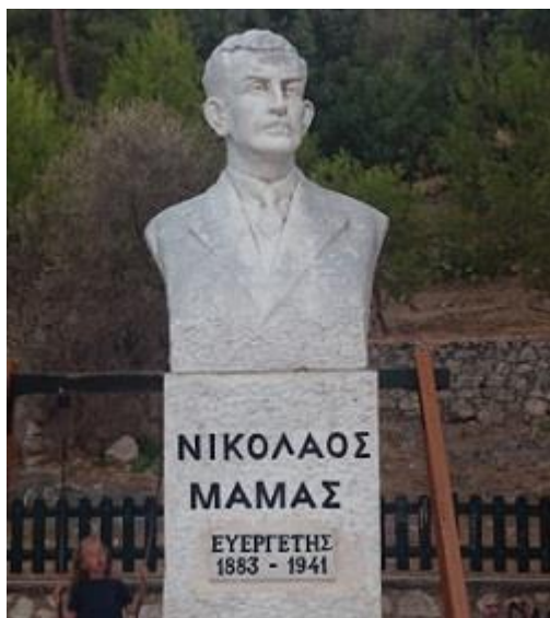
Εικ. 1. XXX