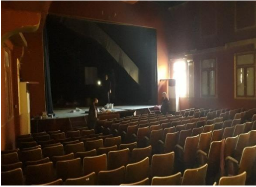
Εικ. 4. ΧΧΧ