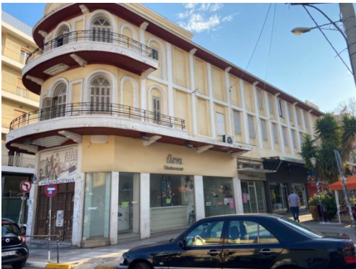
Εικ. 4. XXX