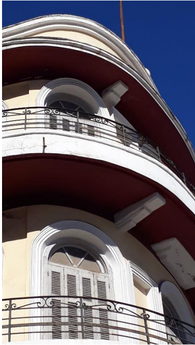
Εικ. 1. XXX

Η κατασκευή του ολοκληρώθηκε στα τέλη του 1930 και η λειτουργία του κινηματοθεάτρου ξεκίνησε στις 25 Ιανουαρίου του 1931. Ήταν κατασκευασμένο με προδιαγραφές κινηματοθεάτρου ήταν εξ ολοκλήρου από οπλισμένο σκυρόδεμα (μπετόν αρμέ) και διέθετε δύο εξόδους, την κεντρική και μια έξοδο κινδύνου. Είχε τη δυνατότητα να φιλοξενήσει 590 θεατές και μπορούσε να εκκενωθεί εντός 5 λεπτών – χρόνος απίστευτος για τις προδιαγραφές της εποχής εκείνης. Ήταν, κυρίως, χειμερινός αλλά με το άνοιγμα των πολλών παραθύρων που διέθετε μπορούσε να λειτουργήσει και κατά τη διάρκεια του καλοκαιριού. Διέθετε σύγχρονες ηλεκτρολογικές εγκαταστάσεις με πίνακες ασφαλείας, συστήματα πρωτοποριακά για την Ελλάδα και φωτισμό κινδύνου. Οι θύρες όλες, εσωτερικά, ήταν μεταλλικές για να υπάρχει θερμική μόνωση σε περίπτωση πυρκαγιάς.