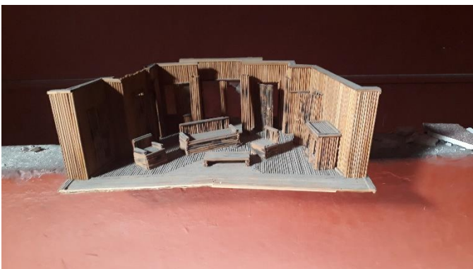
Εικ. 6. ΧΧΧ

Η Ε΄ Δημοτική Κοινότητα Πειραιά στην προσπάθεια διάσωσης του ιστορικού αλλά όχι ακόμη κηρυγμένου διατηρητέου μνημείου, του κτιρίου του Σινέ «Καλλιφόρνια» στη συνοικία Αγία Σοφία του Πειραιά θα πρέπει να προχωρήσει σε πρώτη φάση μια σειρά από νομικές και θεσμικές διαδικασίες.