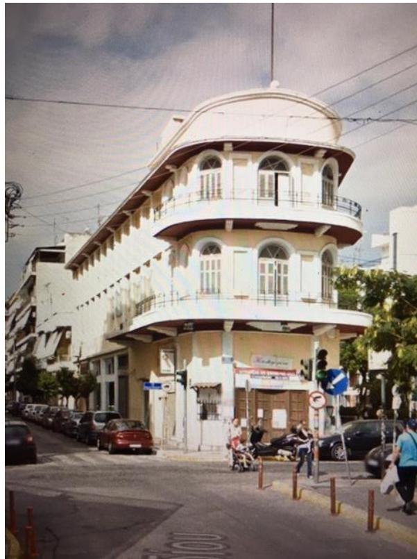
Εικόνα εξωφύλλου: XXX