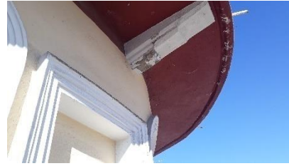
Εικ. 7. και Εικ. 8. XXX