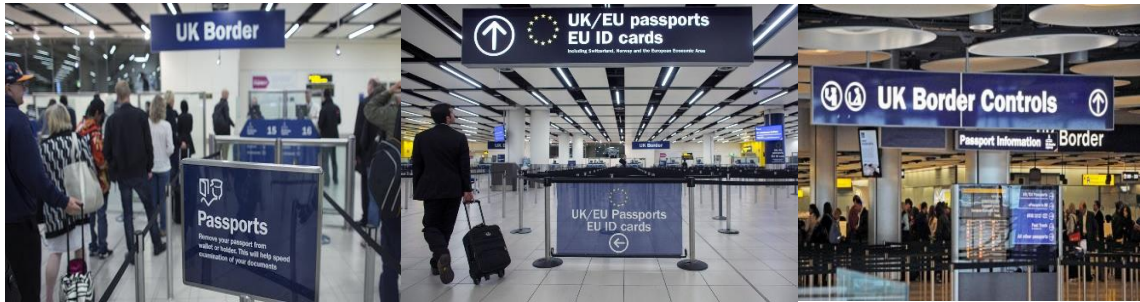
رسم توضيحي 2 - صور لأماكن تختم جوازات السفر، Border Control ويعني أمن الحدود، في مطارات المملكة المتحدة.

عليك أن تخبر ضابط حرس الحدود أنك تريد طلب اللجوء. وذلك يكون قبل الختم على جوازك. لن يتم ترحيلك حتى لو لم تكن دخلت الحدود "رسمياً".