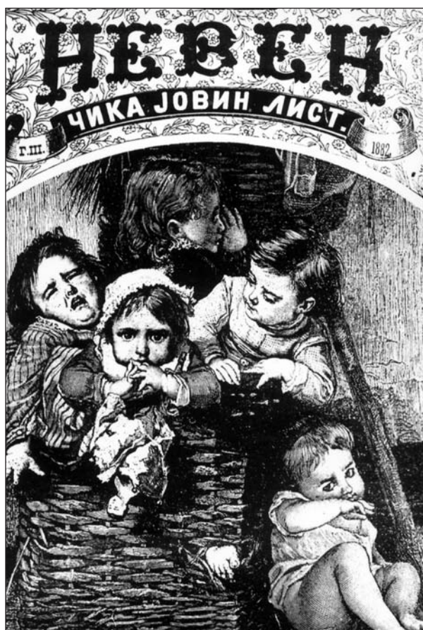
СЛИКА 5. Насловна страна листа „Невен“, чији је власник и уредник био Јован Јовановић Змај.

FIGURE 5. The cover of journal "Neven" owned and edited by Jovan Jovanović Zmaj.