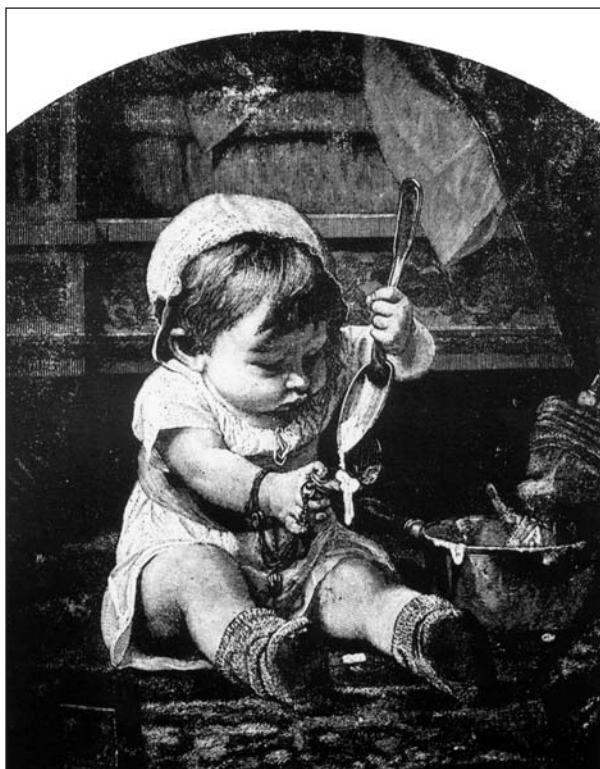
СЛИКА 6. Илустрација из листа „Невен“.

FIGURE 5. The cover of journal "Neven" owned and edited by Jovan Jovanović Zmaj.