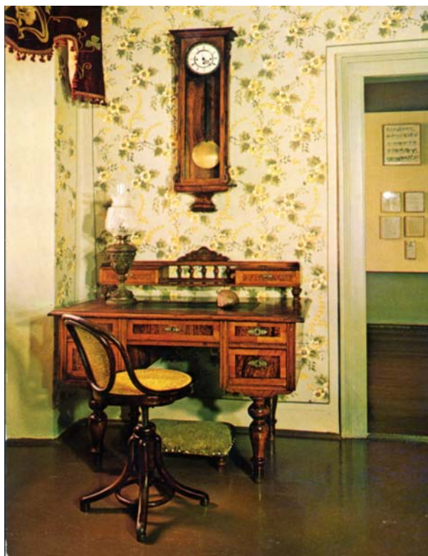
СЛИКА 8. Радни сто Јована Јовановића Змаја. FIGURE 8. Writing table of Jovan Jovanović Zmaj.

ног одбора Српске радикалне странке, члан књижевног одељења Магице српске, почасни доктор пештанског универзитета, члан Српског лекарског друштва. Високи црквени представници нису били на сахрани, али 12 пароха је држало опело.