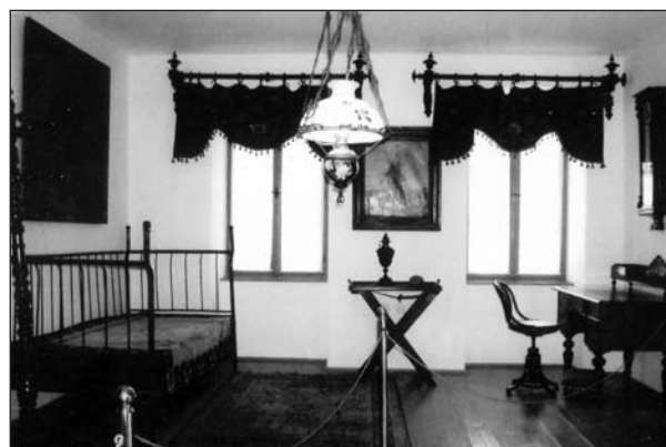
СЛИКА 7. Соба др Јована Јовановића Змаја у Сремској Каменици.

Али, када је умро, почели су дуги некролози, а лист „Застава” излази црно уоквирен. Истичу да је био члан Српске краљевске академије, члан Управ-