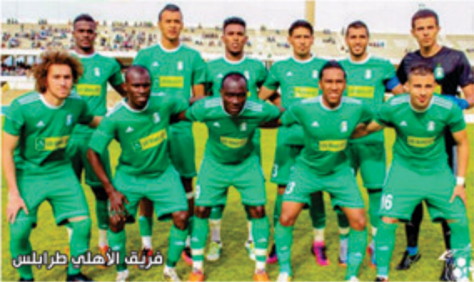
فريق الأهلي طرابلس