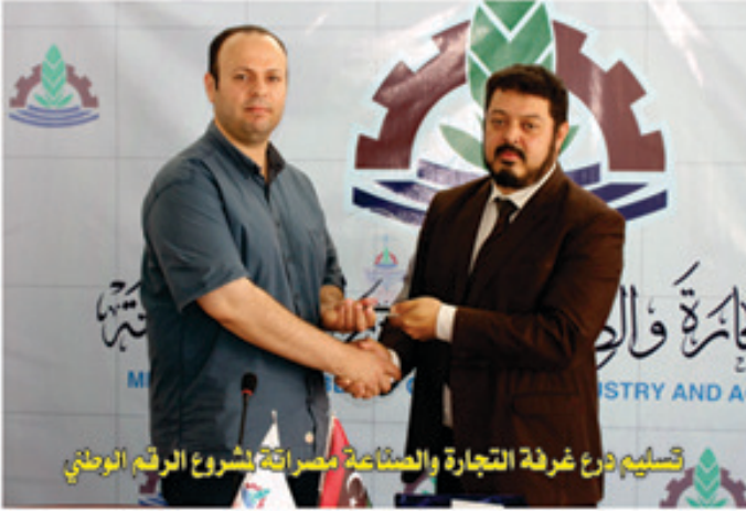
تسليم ذرع غرفة التجارة والصناعة بصراقة مشروع الرقم الوطني

استضافتي وحسن استقبالك، وتتمنى تقديم وتسهيل الخدمات على كافة المواطنين الليبيين وما يحمله مشروع الرقم الوطني من أهداف.