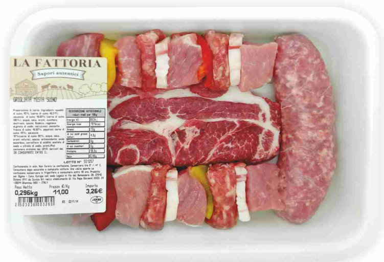
Grigliata mista di suino La Fattoria