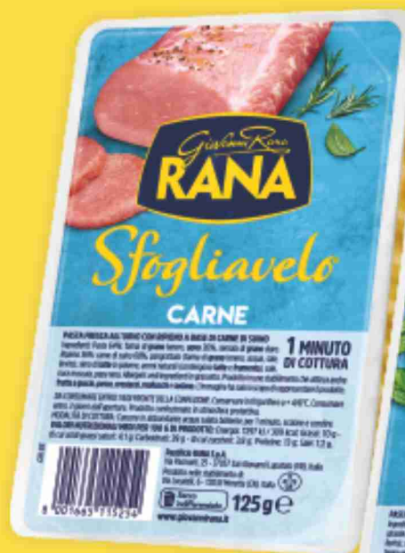
Pasta fresca ripiena Sfogliavelo Rana vari tipi g 125