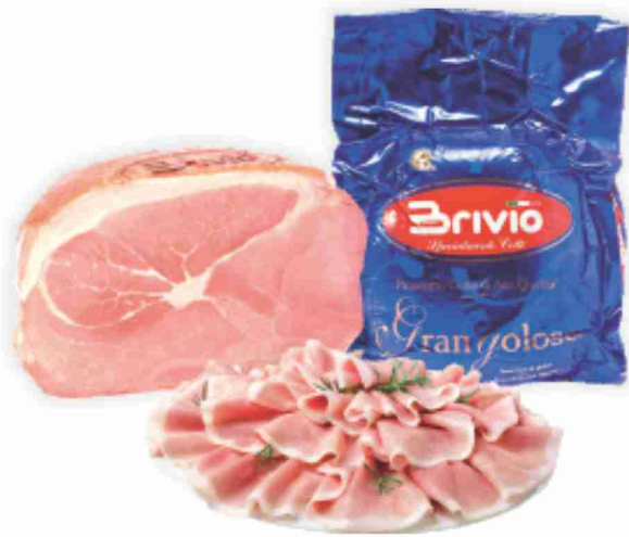
Prosciutto cotto Alta Qualità Grangoloso Brivio al kg 13,90