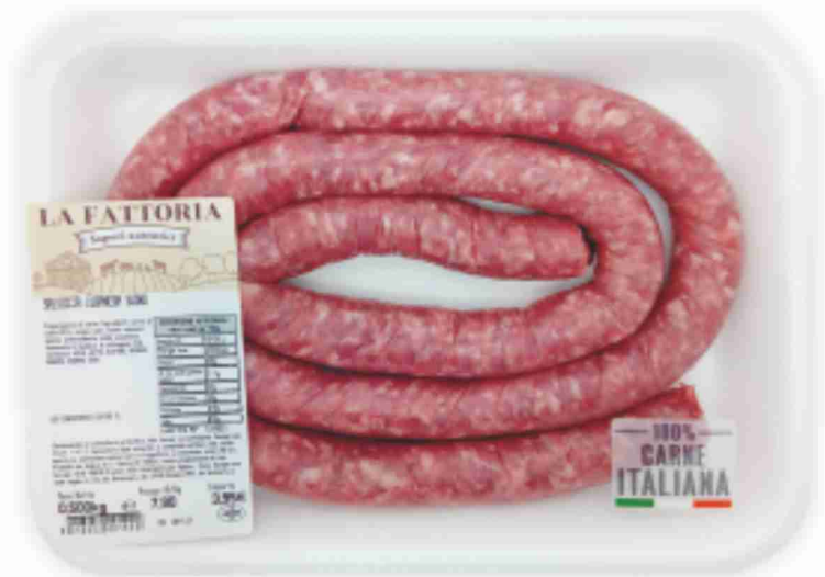
Luganega di suino La Fattoria g 450