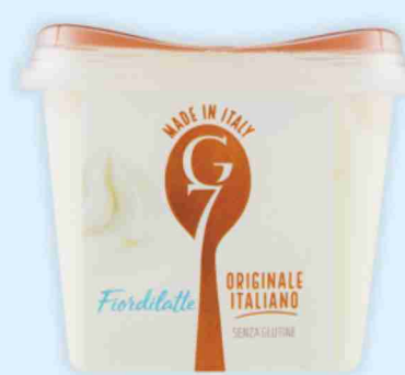
Gelati G7 vari gusti g 500