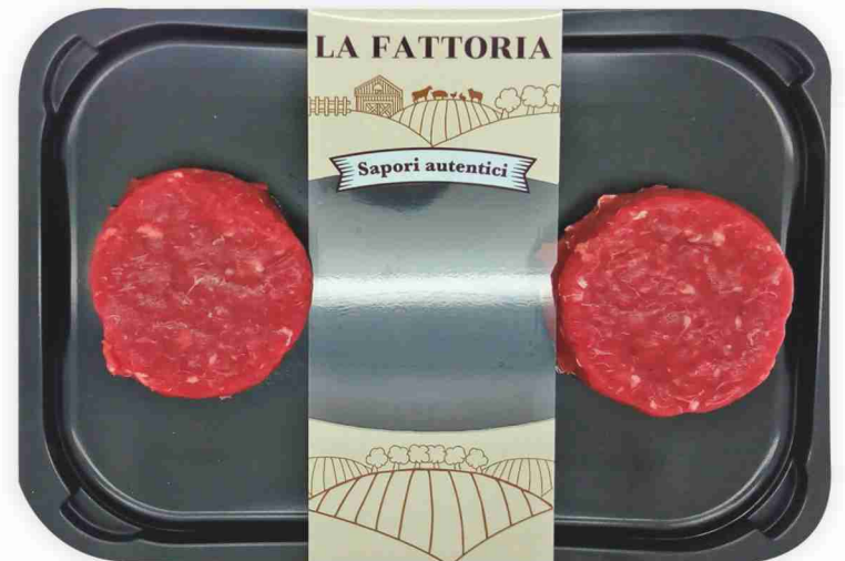
Tartare "La classica" di bovino adulto La Fattoria g 200