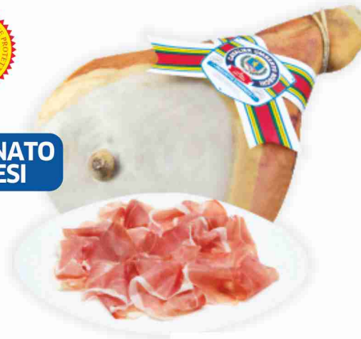
Prosciutto di Parma D.O.P. Cav. Umberto Boschi al kg 19,90