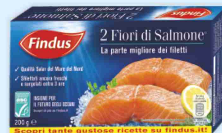
Fiori di salmone Findus g 200