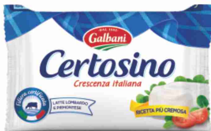
Certosino Galbani g 100