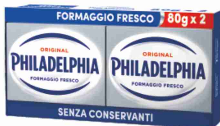
Philadelphia classico g 80x2