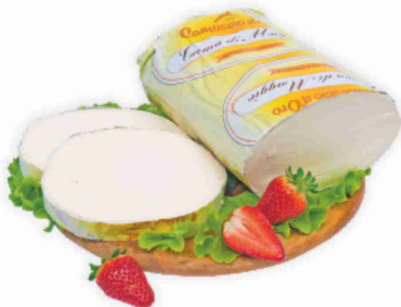
Crema di Maggio Camoscio d'Oro al kg 11,90