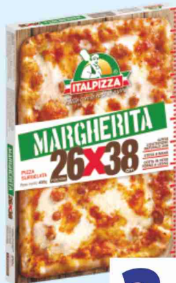
Pizza margherita Italpizza 26x38 cm g 470