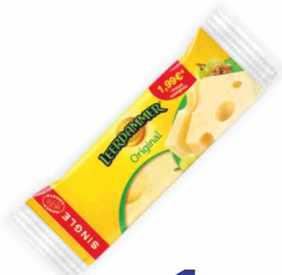
Leerdammer g 150