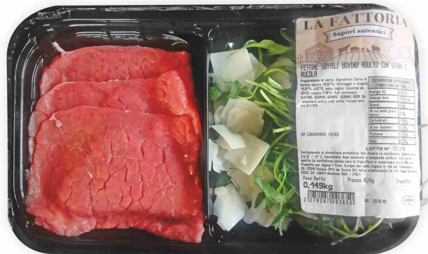
Carpaccio con grana e rucola La Fattoria