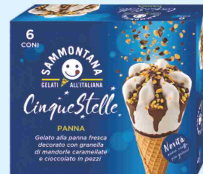
Cono Cinque Stelle Sammontana vari gusti g 450