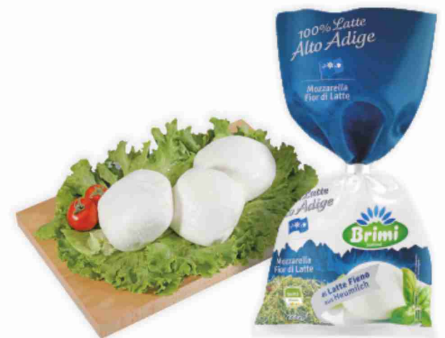
Mozzarella fior di latte Brimi g 200