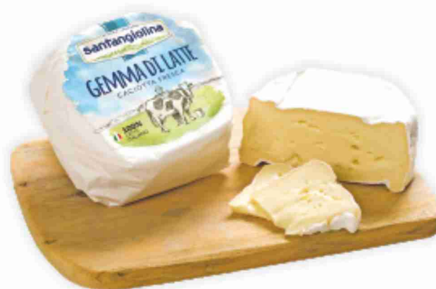
Caciotta fresca Gemma di latte Santangiolina al kg 6,90