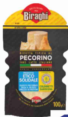
Pecorino grattugiato Biraghi g 100