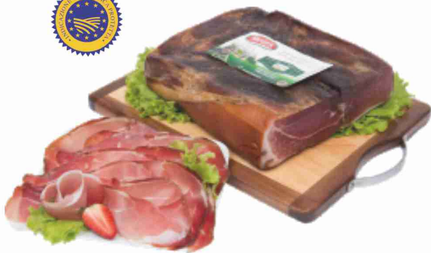
Speck dell'Alto Adige I.G.P. Moser al kg 15,90