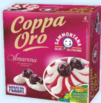
Coppa Oro Sammontana vari gusti g 360