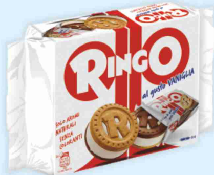
Gelato snack Ringo vari gusti g 280