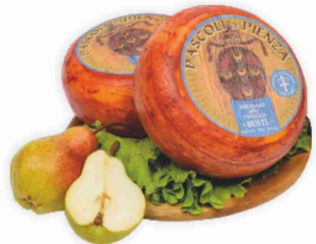
Pecorino Pascoli di Pienza Busti al kg 13,90