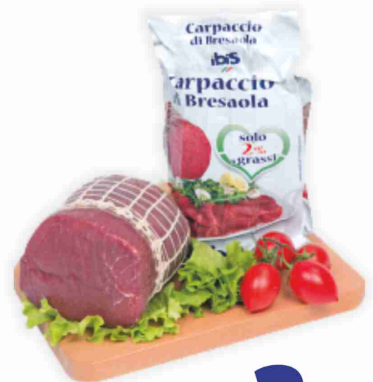
Carpaccio di bresaola Ibis al kg 26,90