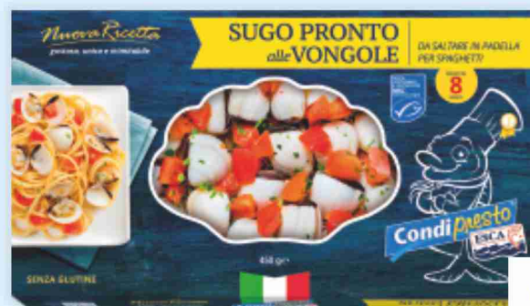
Sugo pronto alle vongole Condi presto Esca g 450