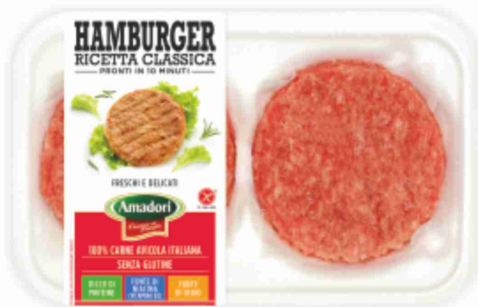
Hamburger di tacchino Amadori g 204