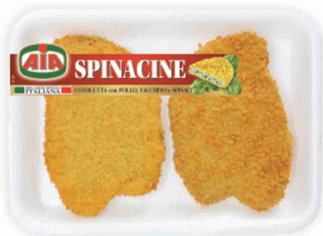
Spinacine Aia g 220