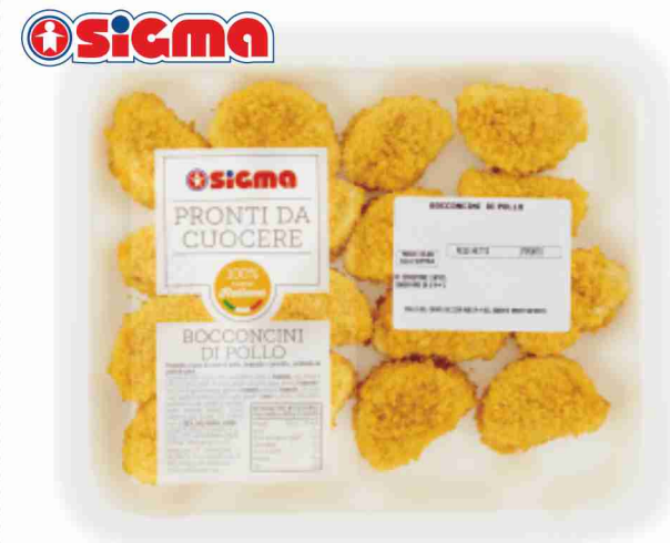
Bocconcini di pollo panati g 300