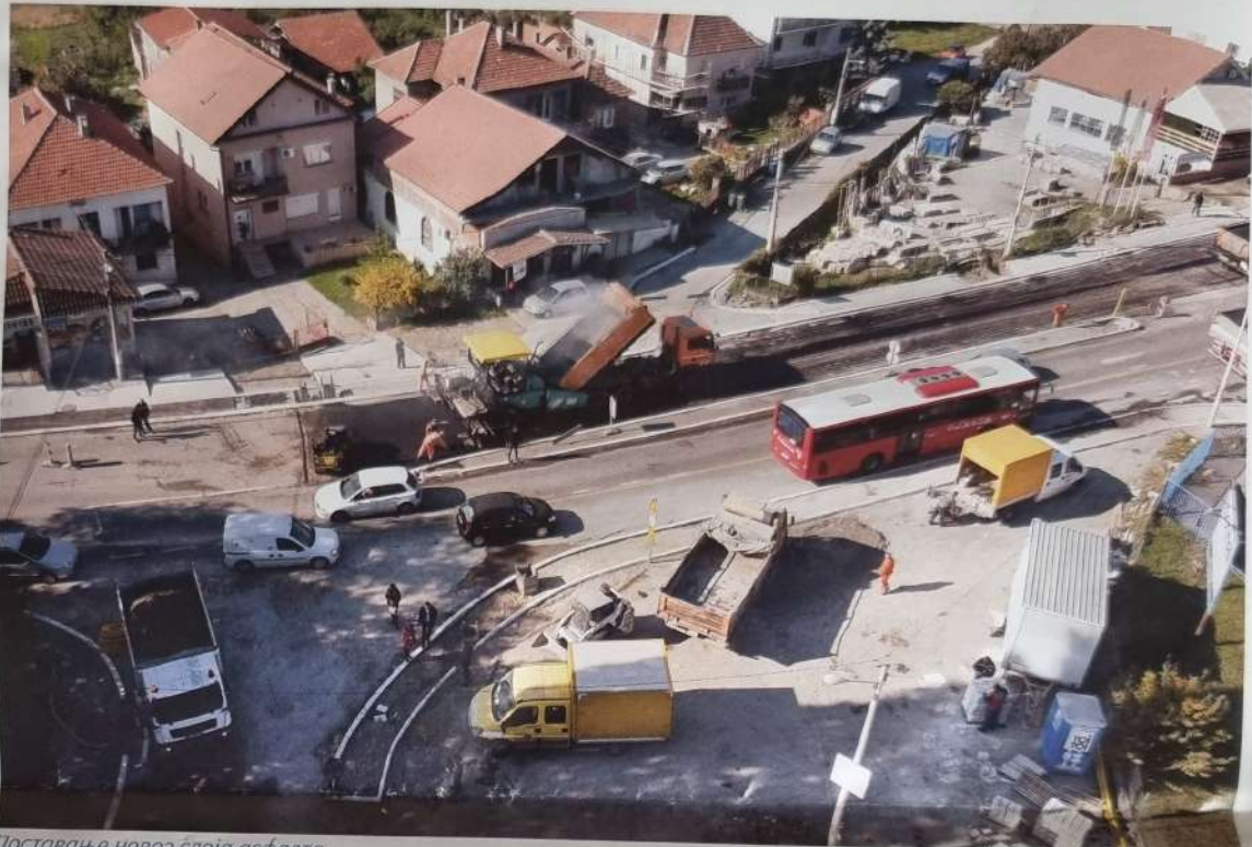
Постављање новог слоја асфалта

У наредном периоду раскрсница ће бити семафоризована и биће извршено постављање ограда као вид физичке заштите тротоара.