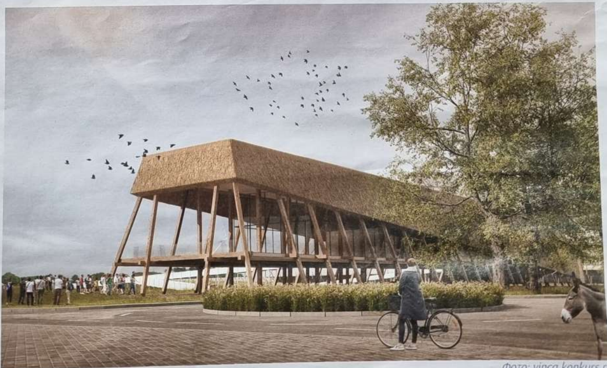
Будући визиторски центар