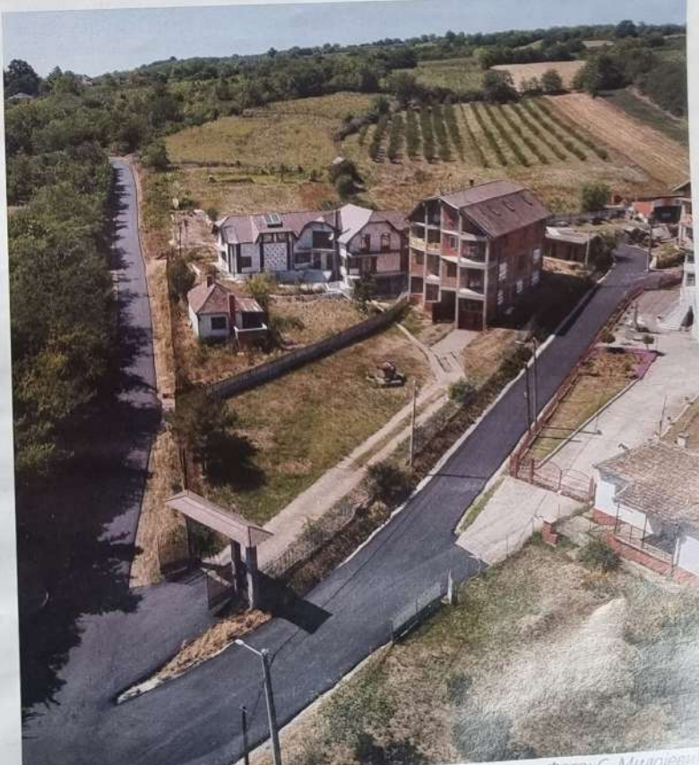
Гробљанска улица у Умчарима

У насељу Пударци уређен је крак улице Народних хероја дужине 180 метара, а у Камендолу три крака улице 21. августа укупне дужине 160 метара. У Дражњу су насуте две улице дужине 290 метара, у Живковцу два крака улице Добривоја Михајловића дужине 140 метара а у Умчарима су насуте паркинзи и пешачке стазе на месном гробљу као и улица Николе Пашића укупне дужине од 780 метара.