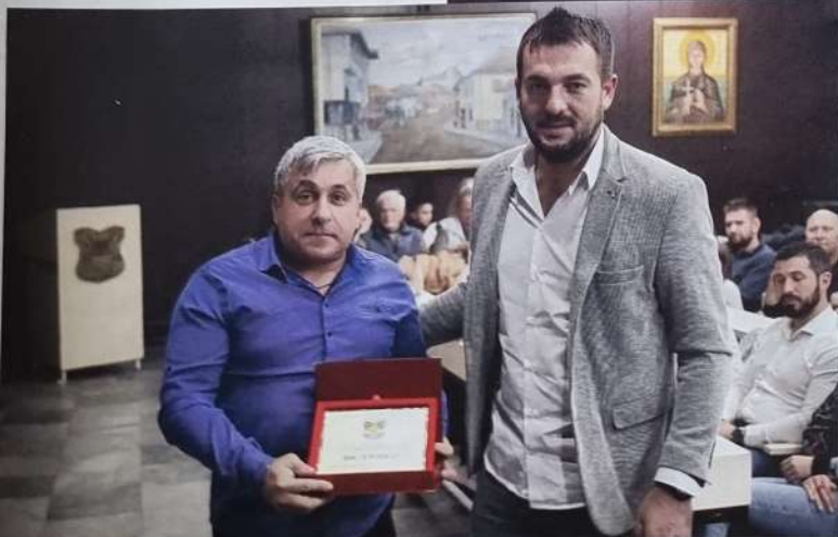
Плакета најуспешнијем клубу