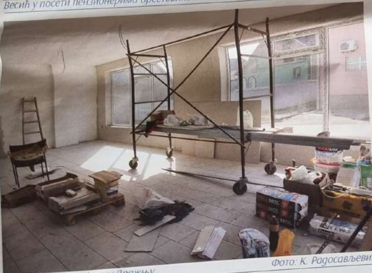
Радови на ентеријеру у Дражњу

Тком 2023. године планиран је наставак инвестиција овог типа, а у планирани су радови на реконструкцији просторија у насељима Болеч, Заклопача и Ритопек.