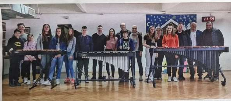
Нови инструменти у Врчину

Крајем школске године у великој сали градске општине Гроцка, организован је традиционални пријем, вуковаца, ђака генерације и ученика који су освојили запажене резултате на градским, државним републичким и спортским такмичењима са територије општине Гроцка. Ученицима су уручене похвалнице, и књиге највећих домаћих аутора а за најбоље су обезбеђени лаптопови и стратешке друштвене игре са тематиком из националне историје "Пробој Солунског фронта".