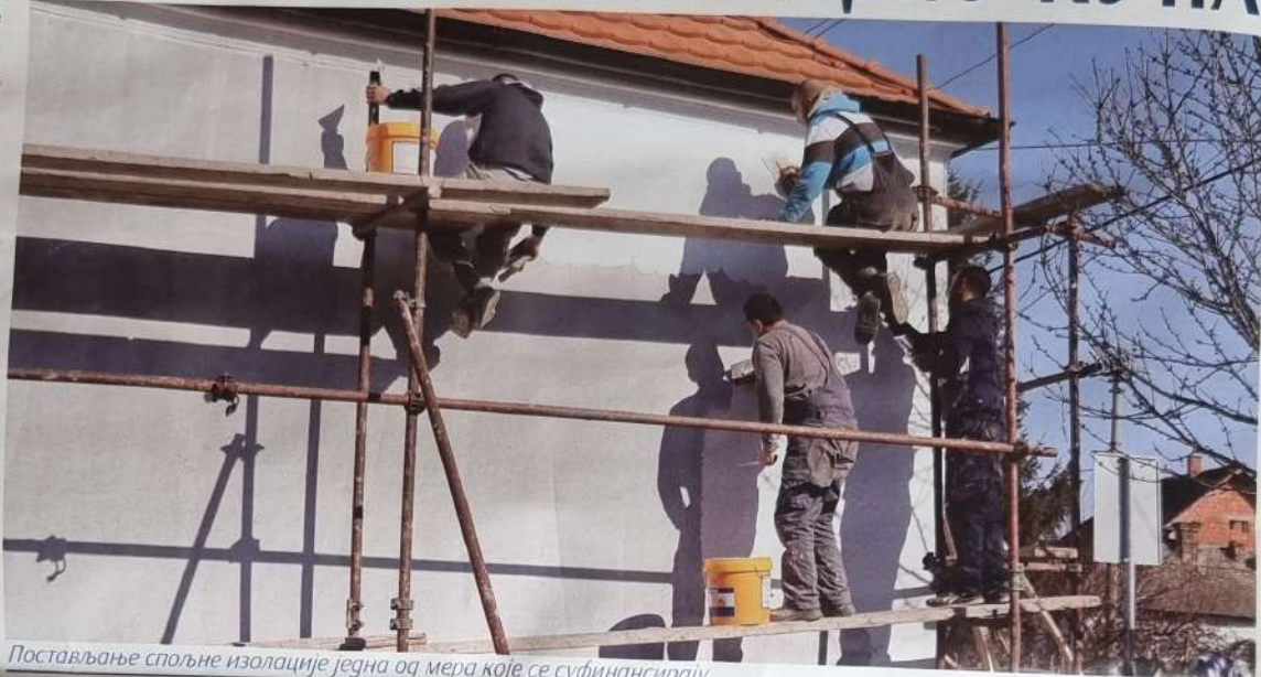
Постављање спољне изолације једна од мера које се суфинансирају

Веће градске општине Гроцка, на седници одржаној 14. децембра 2022. године на основу Одлуке Већа градске општине Гроцка о расписивању Јавног конкурса за финансирање мера енергетске санације бр. 401-1024 од 04. новембра 2022. године и Правилника о суфинансирању мера енергетске санације, породичних кућа и станова које се односе на унапређење термичког омотача, термотехничких инсталација и уградње соларних колектора за централну припрему потрошне топле воде по јавном позиву Управе за подстицање и унапређење енергетске ефикасности ЈП 1/22 („Службени лист града Београда“ број 73/22) донело је одлуку о расписивању ЈАВНОГ КОНКУРСА ЗА ФИЗИЧКА ЛИЦА за суфинансирање мера енергетске санације, породичних кућа и станова које се односе на унапређење термичког омотача, термотехничких инсталација и уградње соларних колектора за централну припрему потрошне топле воде на територији градске општине Гроцка за 2022. годину.