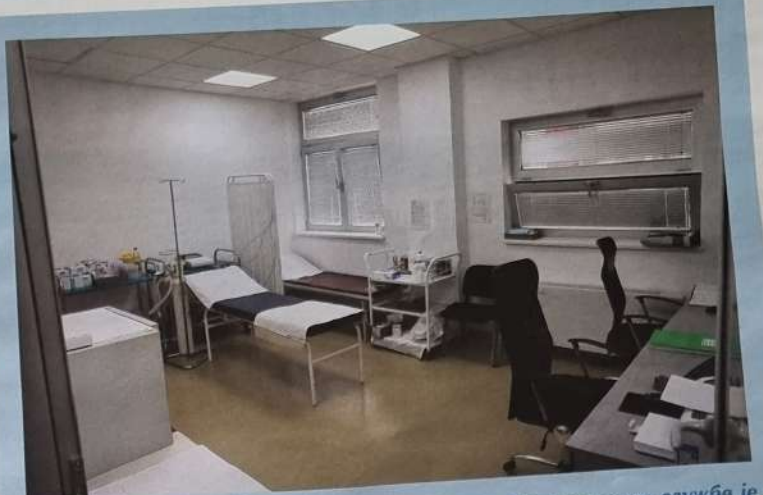
Служба хитне медицинске помоћи од 15. септембра поново ради у просторијама Здравствене станице у Калуђерици! Радно време службе је 00-24. сата. Након пожара који је потпуно уништио просторије ове службе маја 2020. године, Хитна служба је била измештена у Здравствену станицу у Винчи. Простор Хитне медицинске помоћи у Здравственој станици у Калуђерици је у потпуности обновљен. У објекту у Калуђерици су извршени радови на поправци централне климе и лифта.