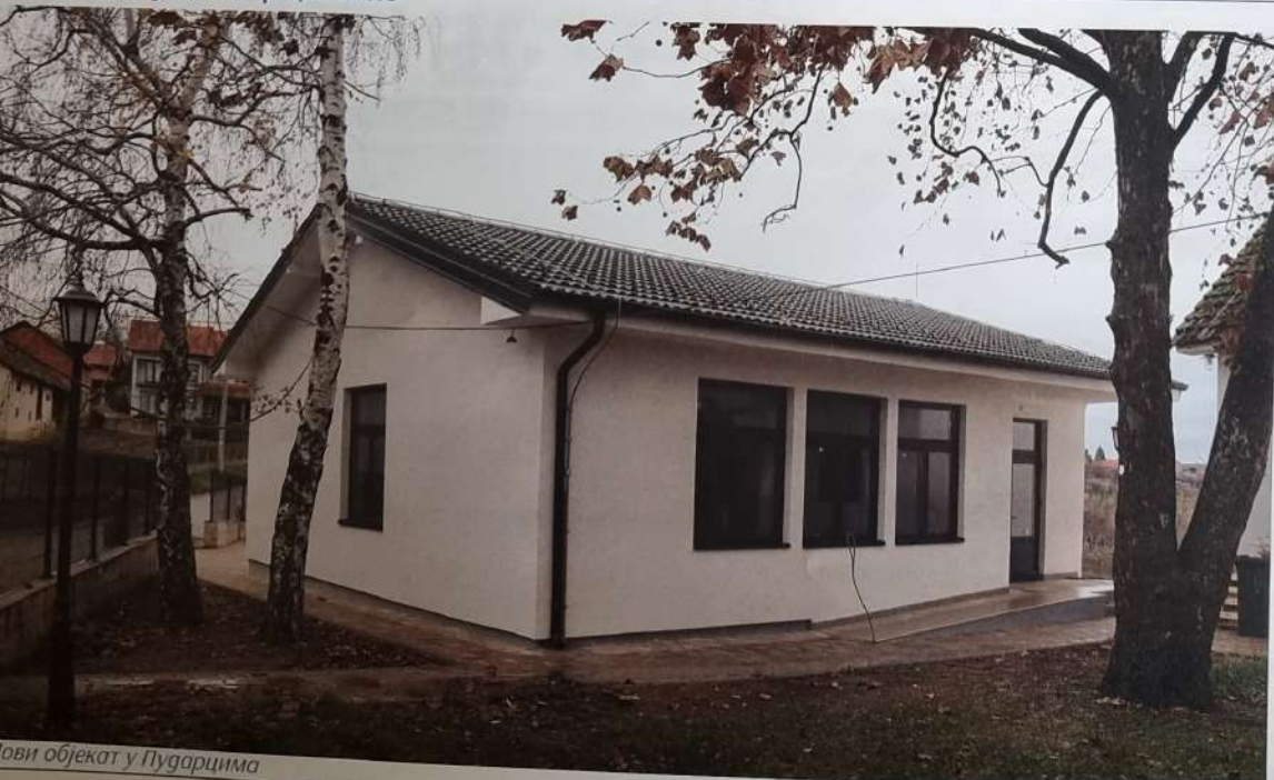
Нови објекат у Пударцима