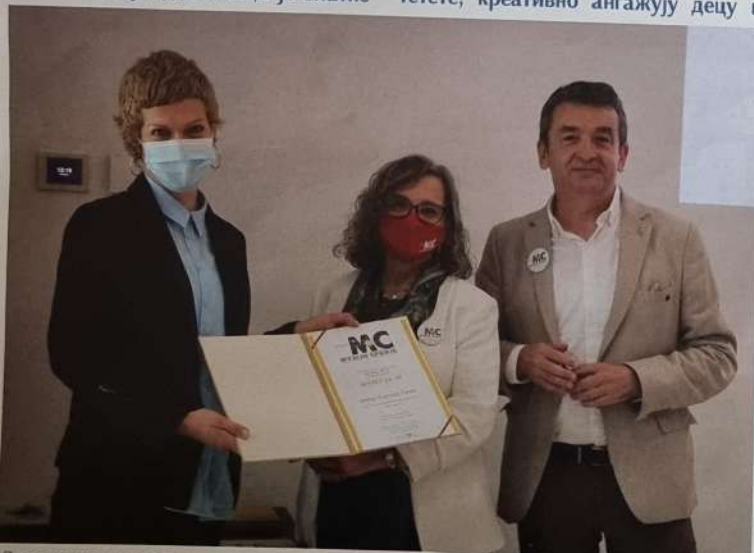
Додела вредног признања

Атрактиван програм привлачи у Ранчићеву кућу нове посетиоце, а снимци догађаја су трајно доступни на youtube каналу установе.