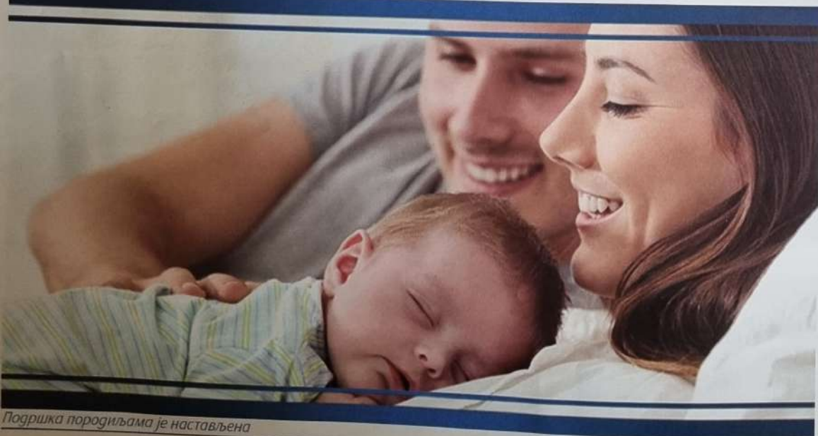
Подршка породиљама је настављена