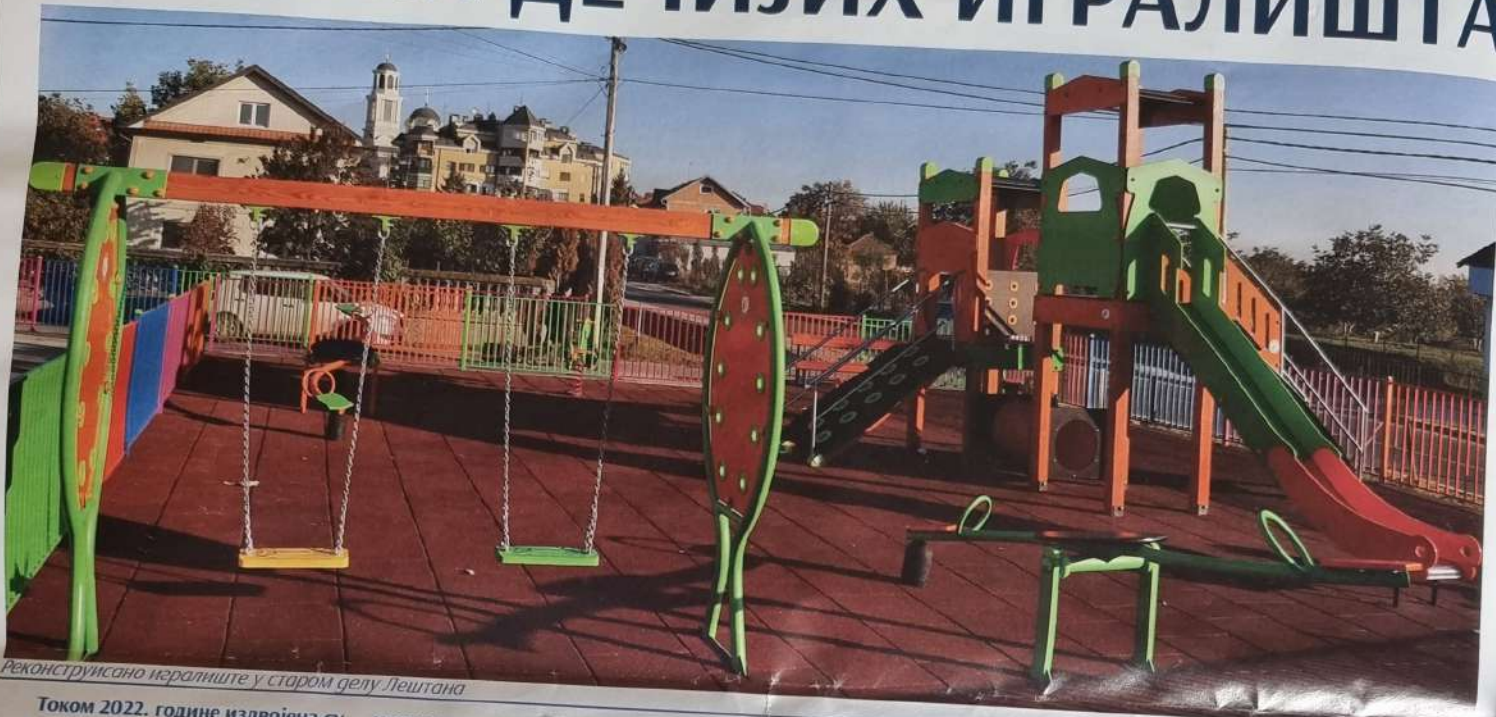
Реконструисано игралиште у старом делу Лештана