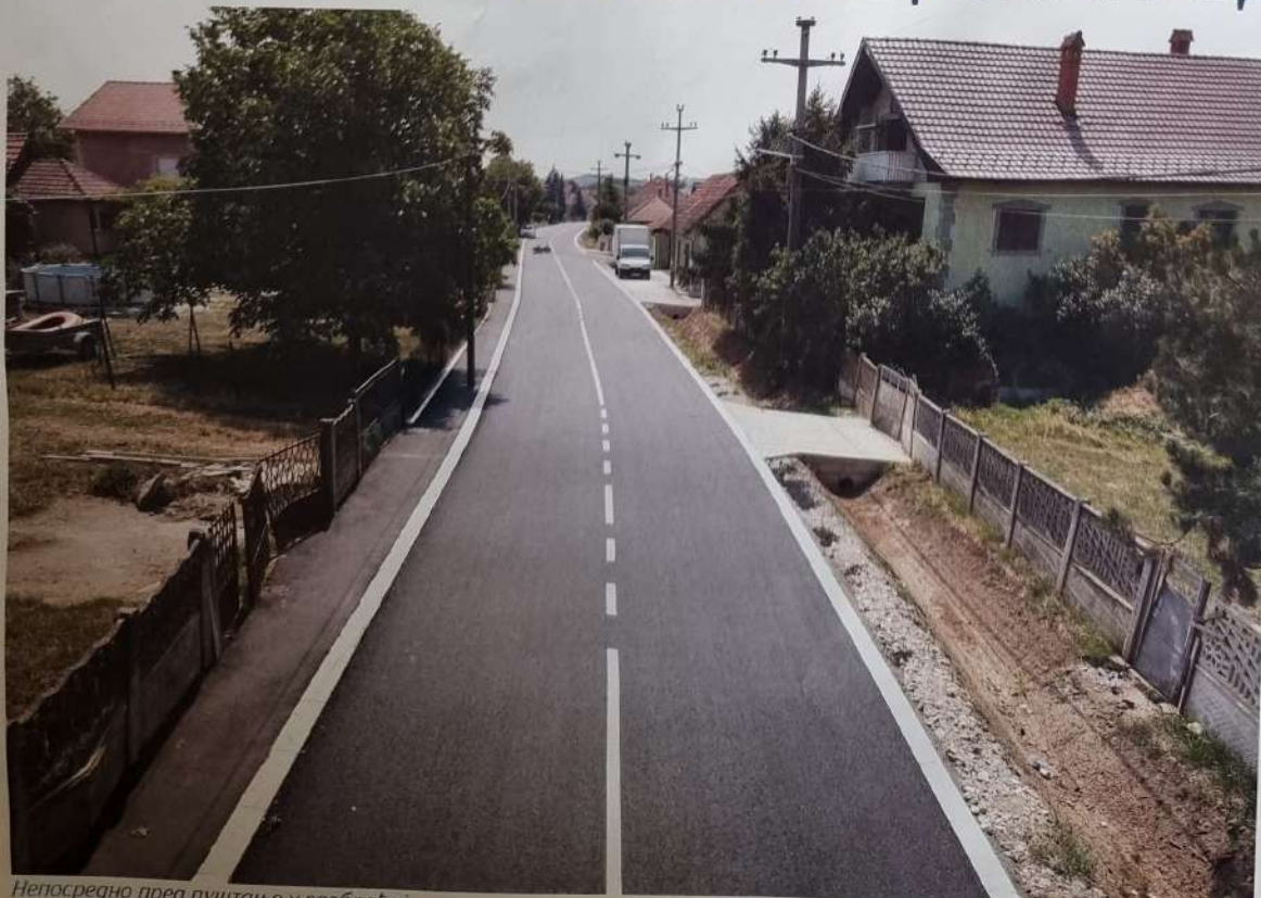
Непосредно пред пуштање у саобраћај