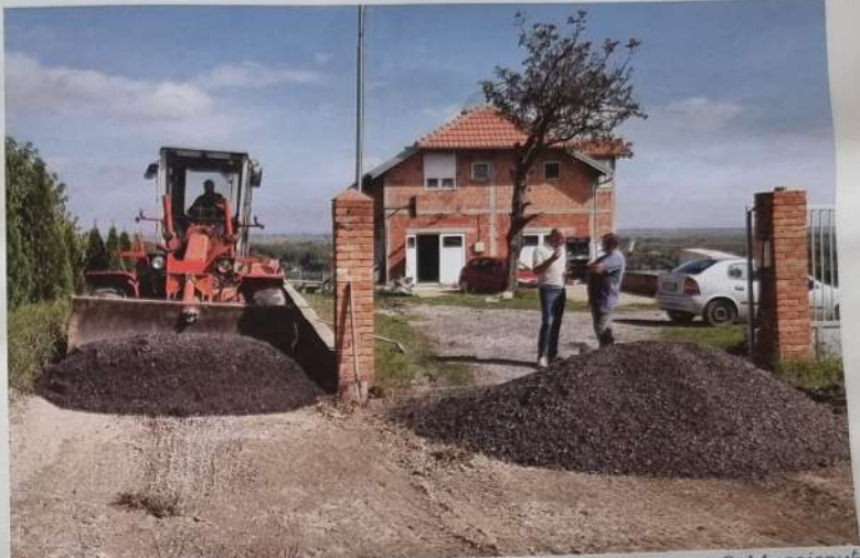
Насипање Милоша Обреновића у Винчи

У другој половини године извршено је уређење и насипање струганим асфалтом некатегорисаних улица, као и улица са нерешеним имовинским односима због којих не могу да уђу у процес регуларног