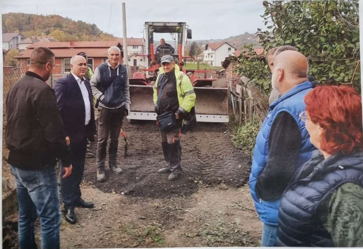
Насыпање улица у Бегалници

суграђане. Очекује нас година инвестиција, у сарадњи са градским и републичким органима урадићемо много ствари, које су од суштинског значаја за све житеље општине Гроцка.