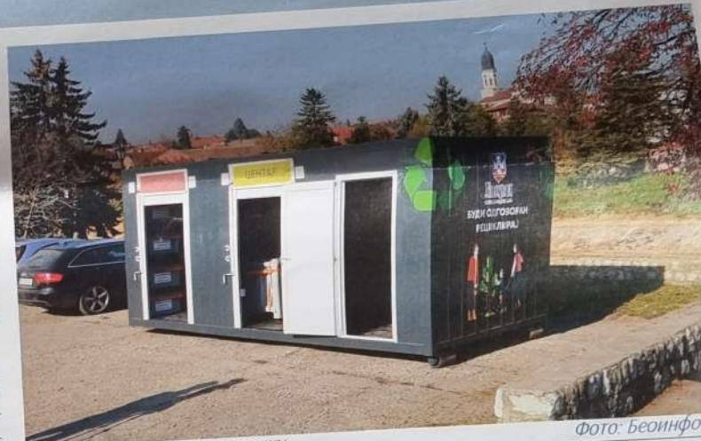
Позиција центра за рециклажу

Грађани Гроцке овде могу да одложе старе аутомобилске гуме и акумулаторе, моторна уља, амбалажу од пестицида или других токсичних материја.