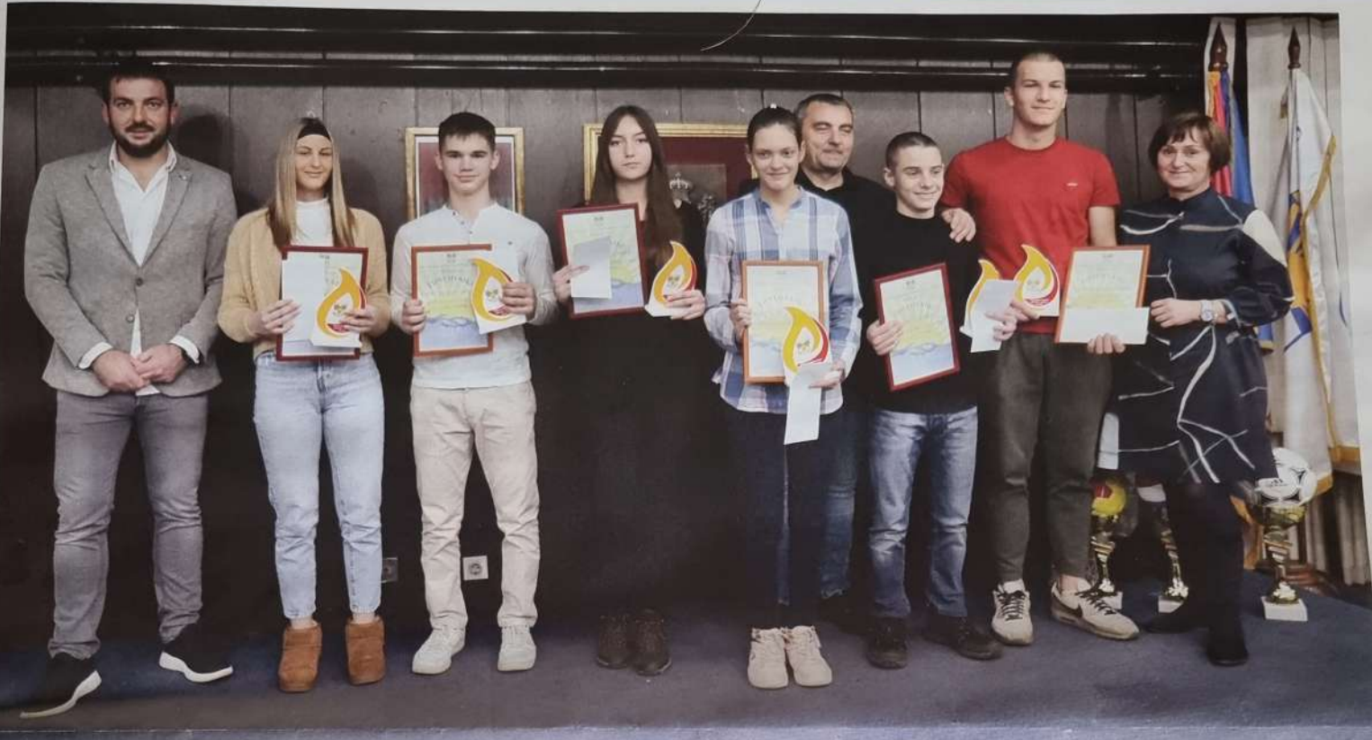
Најуспешнији спортисти у 2022. години