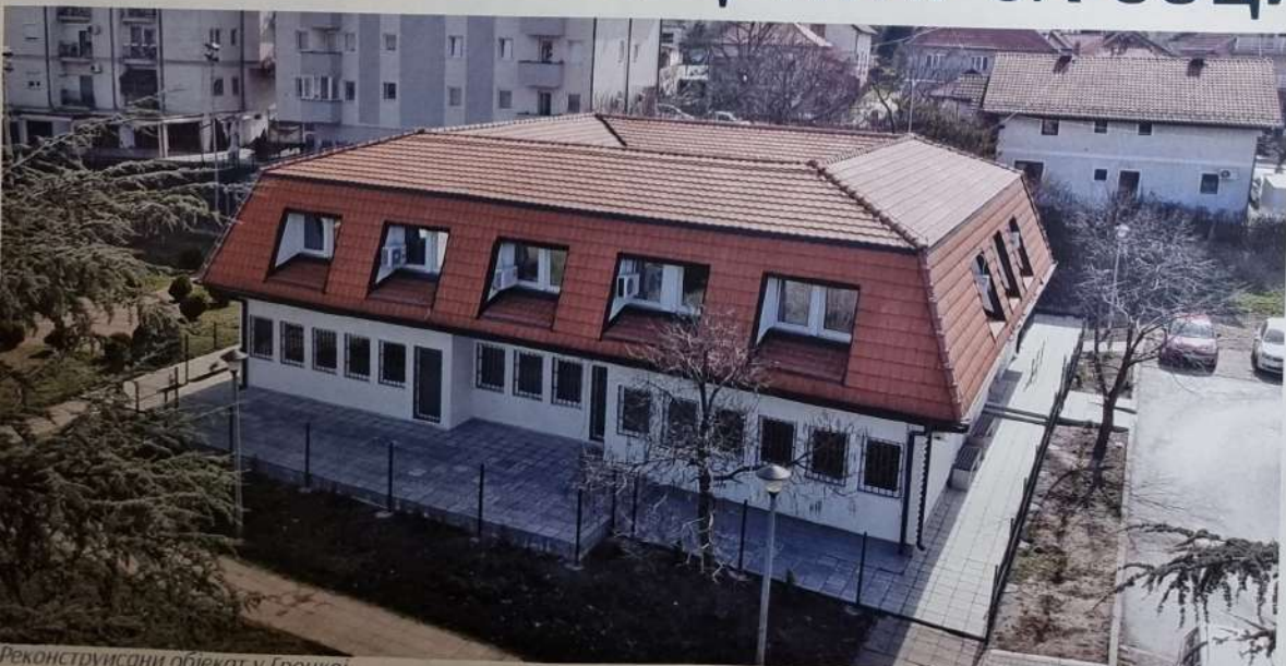
Реконструисани објекат у Гроцкој