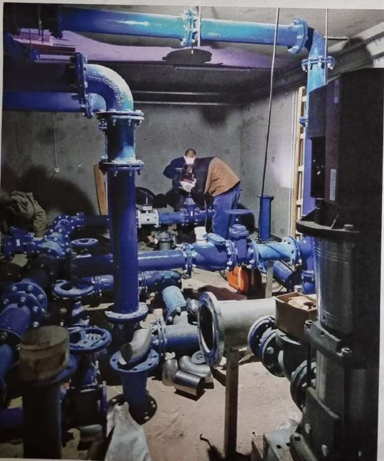
Повезивање прекидне коморе у Ритопеку

Првом фазом пијаћом градском водом биће покривено 500 становника, реализацијом друге фазе обезбедиће се пијаћа вода за нових 500 корисника да би завршетком треће фазе пијаћу воду добило још додатних две хиљаде корисника. Завршетком пројекта обезбедиће се