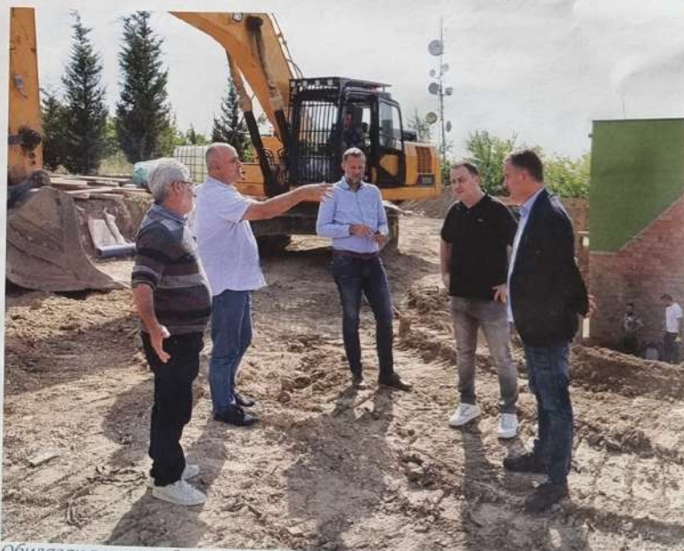
Обилазак радова у Ритопеку