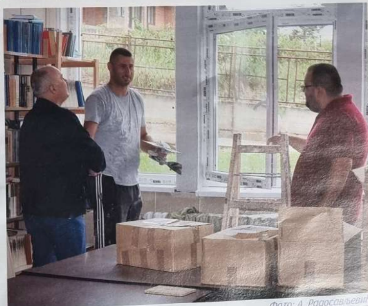
У обиласку радова на школи

љне столарије и свих улаза. У свим учионицама и ходницима израђени су потпуно нови спуштени плафони, а застарела плафонска расвета од флуо цеви замењена је у свим учионицама и ходницима новим ЛЕД панелима.