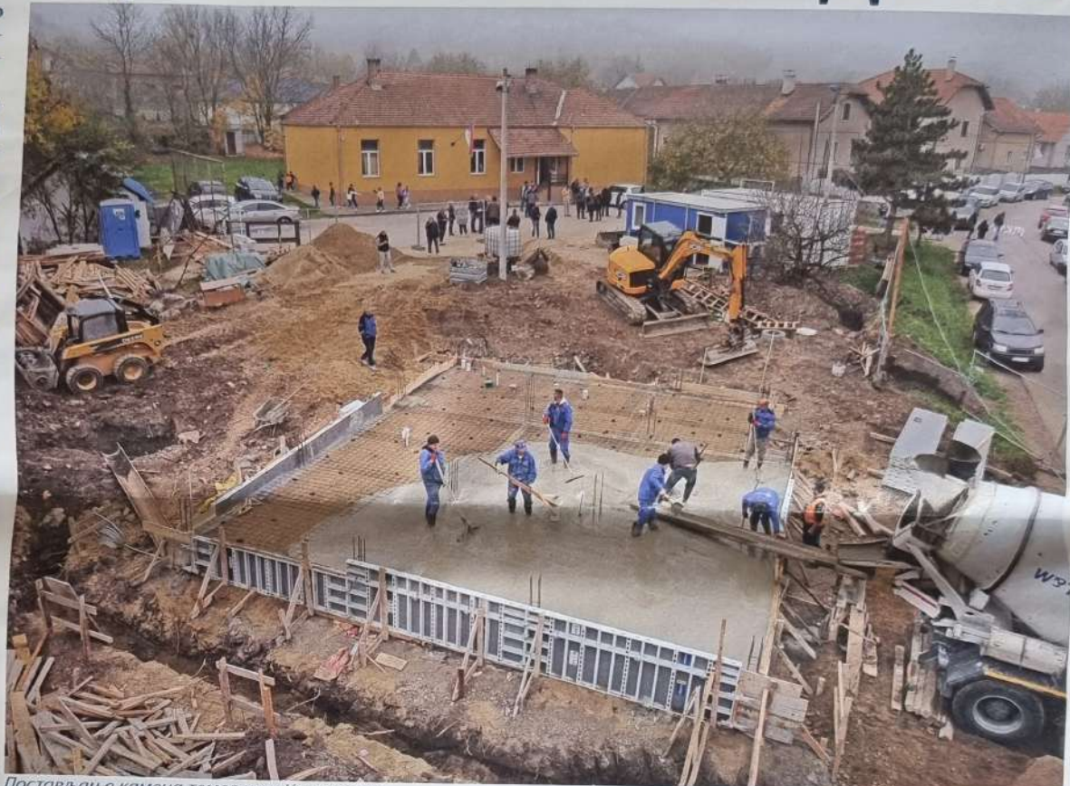
Постављање камена темељаца у Камендолу