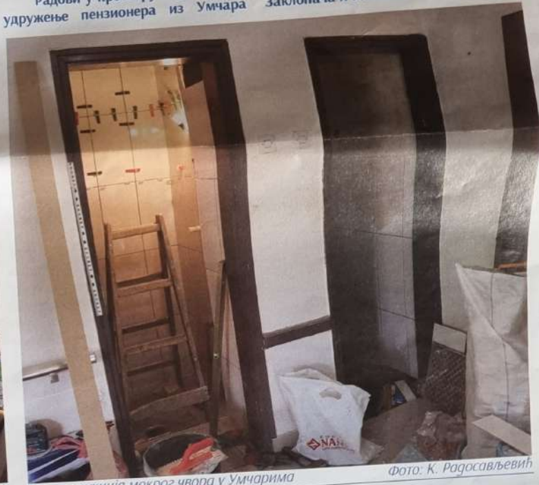
Реконструкција мокрог чвора у Умчарима