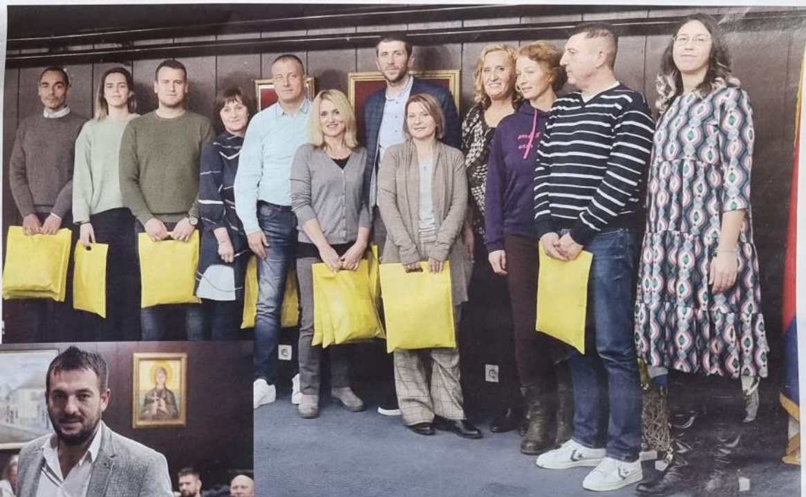
Посебне похвалнице наставницима физичког васпитања