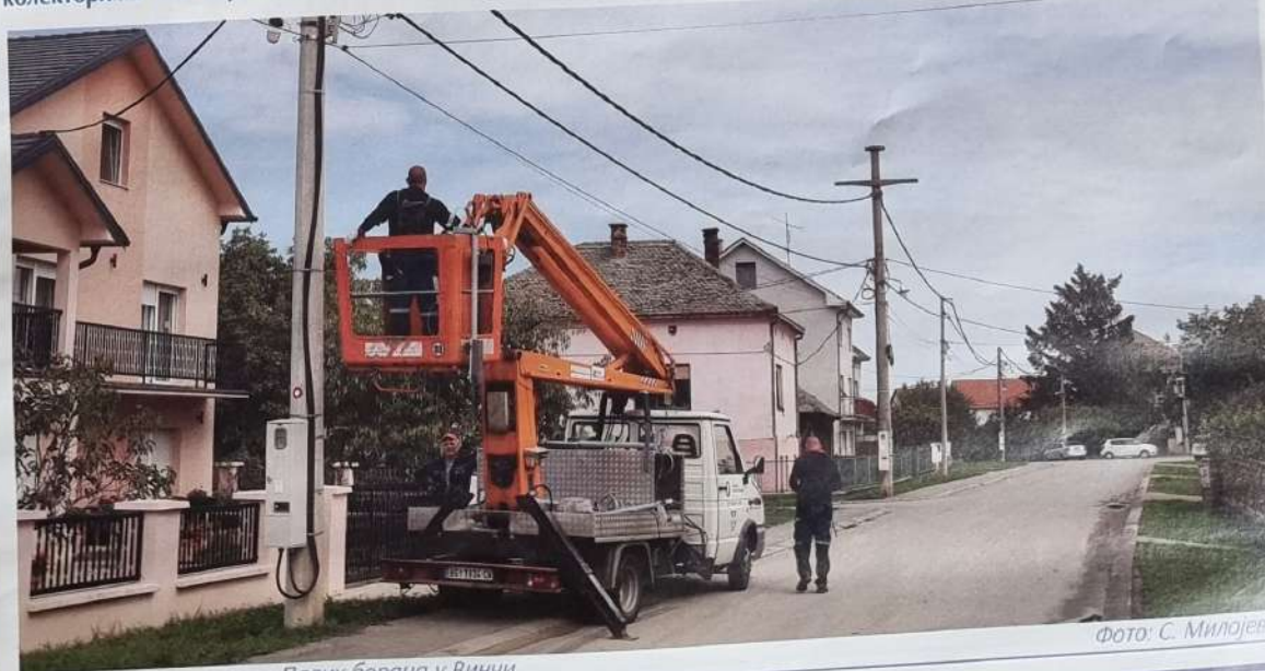
Замена расвете у улици Палих бораца у Винчи

Кочића и Граничарске у дужини од 900 метара, као и код скретања за хладњачу ПКБ "Болеч" у дужини од 400 метара.