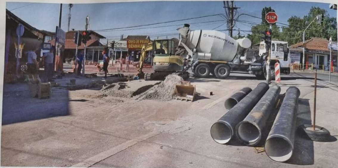
Прикључење Винчанског водовода на регионални систем