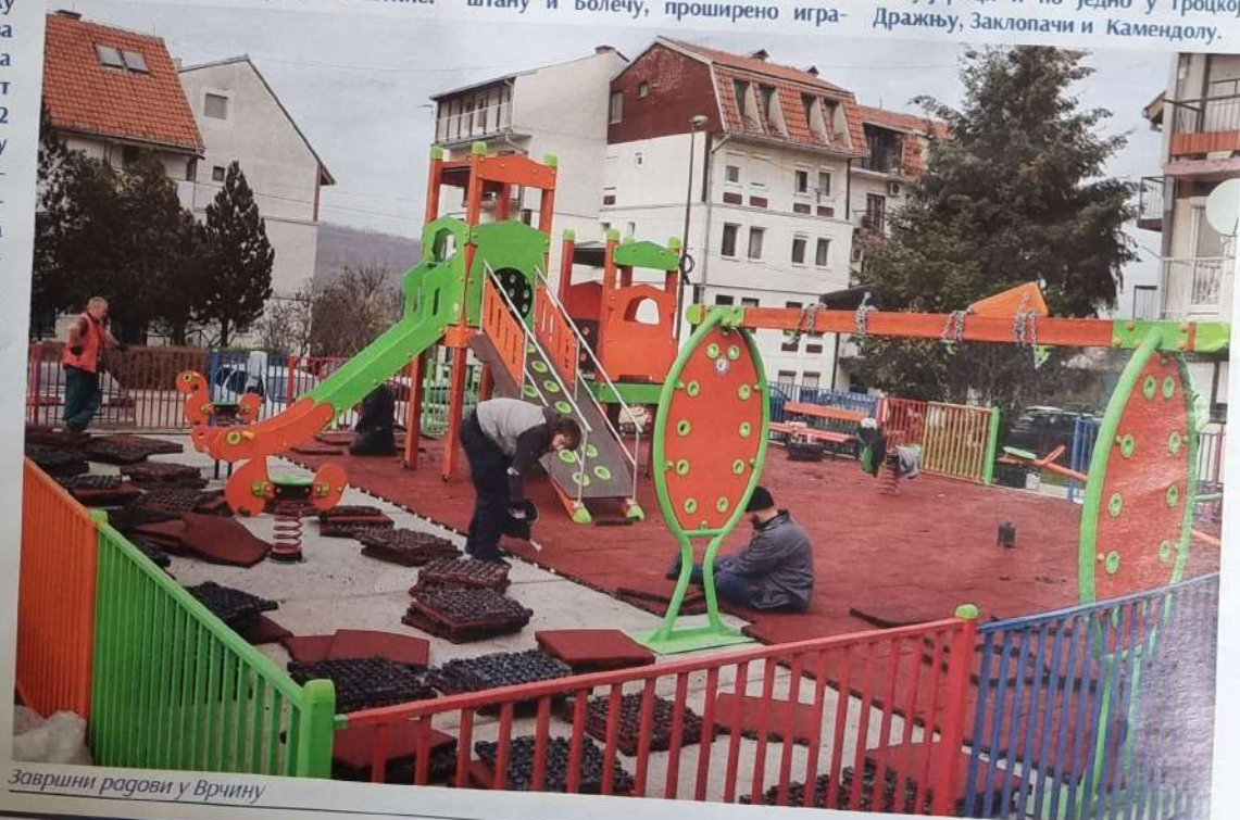
Завршни радови у Врчину

Ван школских дворишта, реконструисан је дечији парк у Винчи у Светосавској улици, и изграђена два нова, у Лештану и Пударцима за децу до 8 година. Инвестицију од 12