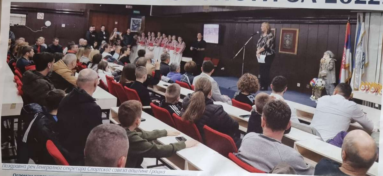
Поздравна реч Генералног секретара Спортског савеза општине Гроцка