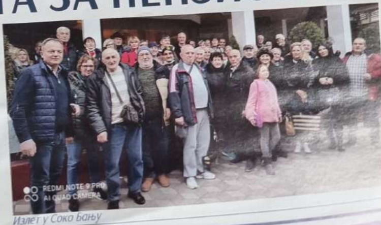
Излет у Соко Бању

Свакој групи која је путовала била је обезбеђена медицинска пратња. Пензионери су имали могућност да се пријаве сами, а формиран је и кол-центар који је позивао све пензионере са наше територије. Током 2022. године на једнодневни излет путовало је преко 4250 наших пензионера. Током 2023. у плану је наставак организације оваквог вида подршке најстаријима.