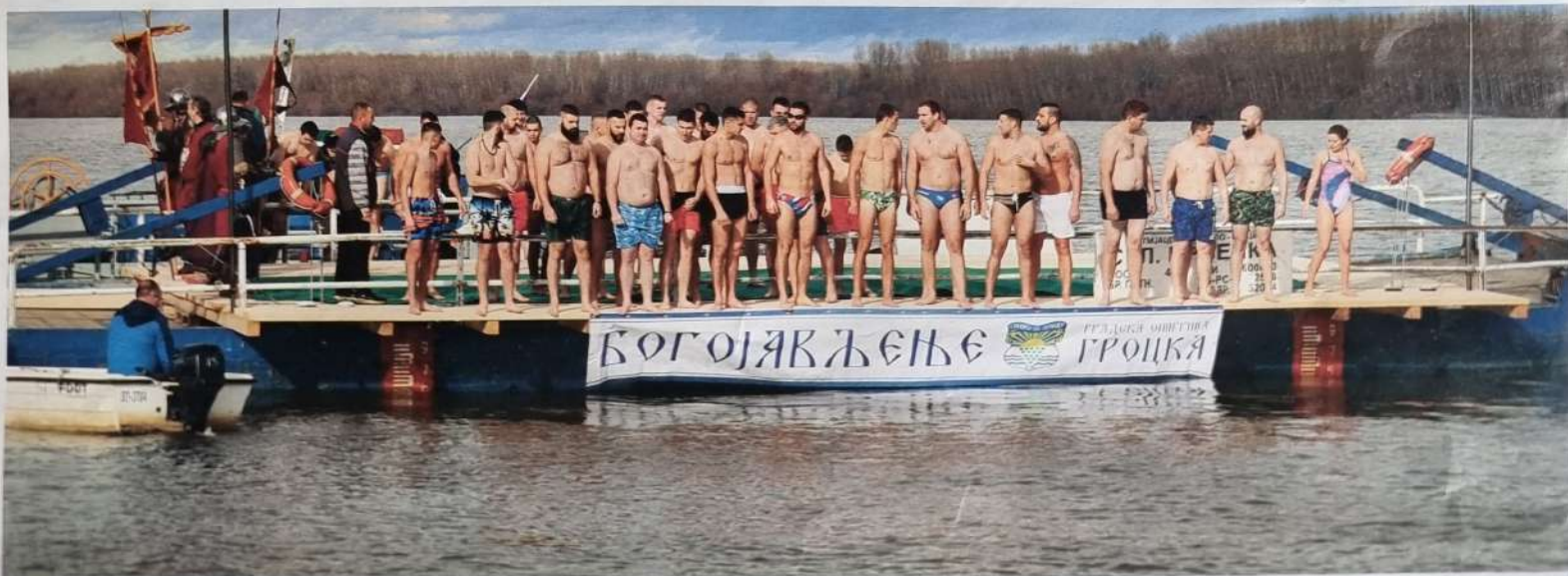
Ове године пливало је 47 пливача

манифестацију уз помоћ цркве Свете Тројице, јавних и приватних предузећа, удружења и појединца. Сви учесници добили су пригодне поклоне.