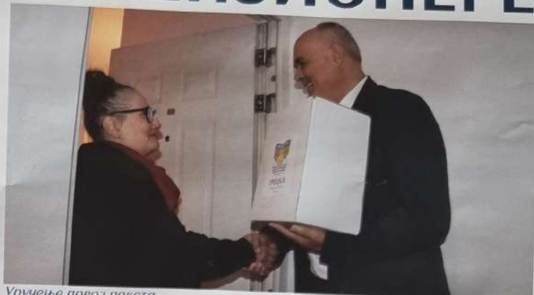
Уручење првог пакета

Уколико неки пензионер из неког разлога није добио свој пакет, може се јавити и пријавити преко телефонске централе општине Гроцка, а пакет ће бити достављен у најкраћем року.