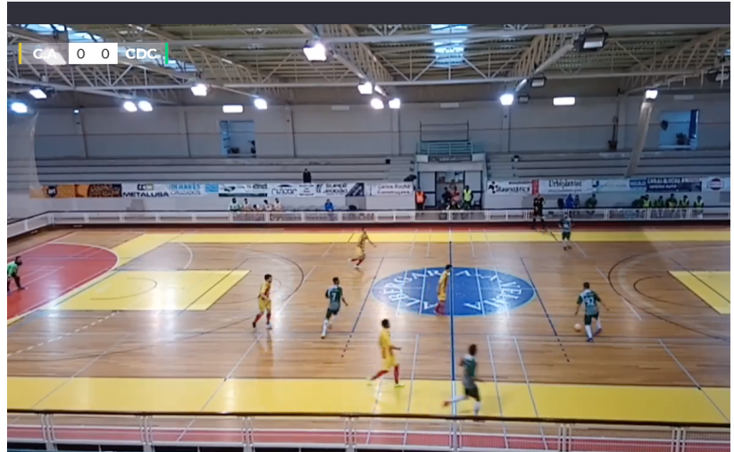
CA vs CD Cucujães, para rever na Clube de Albergaria TV

Nos escalões de formação, os Juniores foram a Travassô vencer por 5-4. No próximo sábado dia 10, às 15 horas, encerram a participação na 2ª fase do Campeonato Distrital com a recepção ao ADC Bairros. Os Iniciados empataram a dois, em casa, com o Futsal Azeméis. Na última jornada da 2ª fase recebem o GD Novasemente, domingo dia 11, às 11:30 horas. Os infantis saíram derrotados por 1-4 do encontro com o Saavedra Guedes para a 6ª e última jornada da 2ª fase, terminando assim em 3º lugar da série C, 15º lugar da classificação geral. Sábado dia 10, às 17 horas, iniciam a participação na Taça Distrital com a recepção ao Maceda.