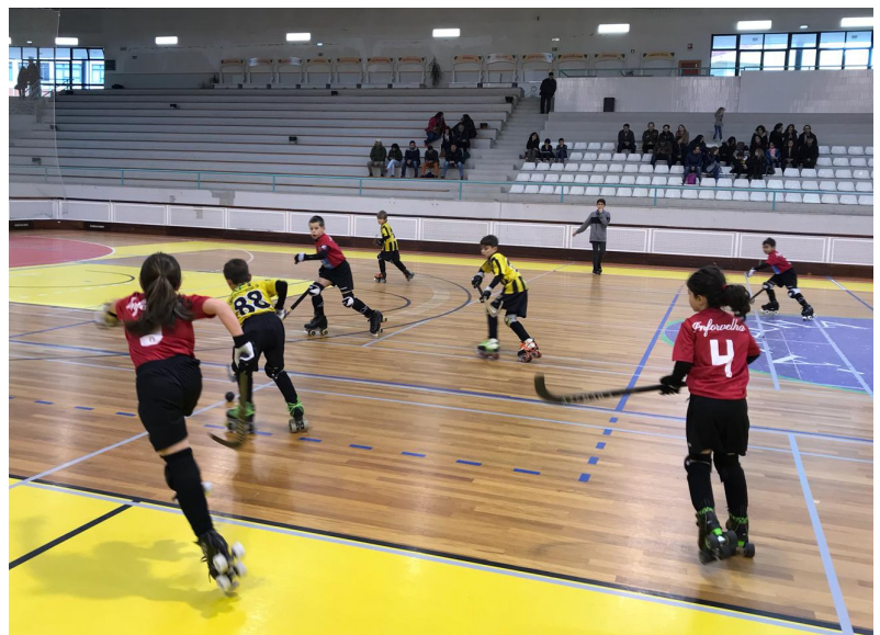
Jogo do escalão de Benjamins

No passado domingo, dia 4 de Março, a nossa equipa de Benjamins jogou no Pavilhão Municipal de Albergaria, pelas 16 horas, com o HA Cambra. Foi um bom jogo de Hóquei em Patins tendo em conta já os pormenores técnicos que cada equipa apresentou nesta fase de evolução dos jovens atletas. O próximo jogo é no domingo dia 11, às 15 horas, no reduto do HC Viseu.