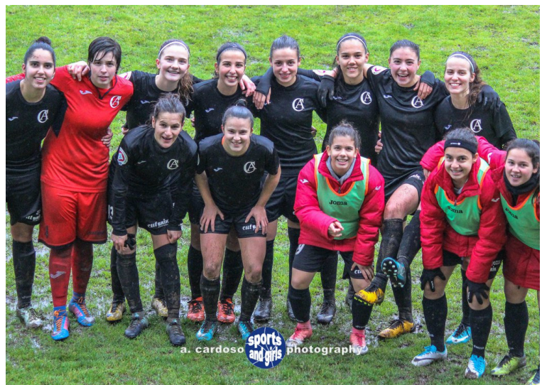
Clube de Albergaria avança para a meia-final