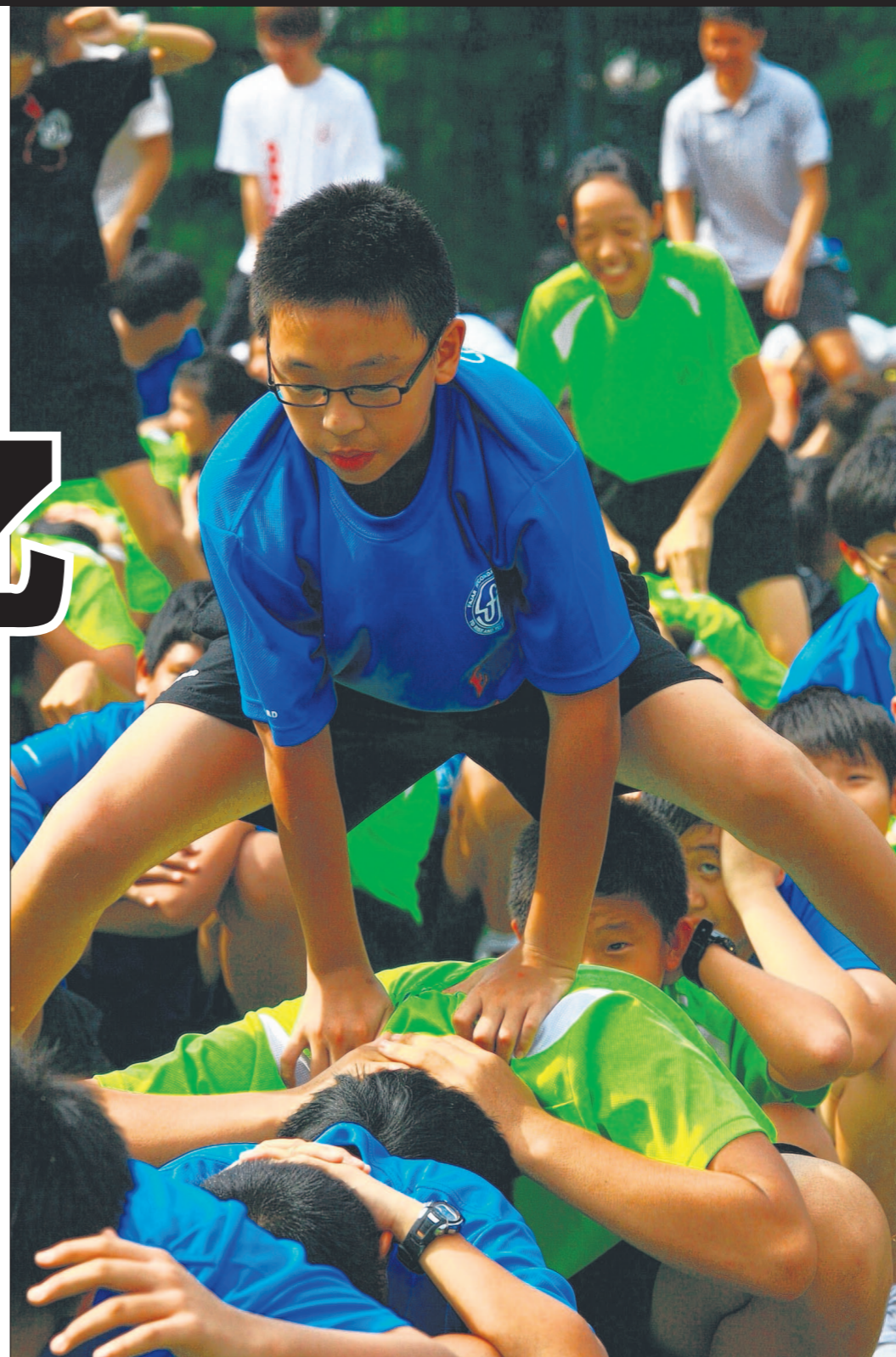
法嘉中学一起挑战最多人在同个地点蛙跳五分钟的健力士世界纪录。这也是学校的教师节庆祝活动之一。