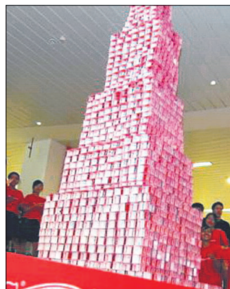
这个纸牌屋高达4.5米，是淡马锡中学师生在2007年叠成的。