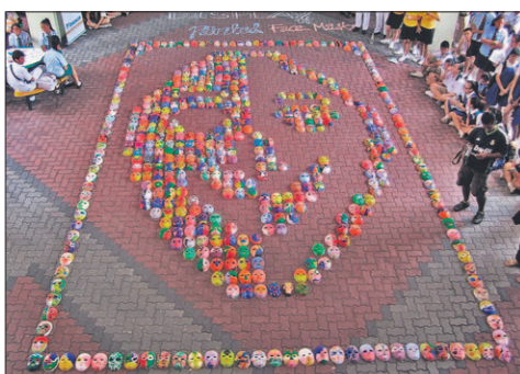
用505个面谱组成的最大面谱图形。