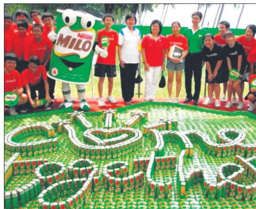
2009年，淡马锡中学师生配合国庆日庆祝活动，利用纸包装的Milo组成国庆标志。这个用包装饮料组成的最大标志长7.30米，宽4.15米。

个很好玩的经验，你和其他班的学生挤在一起，虽然认识不深，但大家挤在同一个空间，又仿佛认识了很久。”