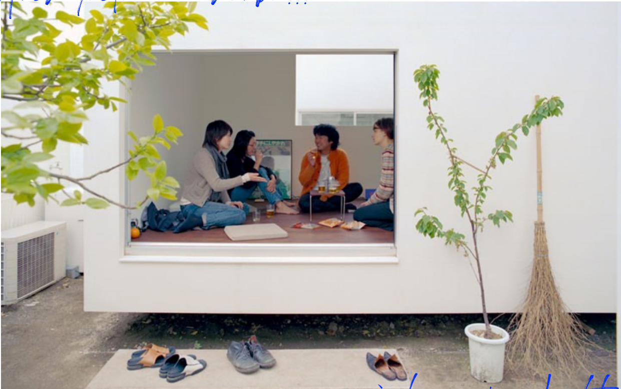
© Dean Kaufman, Moriyama House, Tokyo. Bureau de Ryue Nishizawa, Tokyo, 2005