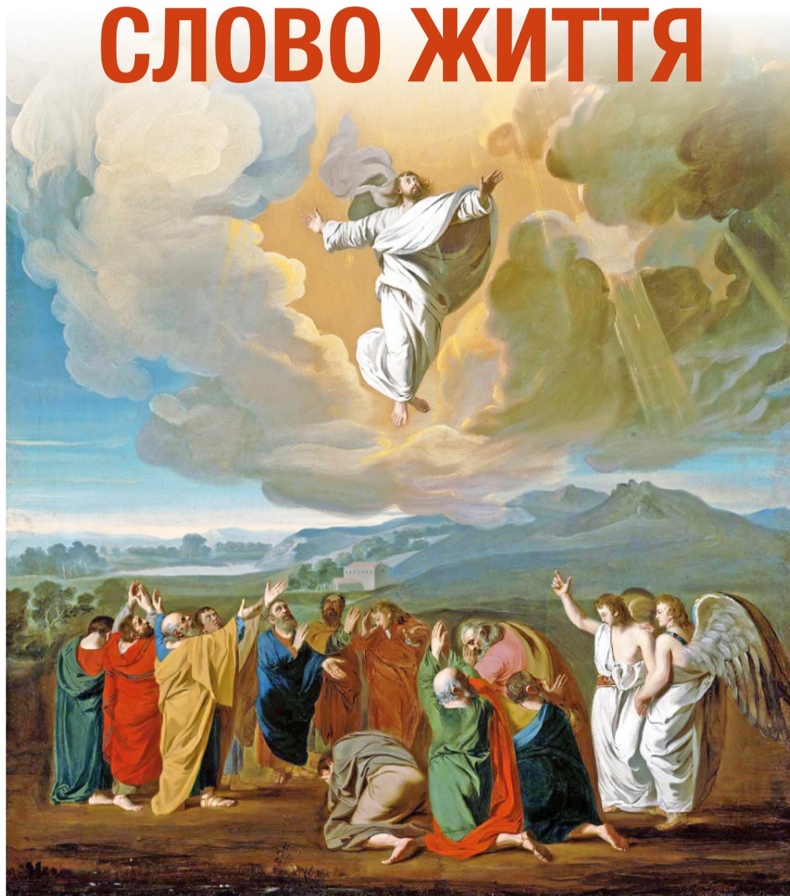
Джон Сінгльтон Коплі (1738–1815), «Вознесення», 1775 р.

Ісус добре знає, що це завдання перевищує їхні можливості, і тому обіцяє