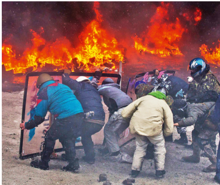
Київ, під час Революція гідності, 2013/14 рр.

На таке запитання у своєму інтерв'ю для видання «Українська правда» відповів Блаженніший Святослав. Він зазначив, що ми будемо ставити собі це питання ще не раз. «У мене було таке враження, що перше, що керувало людьми, це був страх. На Майдані було інакше, нами керувало почуття несправедливості, реакції на насилья. Ми хотіли показати, що нас просто так бити ніхто не буде».