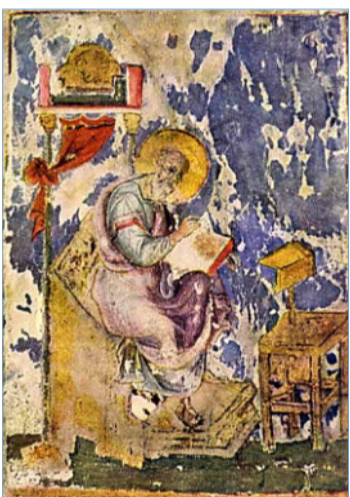
▲ Евангелист Іван. Мініатюра з Галицького євангелія, XIV ст. Державна Третьяковська галерея в Москві. Текст: «Прадідівська слава»

Приблизно двадцять кілометрів на північ від міста Бейрут на узбережжі Середземного моря знаходиться невелике місто Джібел (нині арабське, а в минулому фінікійське). Євреї називали це портове місто – Гевал, а греки – Біблос. Фінікійці були першокласними купцями – посередниками між Грецією та Єгиптом. Через порт Біблос в Грецію доставлявся єгипетський папірус.