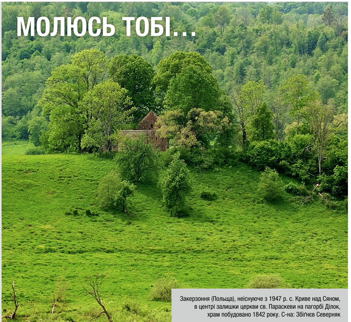
Закерзоння (Польща), неіснуюче з 1947 р. с. Криве над Сяном, в центрі залишки церкви св. Параскеви на пагорбі Ділок, храм побудовано 1842 року.