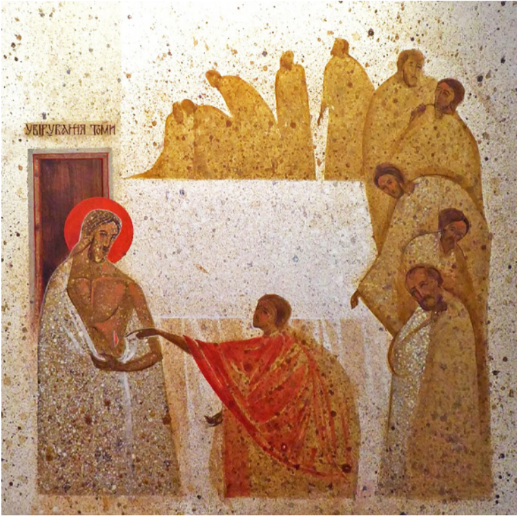
▲ Аліна Грубець, «Увірування Томи»

В Християнстві число 40 символічне: в Старому завіті 40 днів і ночей продовжувався потоп; 40 днів провів Мойсей на горі Синай, поки одержав від Бога Заповіді; 40 років блукали євреї по пустелі після виходу з єгипетської неволі. В Новому завіті 40 днів диявол спокушував Ісуса в пустелі; 40 днів являвся Господь своїм учням по своїм воскрес-