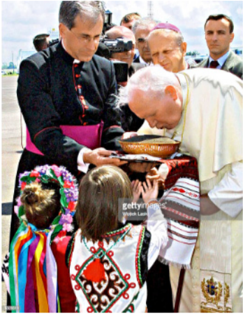
Київ, 23.06.2001 р. Ступивши на українську землю, Іван Павло II символічним поцілунком вшанує весь український народ

Святий отець Іван Павло II втішається особливим привілеєм серед українців. Ми з великою любов'ю і шанобою називаємо його «наш папа». Він був і довічно залишається «нашим», бо завжди відчував духовну близькість до України, до нашої Церкви, всього українського народу.