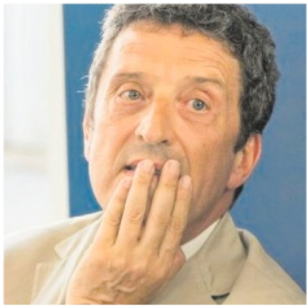
VENEZIA Pietrangelo Buttafuoco, presidente della Biennale