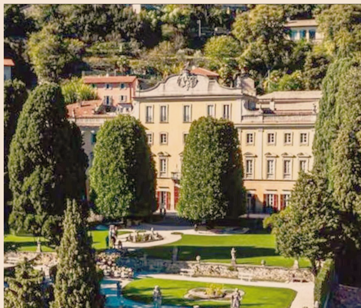
Trattative in corso. Il castello di Carate Urio, sul lago di Como, nel mirino di Lvmh