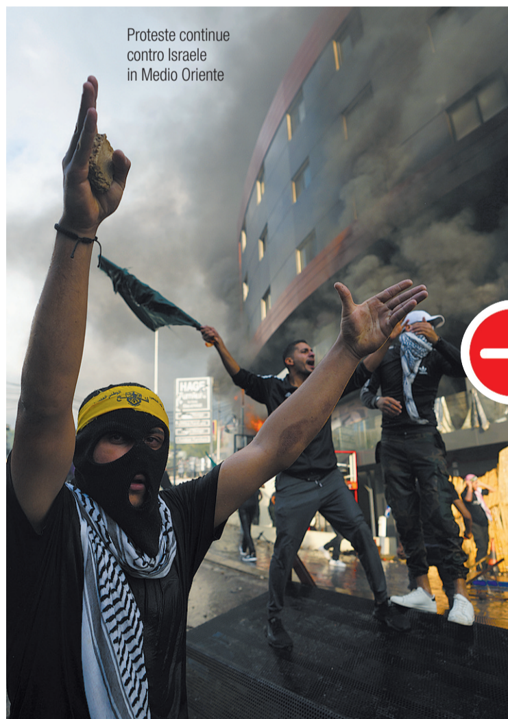
Proteste continue contro Israele in Medio Oriente