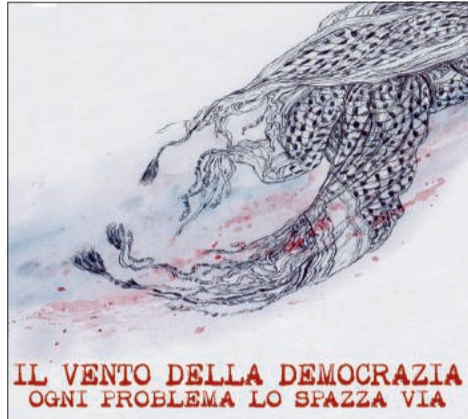
IL VENTO DELLA DEMOCRAZIA OGNI PROBLEMA LO SFAZZA VIA