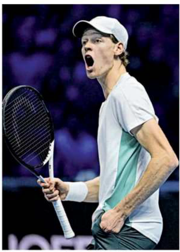
Il campione italiano Jannik Sinner, numero 4 al mondo

Sinner fa l'impresa e doma il mostro Djokovic