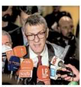
Maurizio Landini, Cgil

Il rapporto tra la politica e il sindacato è da sempre materia incandescente, da gestire con cura. Per anni si scelse la via della concertazione. • a pagina 25