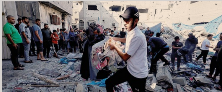
Dopo l'attacco. Palestinesi al lavoro tra le macerie a Khan Younis