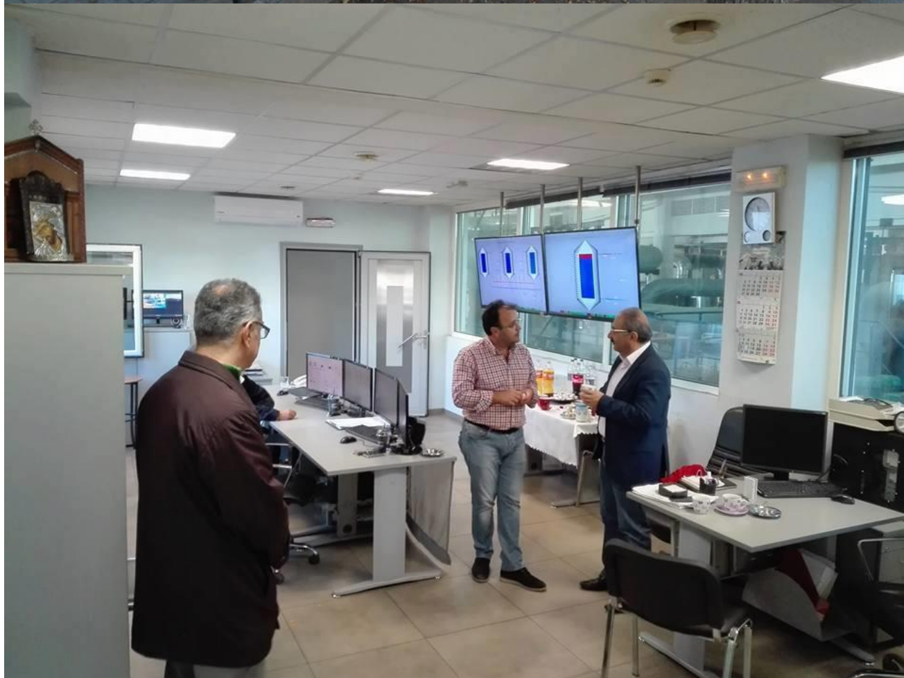
Η ΕΙΔΙΚΗ ΜΟΝΙΜΗ ΕΠΙΤΡΟΠΗ ΠΡΟΣΤΑΣΙΑΣ ΤΟΥ ΠΕΡΙΒΑΛΛΟΝΤΟΣ ΤΗΣ ΒΟΥΛΗΣ ΣΤΙΣ ΕΓΚΑΤΑΣΤΑΣΕΙΣ ΤΗΣ ΔΕΤΗΠ (ΦΩΤΟΡΕΠΟΡΤΑΖ)