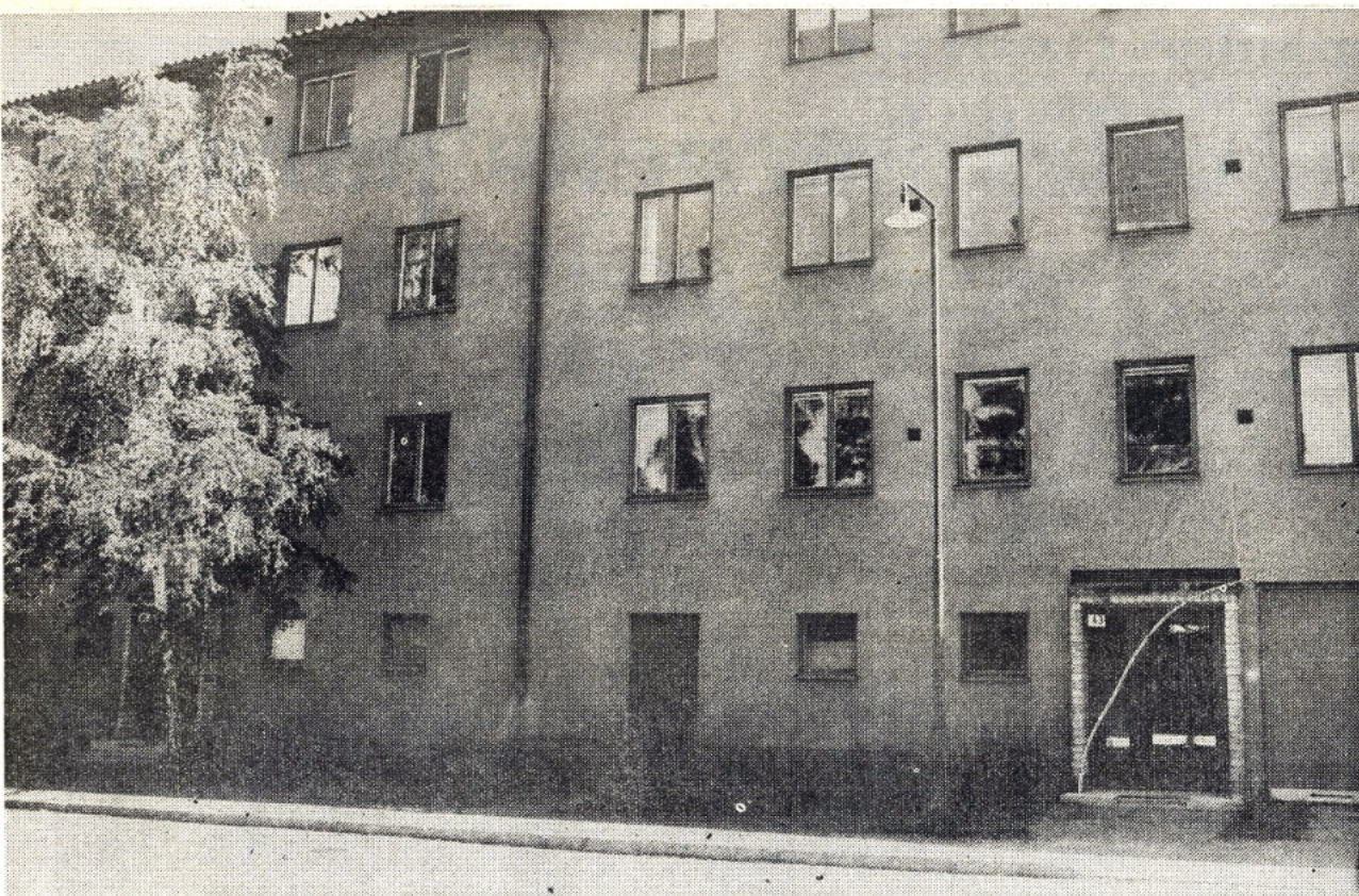
Bakom denna oansenliga dörr på Karlskronavägen i Björkhagen, mellan uppgång 41 och 43, förvarades två ton dynamit.