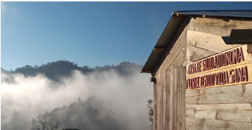
Clínica de Salud Comunitaria