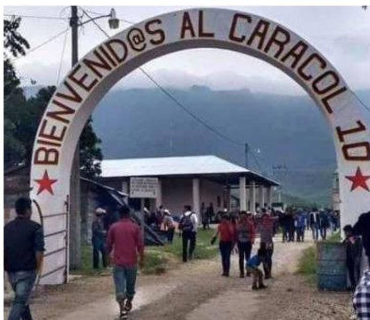
Caracol 10, Floreciendo la Semilla Rebelde.

La Comunidad Zapatista tzeltal-tsotsil de Nuevo San Gregorio está sembrada en 155 hectáreas de tierra recuperada. Son seis familias zapatistas, un aproximado de 58 personas que protegen, con un reconocido respeto, las tierras recuperadas . Se asumen como guardianas de la Madre Tierra y no como propietarios.