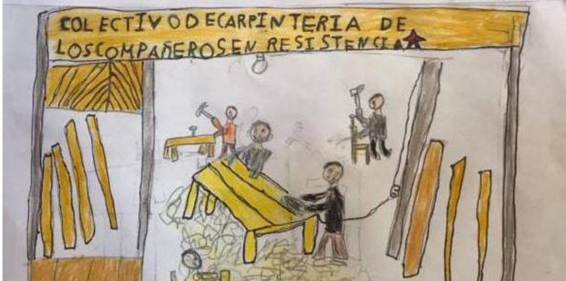
Dibujo realizados por las niñas y niños zapatistas de la comunidad

Gracias a la organización estamos resistencia de como sobre Vivir creando colectivos de producción, Educación y salud Tenemos carpintería, Artesanía de Bordados, colectivos de pollos, colectivos de Hortalisa colectivo de plantas medicinales, colectivos de alfalexia. Estamos muy alegres de seguir luchado con el colectivo somos niños y niñas, guardianes y guardianas de la madre tierra, no somos Provocadores. Estamos luchado por la vida de la humanidad.