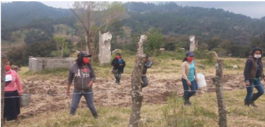
Invasión y cercamiento. Las mujeres tienen que arrastrarse para acceder al agua y leña.