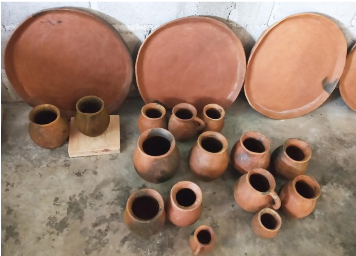
Colectivo de Alfarería