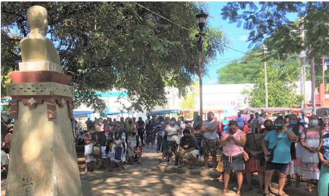
Asamblea en el ejido Halachó después de la remoción de representantes ejidales por posibles actos de corrupción en contubernio con FONATUR y Procuraduría Agraria.

Lo anterior es claro, porque contrario a lo que señalaba constantemente el presidente mexicano sobre la supremacía constitucional resumida en el principio “Nada ni nadie por encima de la constitución”, con el acuerdo en mención, el presidente mexicano se desdice colocándose él y a su gobierno por encima del Pacto Federal que es justamente la CPEUM. Y no faltamos organizaciones sociales que tal como con anteriores gobiernos, le recordamos esto al presidente, por ello, le somos incómodas e incómodos los defensores y las defensoras de la naturaleza y los derechos humanos.