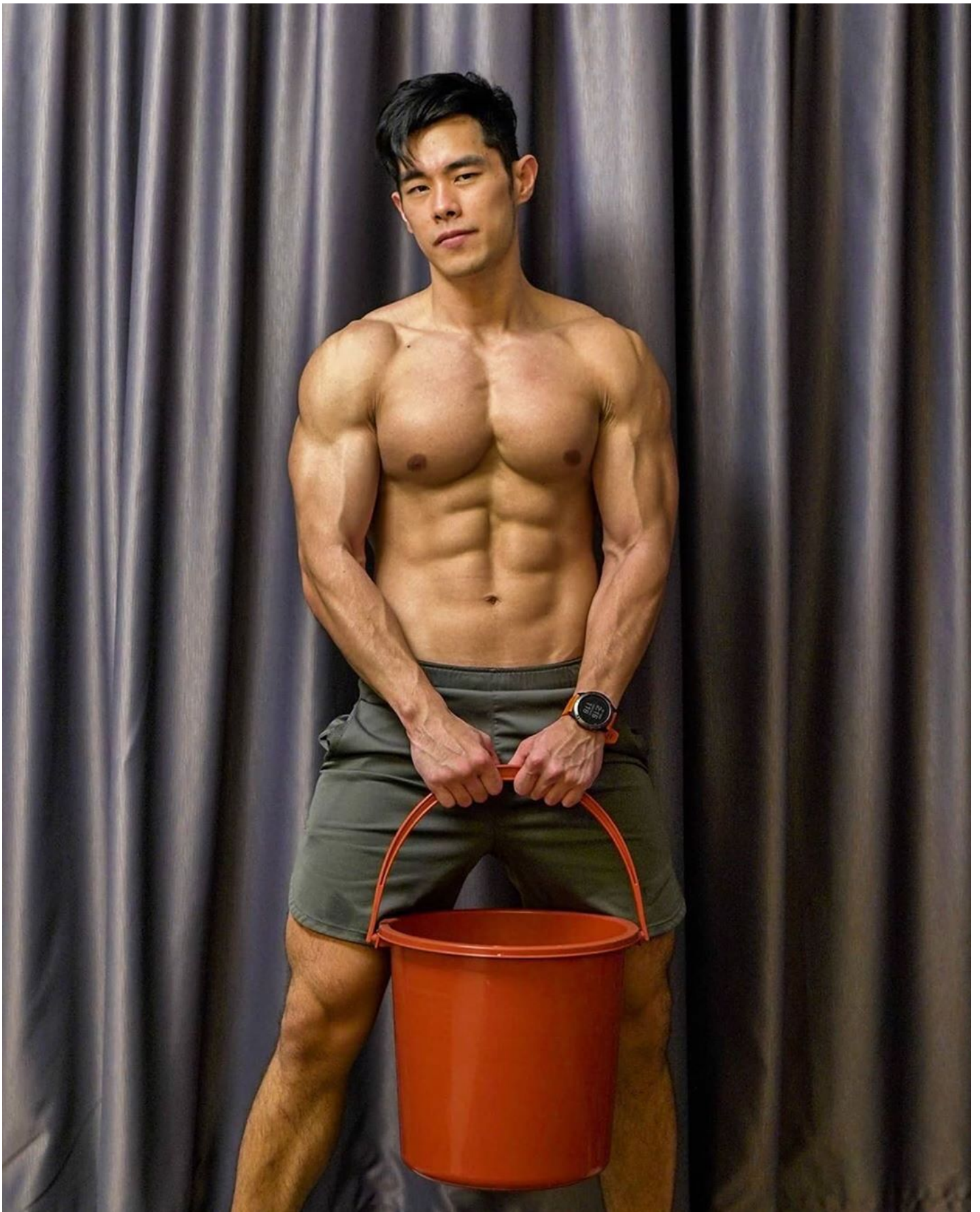
Sustanon 250 Organon Sustanon kaufen für 3.9 EUR Sustanon 250 ist ein in Öl gelöstes injizierbares 4- Komponentensteroid bestehend aus den folgenden vier Testosteronen: Testosteron Decanoat - 100mg Testosteron Isocaproat - 60mg Testosteron Phenylpropionat - 60mg Testosteron Propionat - 30mg