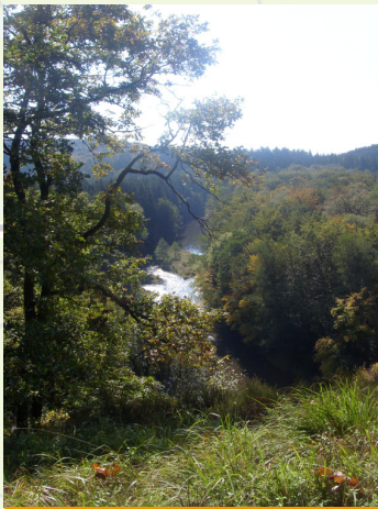
de Semois van op de Roche de l'Ecureuil

TOPOGRAFISCHE KAARTEN NGI: 67/3-4 (1:20.000)