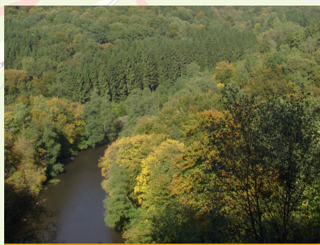
de Semois van op de Roche Pinco

Lacuisine is een levendig toeristisch centrum. De naam van het dorp herinnert aan de tijd dat de graven van Chiny er hun keukens installeerden voor de maaltijden tijdens grote jachtpartijen.